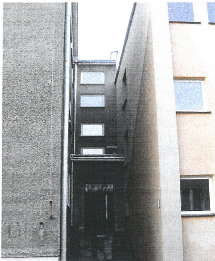
Zdj.nr.4- Schody zewnętrzne wejścia głównego