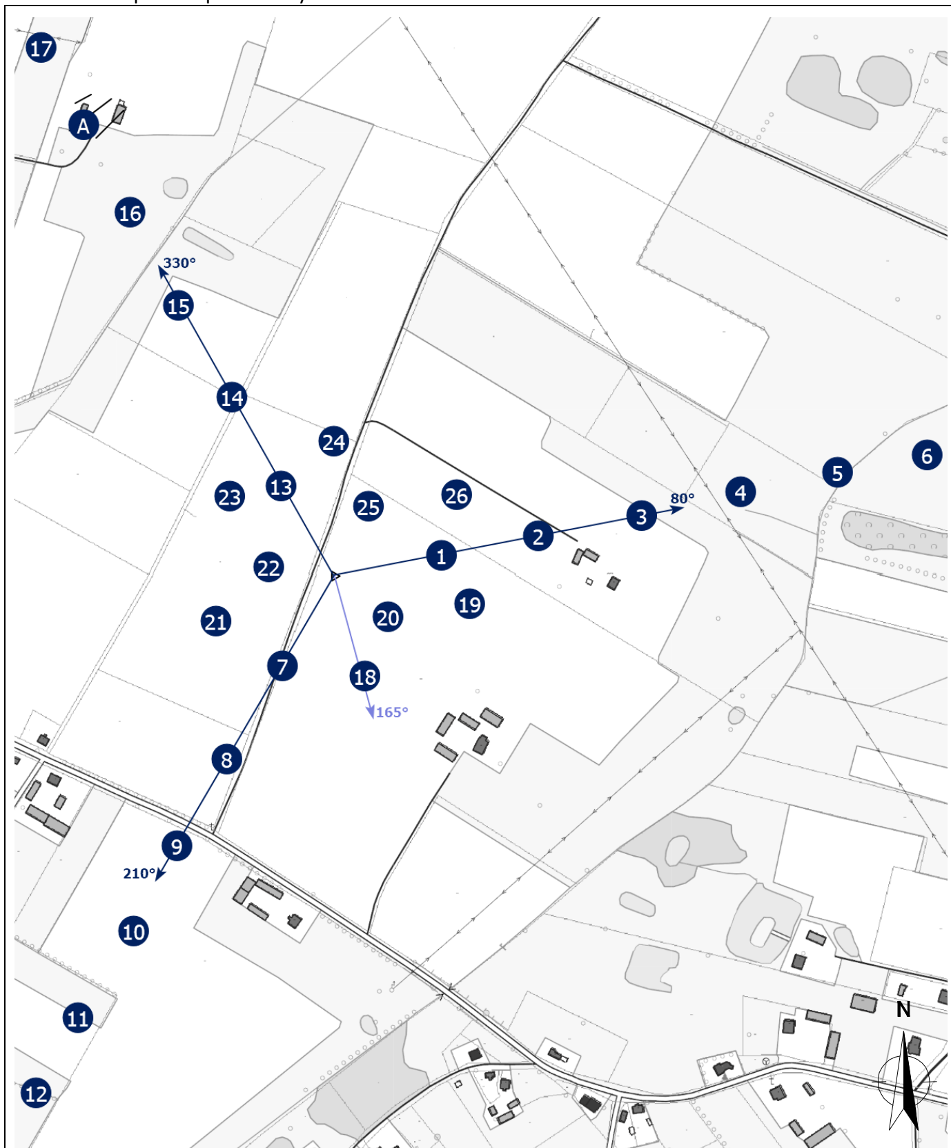
Zał. 2. Widok pionów pomiarowych