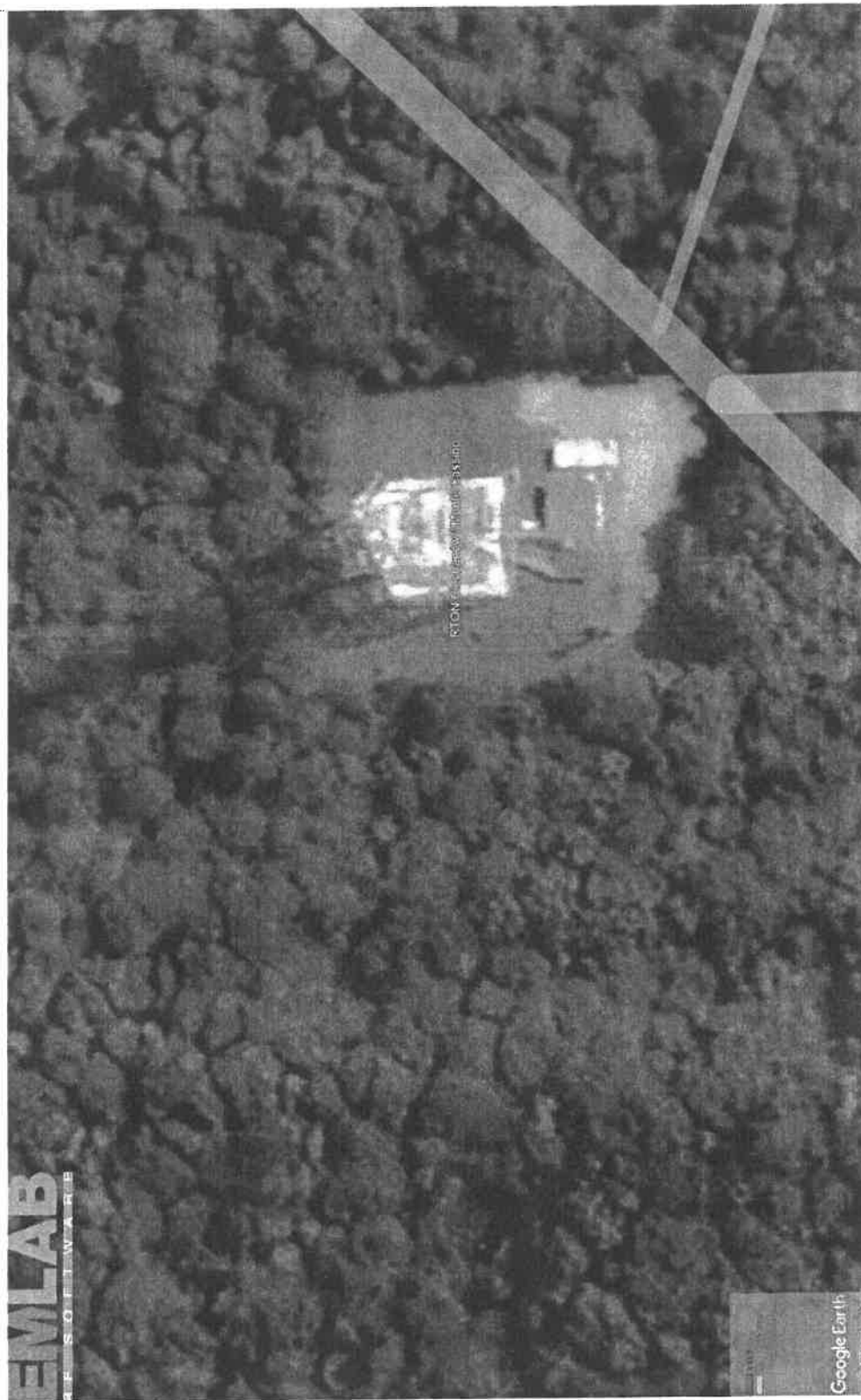
Rys. 2. Rzut poziomy rozkładu pola elektromagnetycznego anteny nowo projektowanej linii radiowej w otoczeniu RTON Ciechanów / Monte Cassino przewidzianej do zainstalowania na wysokości 52 m nad poziomem terenu.