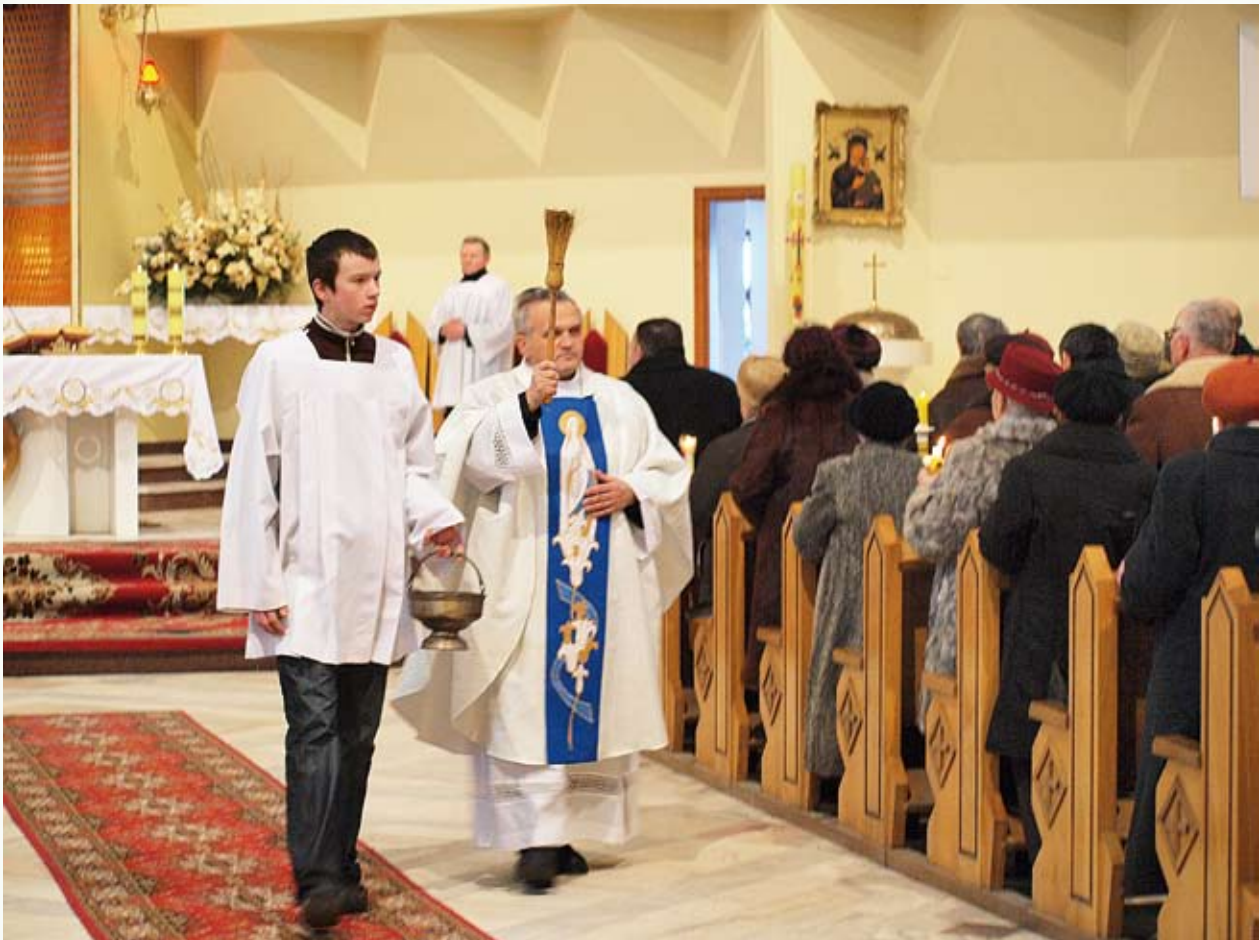
Obrzęd święcenia gromnic w kościele parafii św. Piotra w Ciechanowie, 2.02.2010 rok

legenda opowiada, że w lutowe mroźne noce Matka Boska chodzi po polach i miedzach z zapaloną świecą w dłoni. Ochronia oziminy przed mrozem i wskazuje drogę wśród zamieci zbłąkanym wędrowcom. Bogarodzicy towarzyszy w wędrowce wilk gromniczny, którego Matka Boska ocaliła przed zemstą rozsierdzonych chłopów. Motyw tej legendy maryjnej podjęła Kazimiera Iłakowiczówna w pięknym wierszu Matka Boża Gromniczna i lutowy wilk :