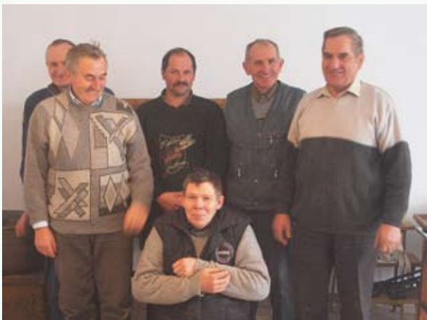
Członkowie Bractwa w Starej Białej, którzy odlewali świece w 2010 roku