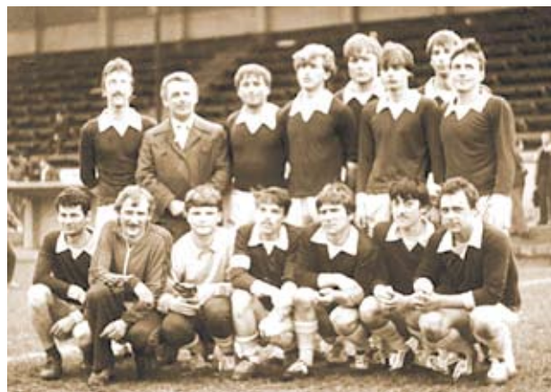
Drużyna ZKM Ciechanów - 3 miejsce w Mistrzostwach Polski Przedsiębiorstw Komunikacji Miejskiej, 1994 r.