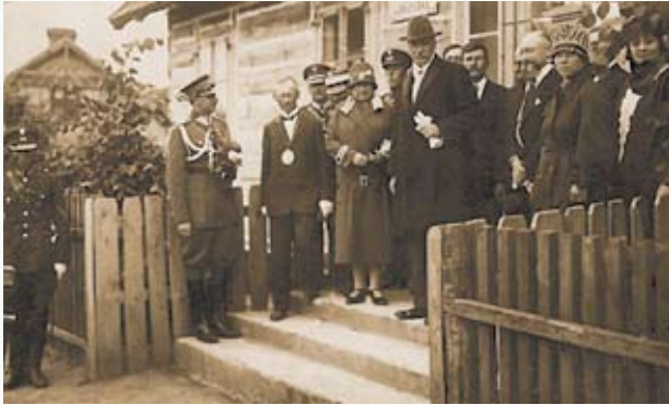
Prezydent Ignacy Mościcki w Grudusku, maj 1930 r.