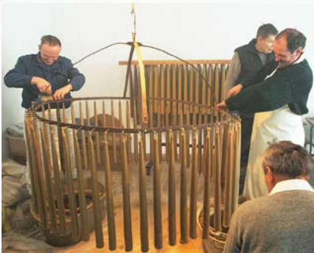
Praca na ukończeniu, świece są już prawie gotowe.

pół dnia. Pracują zwykle od rana do obiadu, ale jeżeli zapotrzebowanie na świece jest duże, wówczas po przerwie obiadowej przystępują do odlania drugiego koła . Członkowie Bractwa Różańcowego z Białej to ludzie o nieposzlakowanej opinii w swojej społeczności, traktujący pracę jak misję na rzecz wspólnoty parafialnej. Jest to zajęcie tradycyjnie męskie, co jeden z brastewnych żartobliwie skomentował następująco: Jak w kapłaństwie nie ma kobiet, tak i u nas... Niewiasty nie nadają się do tej roboty, bo są niecierpliwe, za dużo gadają i bez potrzeby mieliu ozoramy . Część gotowych świec przekazywana jest na potrzeby kościoła parafialnego, reszta pozostaje do dyspozycji Bractwa. Każdy chętny, także spoza parafii, może sobie woskową świecę u brastewnych z Białej nabyć. Uzyskane ze sprzedaży pieniądze przeznaczone są na zakup wosku potrzebnego do odlewania świec w następnym roku.