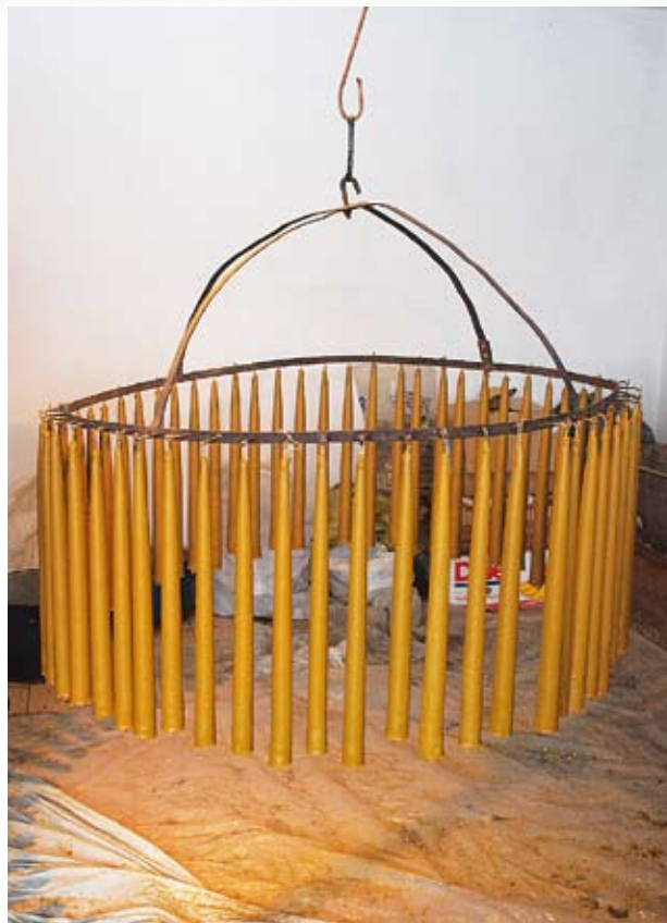
Praca zakończona, 59 świec stygnie na kole

W czasie nabożeństw w święto Matki Boskiej Gromnicznej bialski proboszcz, członkowie Bractwa i większość tamtejszych parafian trzyma w dłoniach zapalone woskowe świece, co sprawia, że kościół przesycony jest charakterystycznym aromatem. Utartym zwyczajem w trakcie niedzielnej i świątecznej sumy, sześciu mężczyzn z Bractwa Różańcowego adoruje ołtarz z zapalonymi woskowymi świecami w dłoniach.