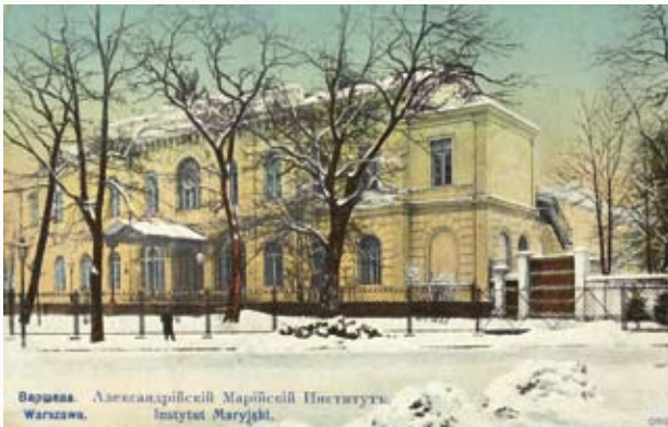
Aleksandryjsko-Maryjski Instytut Wychowania Paniem, Warszawa, koniec XIX wieku