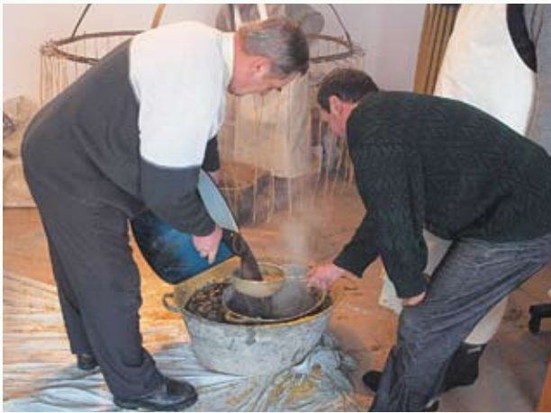
Cedzenie płynnego wosku przed przystąpieniem do odlewania świec