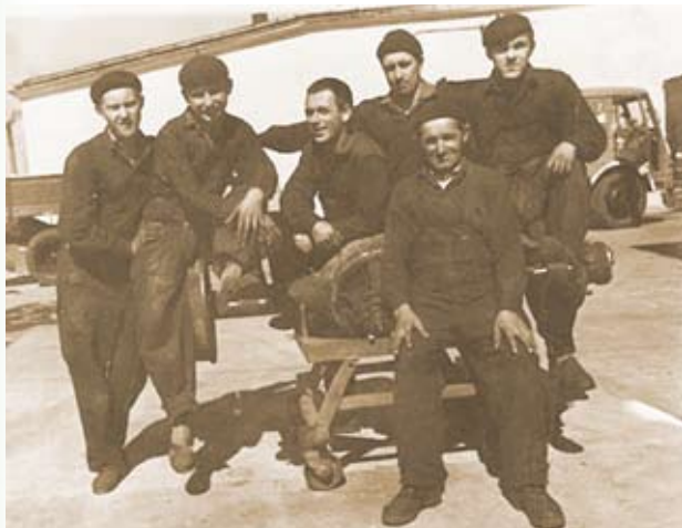
Pierwsza praca w TOR Ciechanów, lata 60.