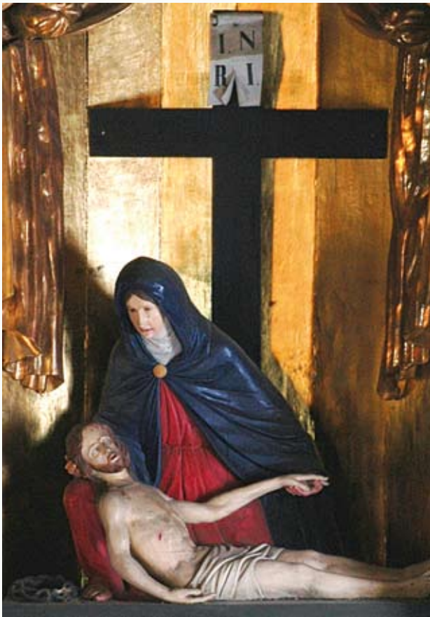
Gotycka Pieta z pierwszej połowy XVIII wieku

pojawiały się problemy z dyscypliną, a konwent ciechanowski podczas wizytacji generalnej zostaje zaliczony do konwentów o łagodnej dyscyplinie zakonnej.