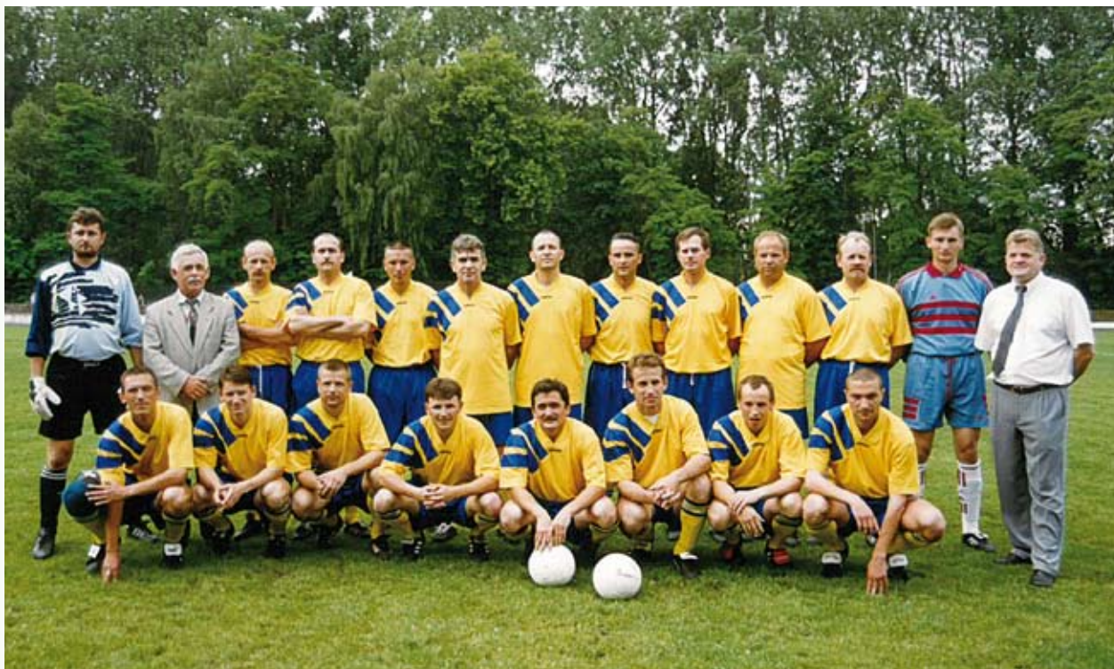
Jako kierownik 3-ligowej drużyny seniorów Mazovia Ciechanów, 1987 r.

Likwidacja wielu zakładów oraz zmniejszenie zatrudnienia w pozostałych oraz pojawienie się coraz większej liczby aut osobowych w latach osiemdziesiątych i dziewięćdziesiątych znacząco wpłynęły na spadek zainteresowania komunikacją miejską wśród mieszkańców Ciechanowa i okolic. Miasta nie było stać na coraz większe dotacje dla ZKM-u, dlatego konieczna była racjonalizacja przewozów, polegająca na zmianach w układzie linii komunikacyjnych i częstotliwości kursowania autobusów. Wprowadzone ograniczenia wymuszone nową sytuacją budziły sprzeciw pracowników i protesty załogi (strajk w 1988 roku). Po pierwszych wyborach