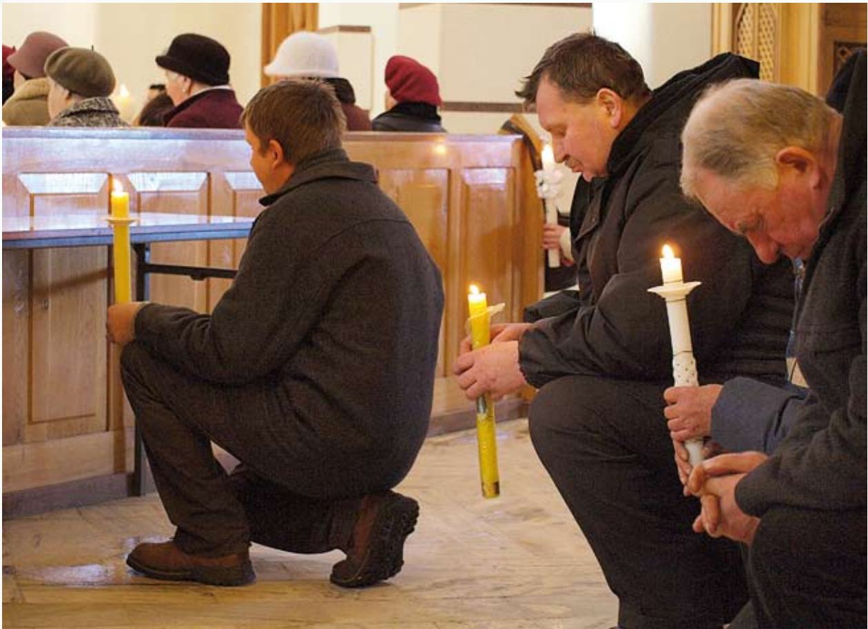
Nabożeństwo w kościele parafii św. Piotra w Ciechanowie, 2.02. 2010 rok

śniegu, i wilcze stada zatrzymuje w biegu. I tak na straży cichej wioski stoi, więc napaść przed Nią cofa się i boi, i nie śmie naprzód iść, gdy światło zoczy... Gdy w noc miesięczną wilki w polach wyją, ludzie się ze snu budzą z wielkim strachem, i słycać szepty pod słomianym dachem: - W Swoją obronę weź nas Maryo! I znów zasypia z tą ufnością wioska, że w śniegach czuwa nad nią Matka Boska 3 .