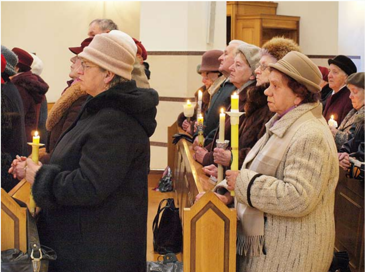
Nabożeństwo w kościele parafii św. Piotra w Ciechanowie, 2.02. 2010 rok

A kiedy jasną gromnicą świeci Panna Przczysta pośród zamieci, tuż i Gromniczny Wilk za swą Panią jarzy ślepiami.