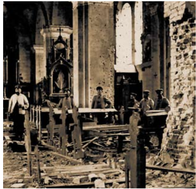
Grudusk – zniszczenia w czasie Wielkiej Wojny, lata 1915 – 1916