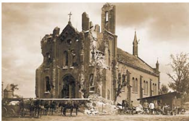
Grudusk – zniszczenia w czasie Wielkiej Wojny, lata 1915 – 1916