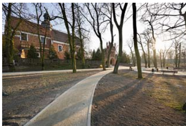
Kościół poklasztorny w parafii św. Tekli w Ciechanowie, fot. Andrzej Bayer

Według innej legendy jakiś antiochijski możnowładca pożądał Tekli, ale ona – znając podstawy wiary chrześcijańskiej – broniła się, raniąc przy tym napastnika i strącając mu z głowy diadem. Sąd skazał ją za to na pożarcie przez dzikie bestie, jednak na arenie lwice stanęły murem wokół niej i obroniły przed lwami. Cudownie uratowana, ochrzciła sama siebie, rzucając się do pobliskiej fosy pełnej groźnych bestii. Prześladowana za wiarę przez własnych rodziców, ścigana przez żołnierzy rzymskich, uciekła do syryjskiego miasta Malula. Tam pionowa skała zagroziła jej drogę, ale dzięki żarliwym modlitwom ściany skalne rozstały się. Tak powstał malowniczy wąwóz św. Tekli,