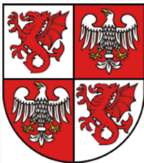
Herb Księstwa Mazowieckiego, (wywodzi się z dwóch herbów – orła piastowskiego i herbu księstwa czerskiego; pod tym herbem m.in. walczyło rycerstwo mazowieckie pod Grunwaldem); źródło - domena publiczna

(nie w Krakowie). Niezawisłe Księstwo Mazowieckie prowadziło własną politykę wewnętrzną i zagraniczną. Książę Konrad, starający się o zjednoczenie ziem polskich pod swymi rządami, uznał zapewne, że nie dokona tego, jeżeli północno-wschodnie granice jego państwa będą narażone na ciągłe okrutne i krwawe ataki pogańskich Prusów. Znalazł na to rozwiązanie, które wydawało się doskonałe.