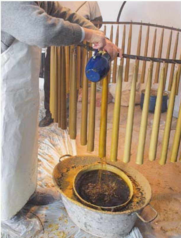
Naczynie z płynnym woskiem pływa w waniencie wypełnionej wodą, która zbiera krople rozpryskującego się wosku.

Każdy zakończony jest u góry pętelką, nakładaną na haczyk obręczy. Knoty przed zawieszeniem zanurza się w płynnym wosku, który tężejąc, prostuje sznurki.