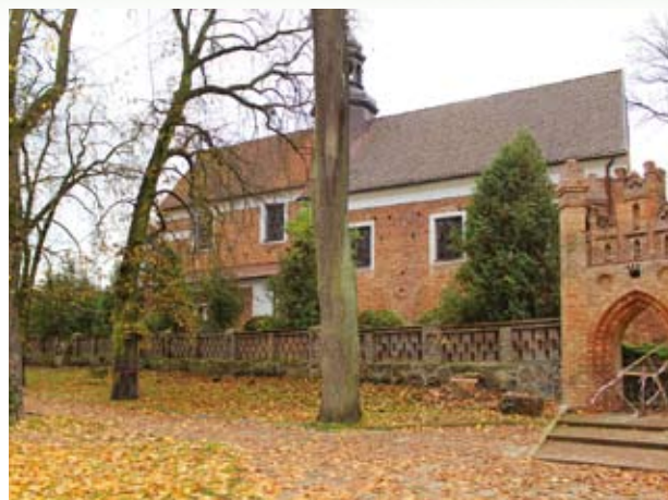
Kościół poklasztorny w parafii św. Tekli w Ciechanowie

Św. Tekla jest patronką umierających oraz cierpiących na choroby oczu. Wzywano ją w czasie zarazy i pożarów, chroniła przed dzikimi zwierzętami i ukąszeniami węży. Święta jest patronką hiszpańskiego miasta Tarragona i noszącego jej imię miasta w Salwadorze. Jej postać była źródłem natchnienia dla wielu artystów.