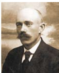
Błażej Krzywkowski, ok. 1938 r.

Błażej Krzywkowski, zapomniany człowiek – patriota, rolnik, polityk i działacz spółdzielczy, poseł na Sejm Ustawodawczy, Senator Rzeczypospolitej Polskiej I kadencji, zasłużony dla ziemi ciechanowskiej i Mazowsza.