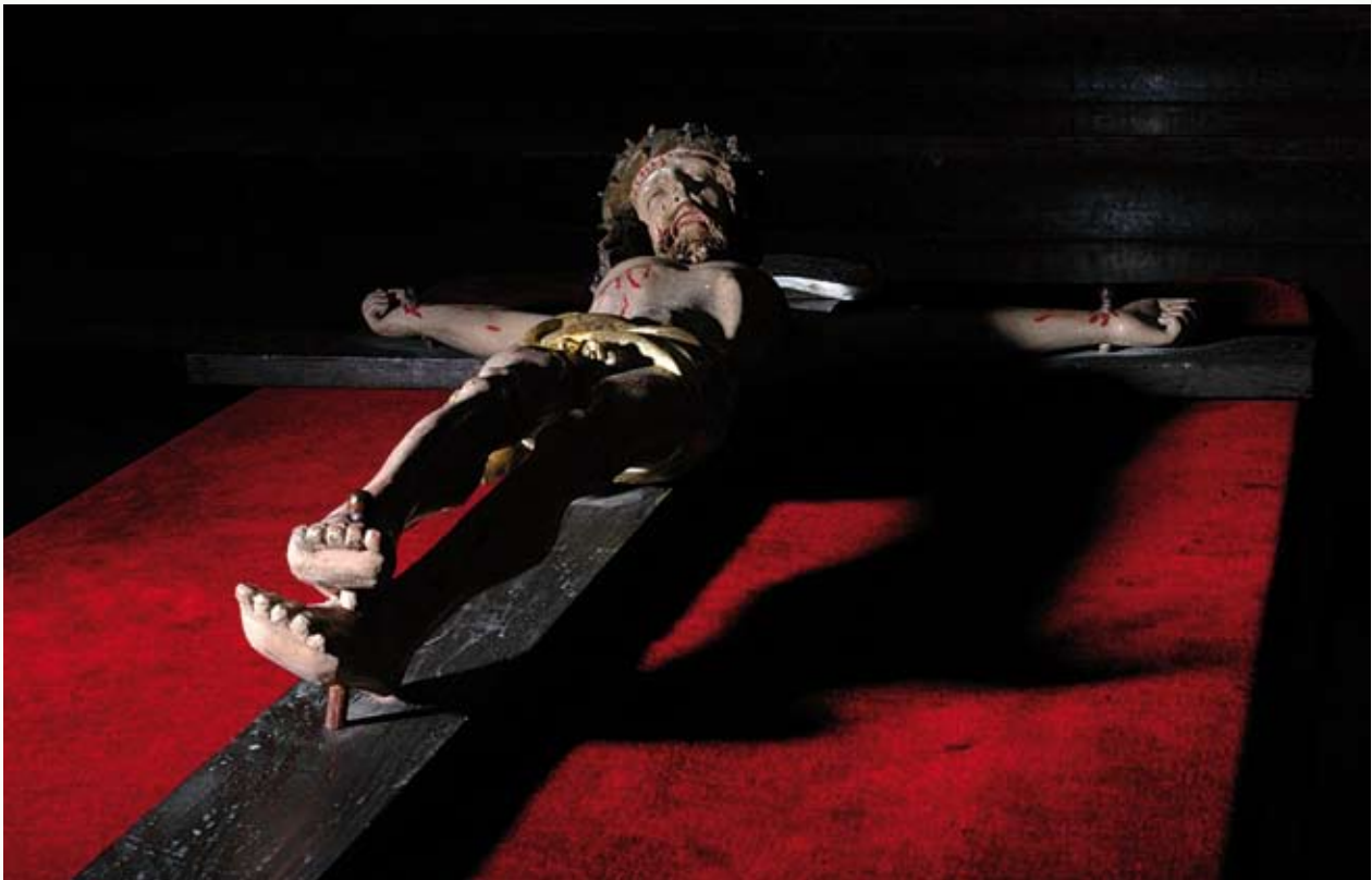
Krucyfiks z XVI wieku

i Orylskiej), który po pożarze wcześniejszego parafialnego kościoła N.M.P - a przed ukończeniem budowy fary spełniał prawdopodobnie funkcję kościoła parafialnego. Przy tym kościele św. Piotra znajdował się również cmentarz grzebalny, tak więc w Ciechanowie, liczącym wówczas ok. 2500 mieszkańców, funkcjonowały cztery kościoły (nie licząc kaplicy zamkowej p.w. św. Stanisława). W połowie XVI wieku wzmiankowany jest ponadto kościół św. Ducha (zlokalizowany w rejonie dzisiejszej ulicy Warszawskiej w pobliżu bloku nr 27), rozebrany w 1800 roku. Można więc zasadnie stwierdzić, że życie religijne mieszkańców naszego grodu było bardzo intensywne, a ofiarność wiernych pozwalała na utrzymanie kilku świątyń i pracujących przy nich duszpasterzy zakonnych oraz diecezjalnych.