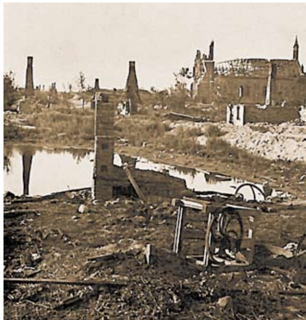
Grudusk – zniszczenia w czasie Wielkiej Wojny, lata 1915 – 1916