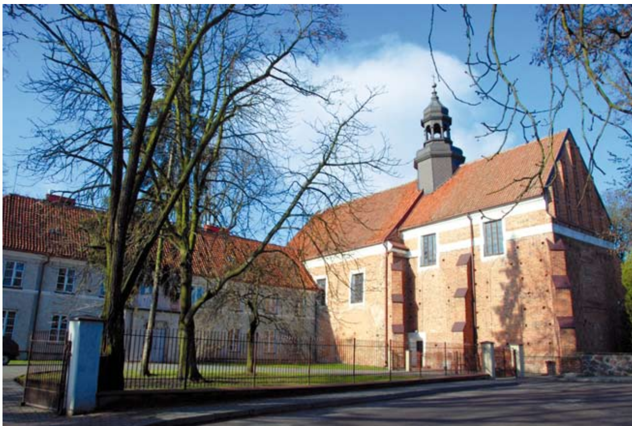
Kościół poklasztorny – elewacja południowa