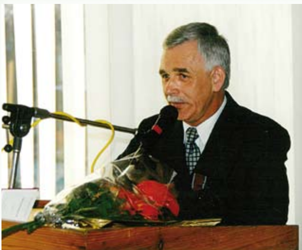
Na sesji Rady Miasta Ciechanów, po otrzymaniu Złotego Krzyża Zasługi, 1998 r.

Zasłużony Pracownik Gospodarki Komunalnej (1979), Srebrny Krzyż Zasługi (1983), Zasłużony dla Województwa Ciechanowskiego (1997), Zasłużony dla Transportu (1998), Złoty Krzyż Zasługi (1998), Zasłużony dla Komunikacji Miejskiej w Polsce (2000).