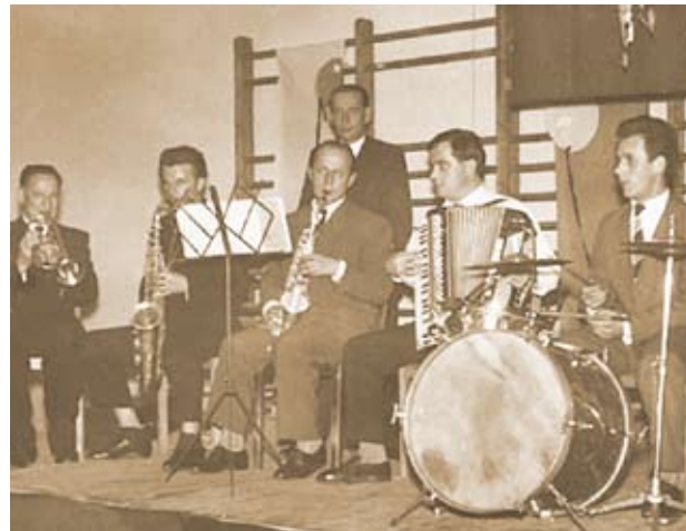
Jako perkusista w zespole muzycznym, lata 60.