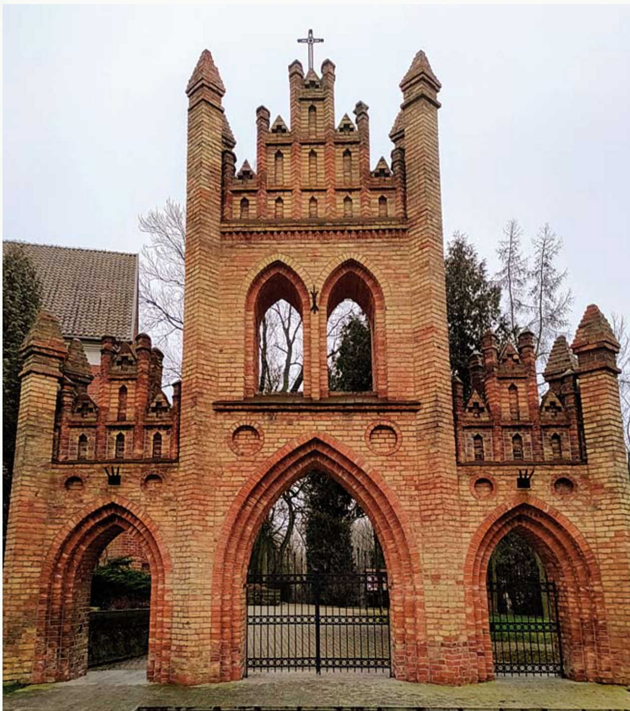
Brama – dzwonnica przy kościele poklasztornym