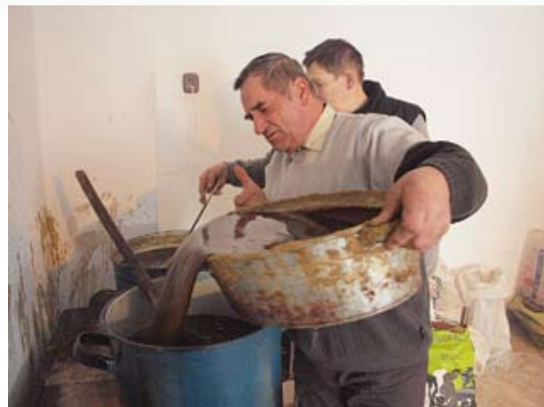
Podgrzewanie i przelewanie płynnego wosku

Świece, identyczne w kształcie jak gromnice, stały w świecznikach na ołtarzach i płonęły podczas nabożeństw. W przeszłości w liturgii używano wyłącznie świec woskowych. W okresie powojennym w produkcji przemysłowej wszelkich świec, także gromnic, wosk został zastąpiony przez inne tworzywa, jak stearyna, parafina i olej sojowy. Obecnie liturgiczne światło w kościołach podczas nabożeństw zapewniają ołtarzowe świece olejowe z wymiennymi wkładami. W czasach, kiedy na ołtarzach płonęły świece woskowe, znaczenie miała jakość surowca użytego do wyrobu świec i ich barwa. Zygmunt Gloger w 1900 r. pisał: Gromnice z wosku białego zowią się światłem „jarzącem” i używane być powinny przy wystawieniu Najświętszego Sakramentu i wszystkich uroczystościach wesółych w kościele, żółte zaś na pogrzebach jako oznaka żałoby, a w czasie postu na znak pokuty i smutku 5 .