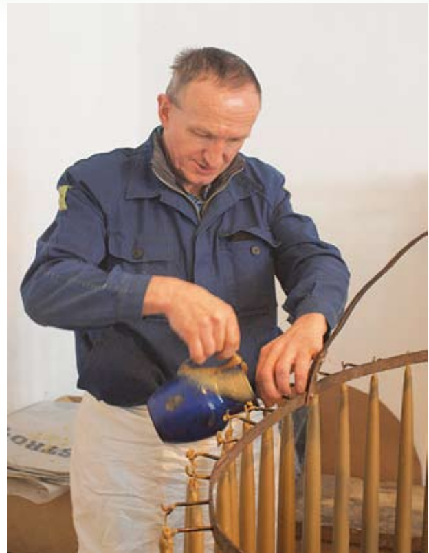
Płynny wosk leje się na knoty za pomocą blaszanego czerpaka-dzbanuszka.

Po wykonaniu tych czynności można przystąpić do odlewania świec. Gorący wosk cedzony jest przez drobne sito do dwóch blaszanych misek, umieszczonych w wanienkach wypełnionych wodą. Dwa zestawy tych naczyń ustawione po przeciwnych stronach koła umożliwiają jednoczesną pracę dwóm mężczyznom, którzy czerpią płynny wosk blaszanymi dzbanuszkami i polewają cienkim strumieniem kolejno wszystkie knoty. Wosk, który nie zdąży stężeć na knotach, spływa do miski lub pada na wodę, skąd łatwo go później zebrać i ponownie stopić. Mężczyźni lejący wosk stoją w miejscu, a koło z knotami obracane jest przez nich wokół osi. Aby płynny wosk w miskach nie zastygł, co pewien czas dolewany jest do nich gorący, z garnka stojącego na trzonie kuchennym.