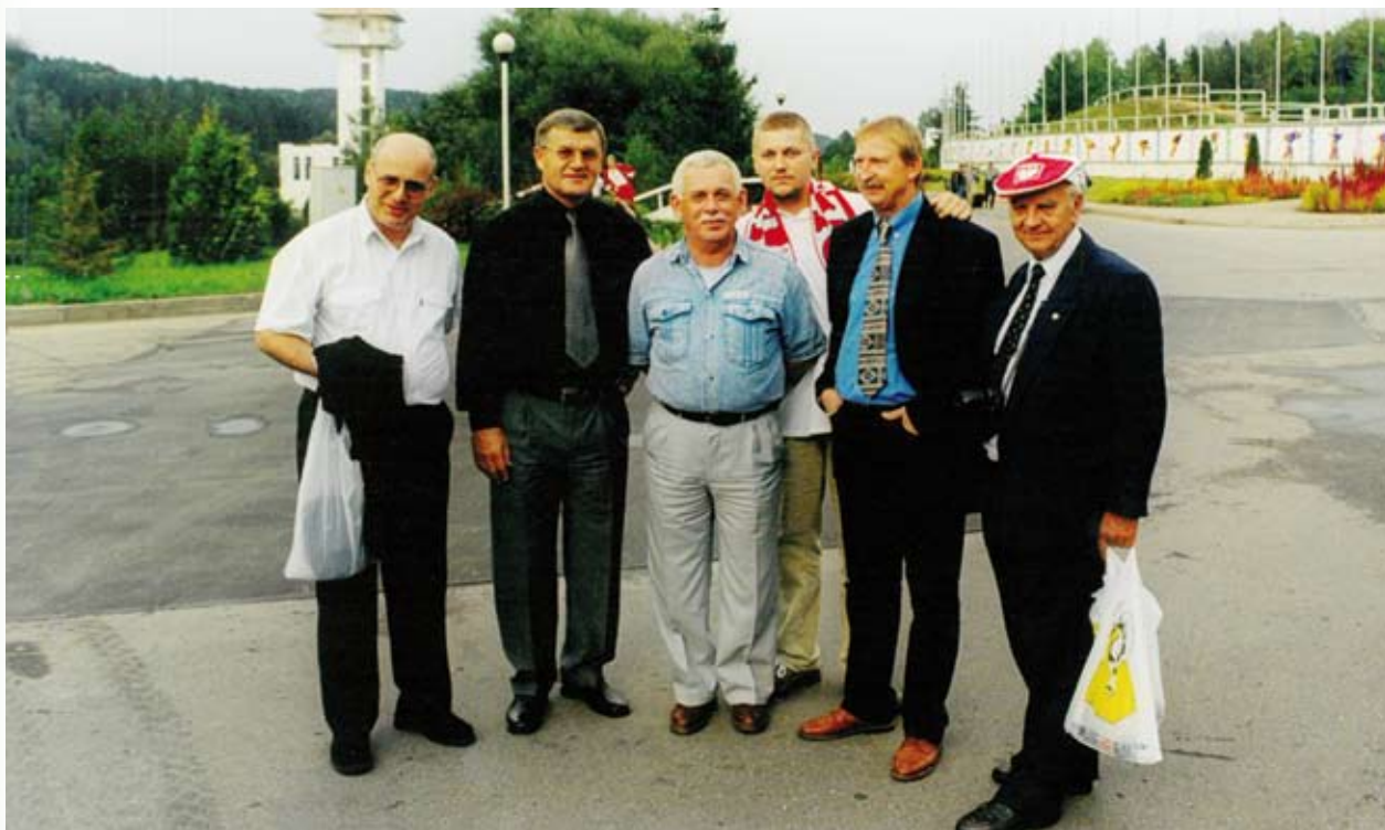
Mińsk Białoruski, przed meczem Białoruś-Polska w towarzystwie m.in. W. Lubańskiego i A. Szarmacha, 2001 r.

Odbiło się to niewątpliwie na moim zdrowiu. Jeszcze do końca grudnia 2000 roku byłem na zwolnieniu lekarskim jako pracownik zakładu, a od stycznia 2001 roku odszedłem na rentę po 40 latach pracy, w tym 35 w zakładach komunalnych. Praca zawodowa oprócz problemów dawała mi jednak ogromną satysfakcję i spotykała się z uznaniem innych, czego dowodem były liczne medale i odznaczenia, m.in.