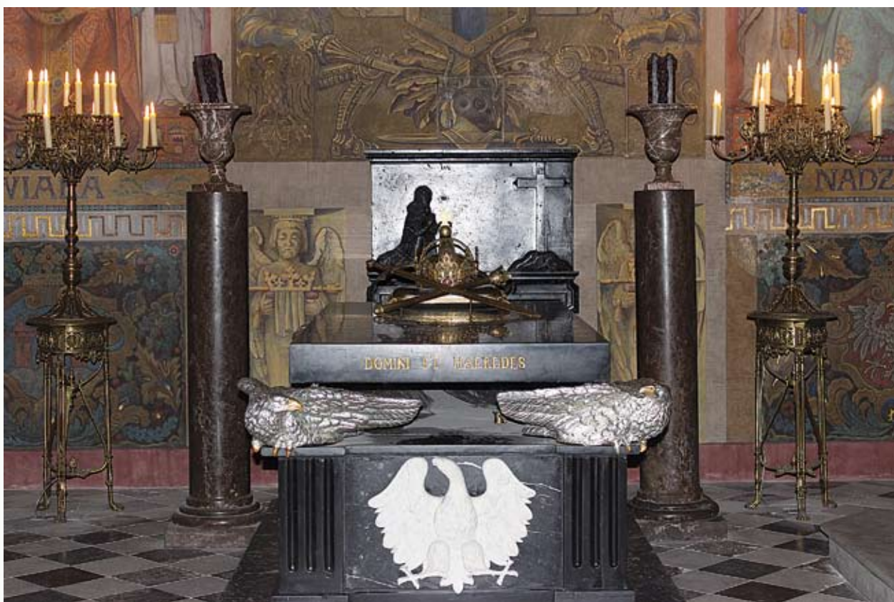
Groby królewskie w katedrze płockiej

Jakkolwiek było, książę Konrad - uporządkował się w ten sposób z wojnami na północnym wschodzie - mógł zająć się walką o umocnienie władzy w stołecznym Krakowie, co mu się zresztą nie udało. Niemniej dla swego państwa (mazowieckiego!) osiągnął wiele. Był władcą suwerennym na Mazowszu, Kujawach, w Sieradzu, Nakle, Drohiczyne (proszę postawić punkty na mapie i zobacz państwo, jak wielkie było to księstwo). Niestety, w czasach powszechnego rozbitcia dzielnicowego, po śmierci walecznego księcia Konrada jego państwo uległo podziałowi. Mazowsze (bo na nim się koncentrujemy) przypadło księciu Ziemowitowi I (stracił życie w czasie napadu litewskiego na zamek