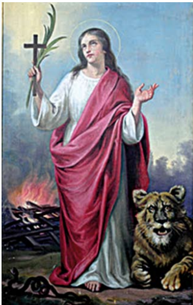
Przedstawienie św. Tekli

Ta święta kościoła katolickiego i prawosławnego uważana jest za pierwszą męczennicę chrześcijańską, chociaż jej autentyczność potwierdza jedynie bardzo stary i powszechny kult oraz zapisy w apokryfach. Imię Tekla wywodzi się z języka greckiego i pochodzi od słów oznaczających „chwalić Boga”.