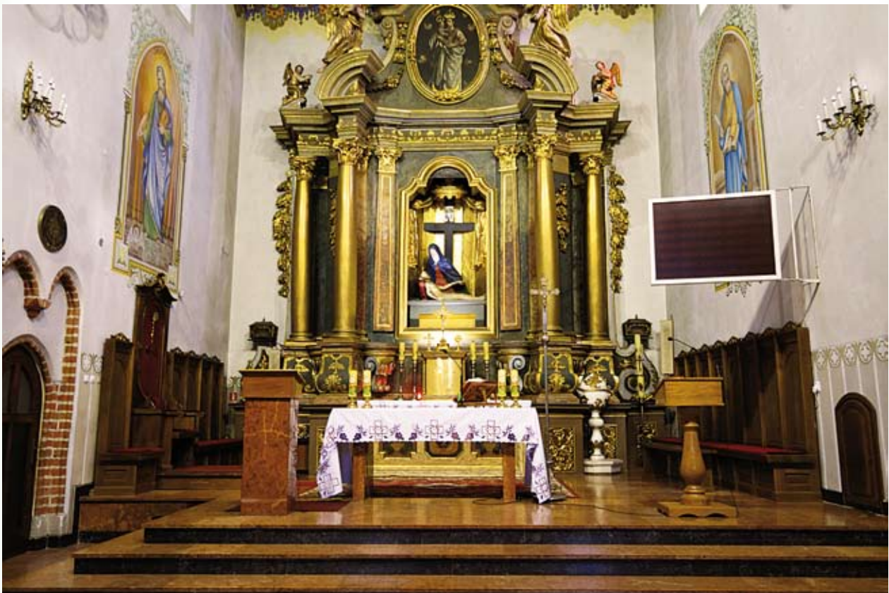
Oltarz główny z Pietą i najstarszym w Ciechanowie obrazem Matki Bożej z pierwszej połowy XVIII wieku