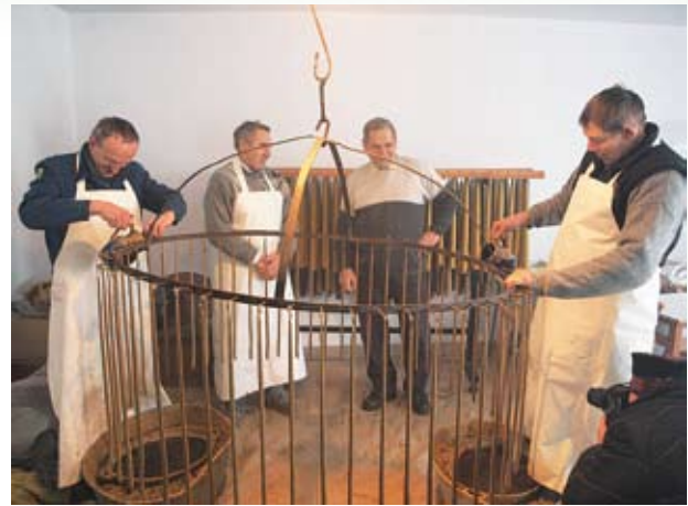
Laniem wosku na knoty zajmuje się jednocześnie dwóch mężczyzn

formy ustawionej pionowo należało włożyć bawełniany lub konopny knot (zawieszony na patyczku ułożonym na krawędzi wylewu) i napęlić rurkę płynnym woskiem. Kiedy masa stężała, świeca była gotowa.