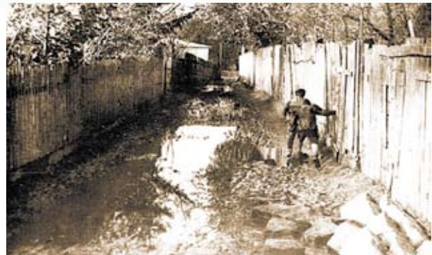
Ulica Orylska przed regulacją (około 1924 roku). Widok w stronę „wikariówki” i kościoła poaugustiańskiego. Fotografia pochodzi ze zbiorów Jerzego Olszewskiego.

jest brama, która przez wieki pełniła również funkcję dzwonnicy; w dwu górnych otworach zawieszono dzwony. W ostatnim czasie poddana fachowej renowacji, pięknie się prezentuje i zaprasza do świątyni.