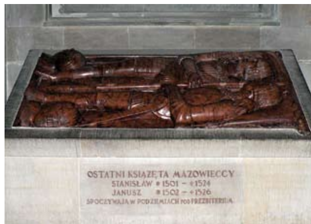
Grobowiec książąt mazowieckich w katedrze św. Jana w Warszawie