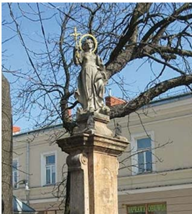
Pomnik św. Tekli w Kielcach

Św. Tekla przedstawiana jest w ikonografii najczęściej w postawie stojącej, z bosymi nogami. Proste, długie włosy, przykryte czasami chustą, spadają na ramiona. W szatach dominuje kolor czerwony, a w rękach lub w dłoni trzyma krzyż. Przy nogach często ukazany jest lew lub wąż. W kościele na wschodzie i zachodzie jej kult rozwinął się od IV wieku. Jej święto przypada 23 września, a w ciechanowskim „klasztorku” odpust odbywa się w pierwszą niedzielę po tym dniu. Od wielu, wielu lat było to ogromne wydarzenie dla całej okolicy.