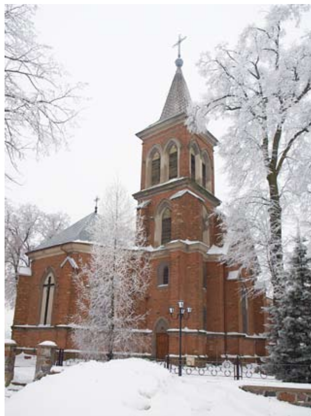
Kościół parafialny w Starej Białej koło Płocka

W folklorze i ikonografii chrześcijańskiej Matka Boska Gromniczna przedstawiana jest jako niewiasta z płonącą świecą w dłoni, osłaniająca przed stadem wilków wieś zasypaną śniegiem lub ludzi brnących pośród zamieci. Znane jest na północnym Mazowszu przysłowie: Gromniczna zawsze bruni od wilka . Staropolska