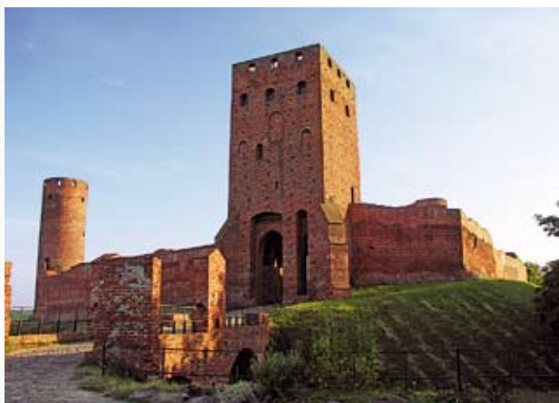
Zamek książąt mazowieckich w Czersku

Bolesław Kędzierzawy nie cieszył się władzą zbyt długo. Szybko przejmuje ją najmłodszy (trudno, żeby był jeszcze młodszy – był tzw. pogrobowcem, czyli urodził się po śmierci ojca) brat, Kazimierz Sprawiedliwy. Ten skromny pan na Wiślicy zdobywa później władzę w Małopolsce i właśnie na Mazowszu, stając się jednym z najważniejszych władców Piastowskich. Po Kazimierzu Sprawiedliwym dzielnicę mazowiecką i kujawską objął młodszy z jego synów, Konrad Mazowiecki. Ten władca kojarzy nam się najczęściej z „czarną legendą”, czyli ze sprowadzeniem Krzyżaków do Polski (1226 r.). Spójrzmy jednak na ten fakt oczami ówczesnego Mazowszanina. Polski jako jedności państwowej wówczas nie było, a konkurencyjny dla księcia mazowieckiego ośrodek władzy znajdował się na Śląsku