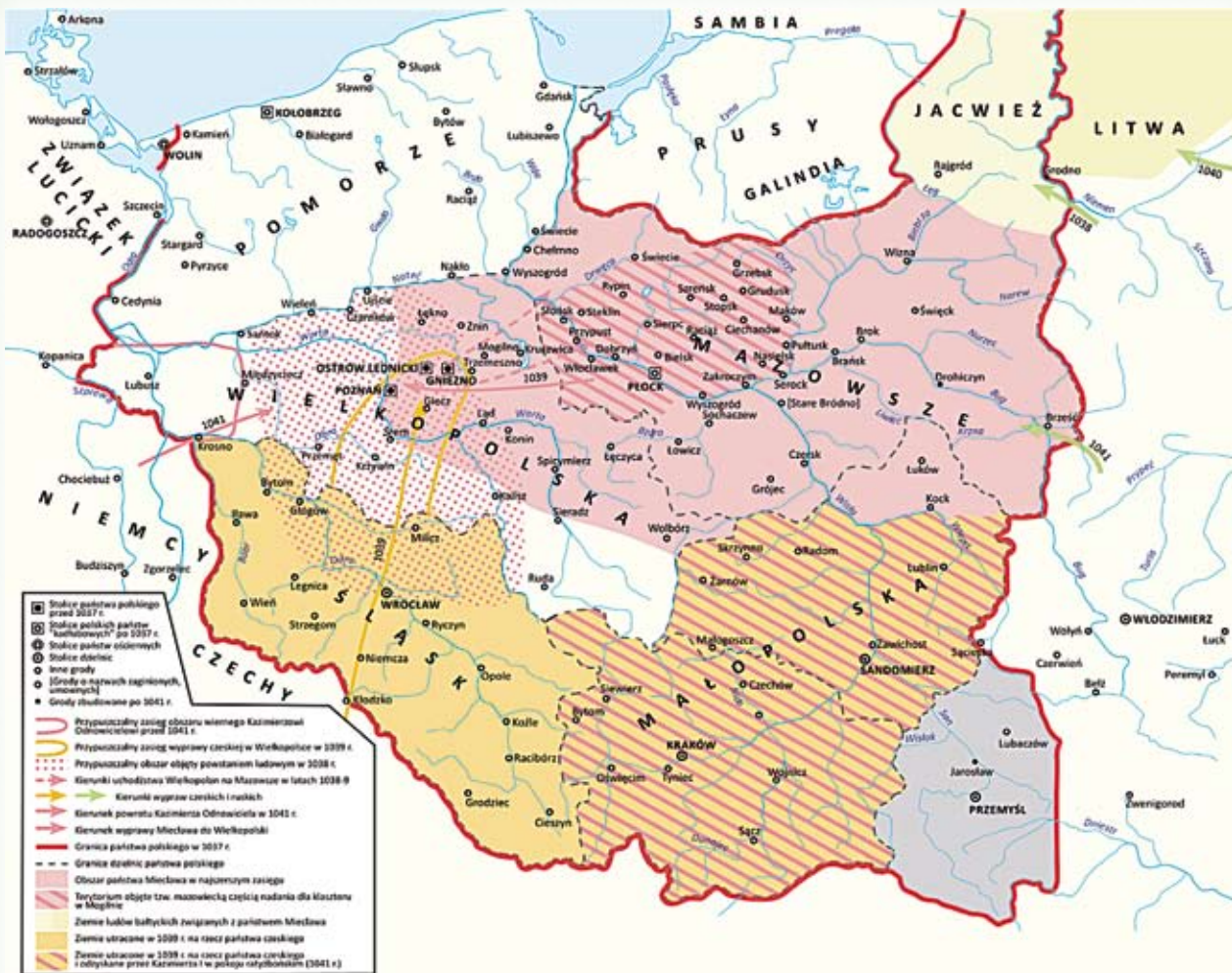
Mazowsze za czasów Masława, XI wiek

w Jazdowie w roku 1262). Wydawać się może zatem naturalna niechęć do Litwinów, którzy z kolei pustoszyli Mazowsze (pod nieobecność Prusów) wraz z Jadźwingami. Ci ostatni docierali nawet w okolice Ciechanowa. Po śmierci Ziemowita następowaly kolejne podziały Mazowsza, tak że w pewnym okresie istniały trzy odrębne Księstwa: Rawskie, Płockie i Warszawskie.