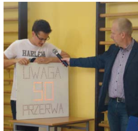
Trzecia z propozycji innowacyjnych rozwiązań