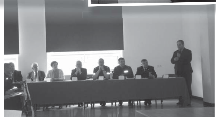
Przebieg trzeciej debaty nt. bezpieczeństwa