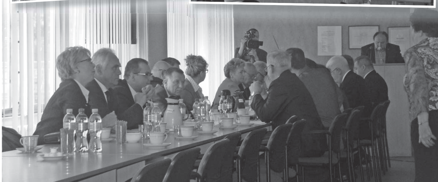
Przebieg obrad Rady Powiatu Ciechanowskiego