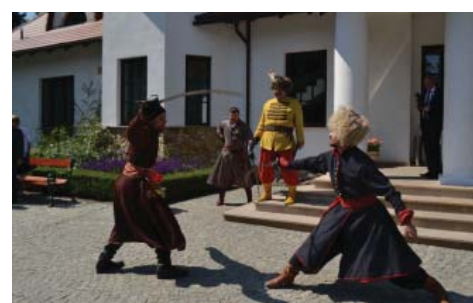
Wojewódzkie obchody święta ludowego w Opinogórze