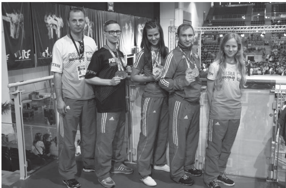
Zwycięska drużyna z Ciechanowa