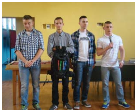
Zwycięski zespół prezentuje kolegom swój projekt