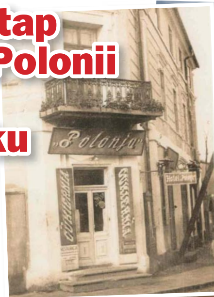
Przypomnijmy historyczny już widok hotelu Polonia oraz remontowany obiekt. Przywrócony zostanie balkon nad wejściem do budynku