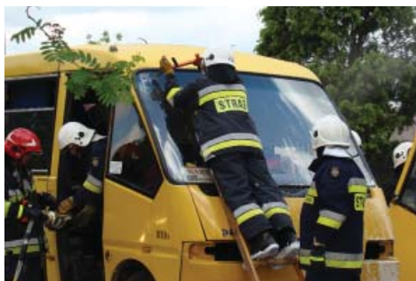
Ćwiczenia „Łydynia 2015”