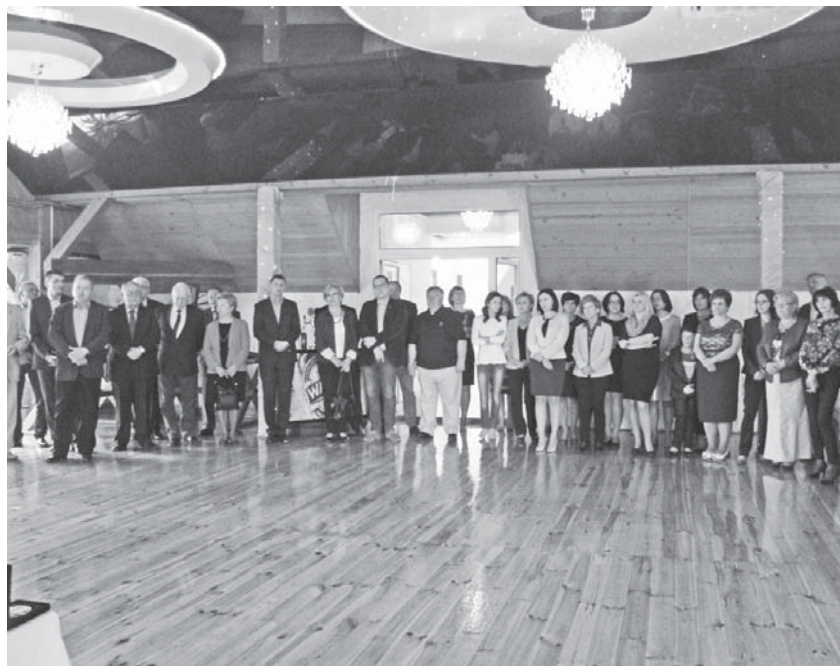
Podczas uroczystego spotkania podsumowano 16 lat pracy samorządu powiatowego