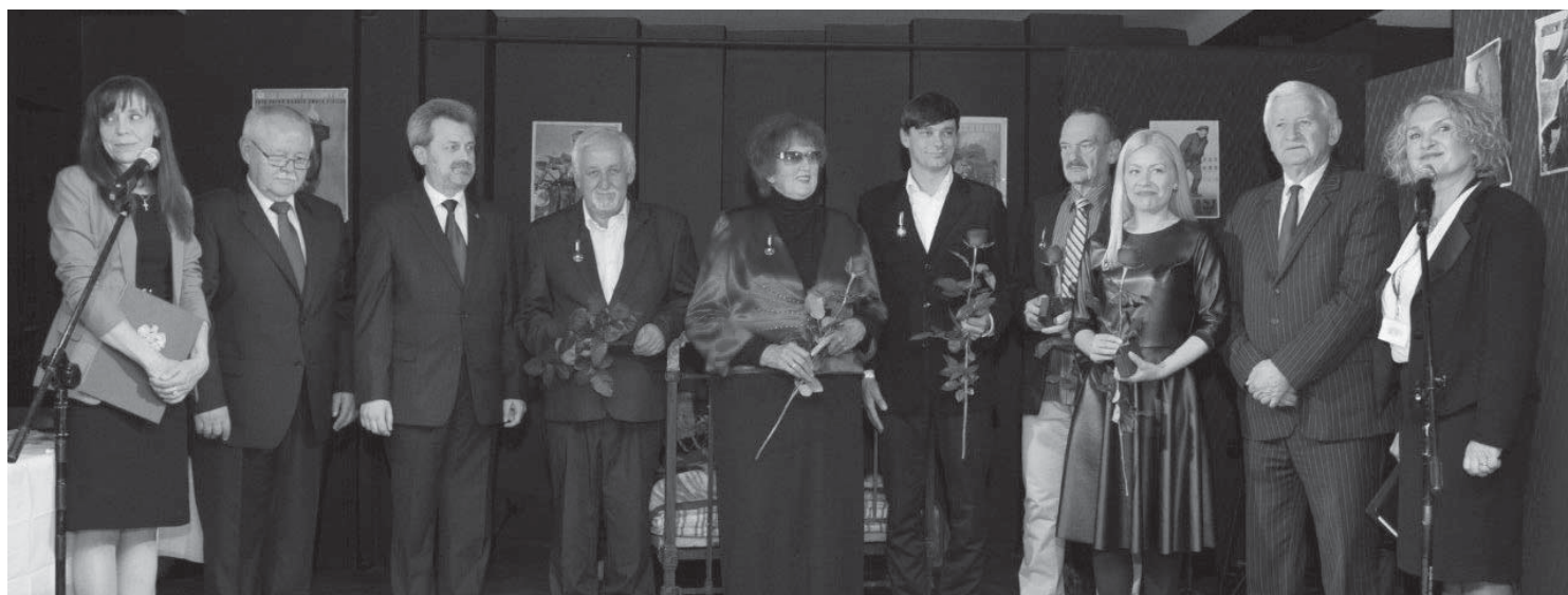
Nagrodzeni w tym roku działacze kultury w otoczeniu posła, władz powiatowych i wojewódzkich