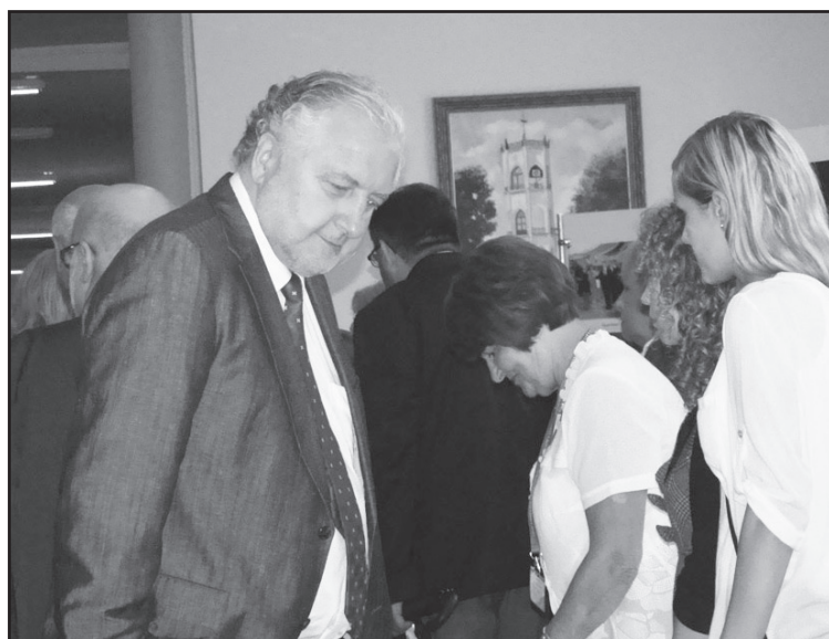
Wśród absolwentów zauważyliśmy prezesa Trybunału Konstytucyjnego prof. A. Rzeplińskiego