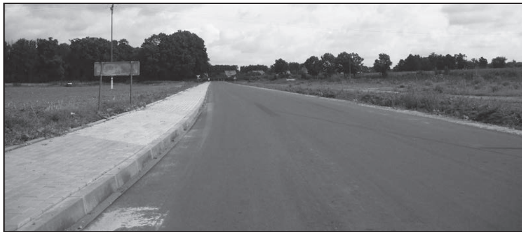
Jedna z dróg powiatowych Wróblewo-Pałuki, wykonana przy wsparciu środków unijnych