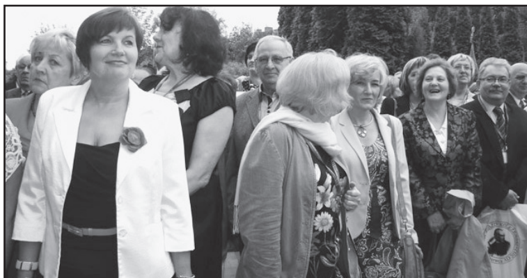
Rozmowy, radość, wspomnienia, to charakterystyczny element spotkań absolwentów „Krasiniaka”