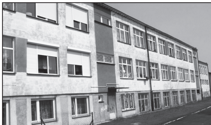
SOSzW wymaga rozbudowy i modernizacji