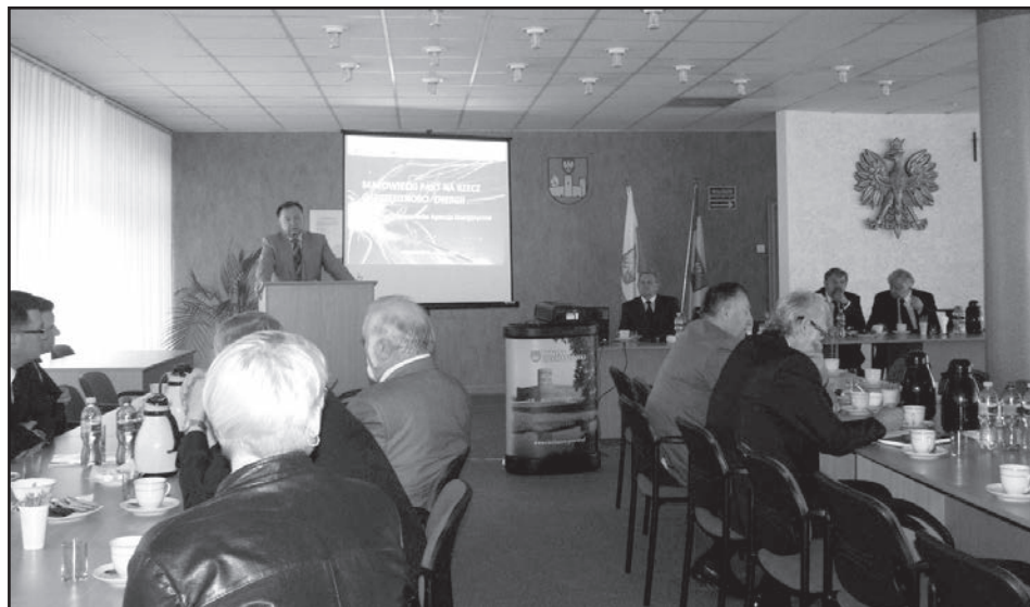
Spotkanie zgromadziło przedstawicieli samorządów z całego regionu ciechanowskiego