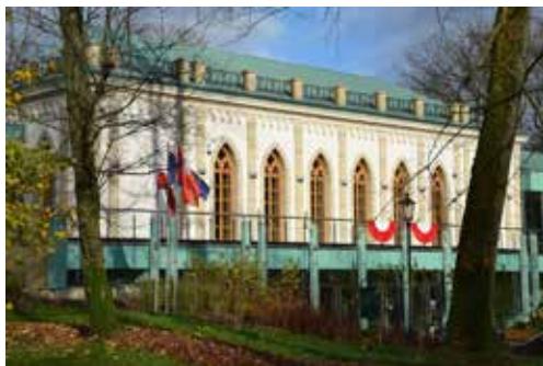
Oranżeria Muzeum Romantyzmu w Opinogórze

doposażone zostały także inne oddziały: laryngologiczny, dziecięcy, chirurgii dziecięcej oraz zakład bakteriologii. Modernizację przechodzą również oddziały onkologiczno-hematologiczny oraz obszeracyjno-zakaźny. Wartość wszystkich inwestycji to blisko 20 mln złotych. 29 grudnia 2017 r. – Muzeum Romantyzmu w Opinogórze otrzymało kolejne pieniądze na ochronę obiektów zabytkowych. Projekt zakłada remont podziemi kościoła opinogórskiego pw. Wniebowzięcia Najświętszej Marii Panny oraz konserwację wybranych zabytkowych nagrobków na cmentarzu parafii rzymskokatolickiej pw. św. Zygmunta w Opinogórze. Podziemia kościoła zostaną odwodnione, a tynki, posadzki, okna, drzwi i schody poddane renowacji. Dodatkowo płyty upamiętniające ród Krasieńskich przejdą konserwację lub zostaną wymienione. Na nagrobku Zygmunta Krasieńskiego zostanie wykuty jego wizerunek.