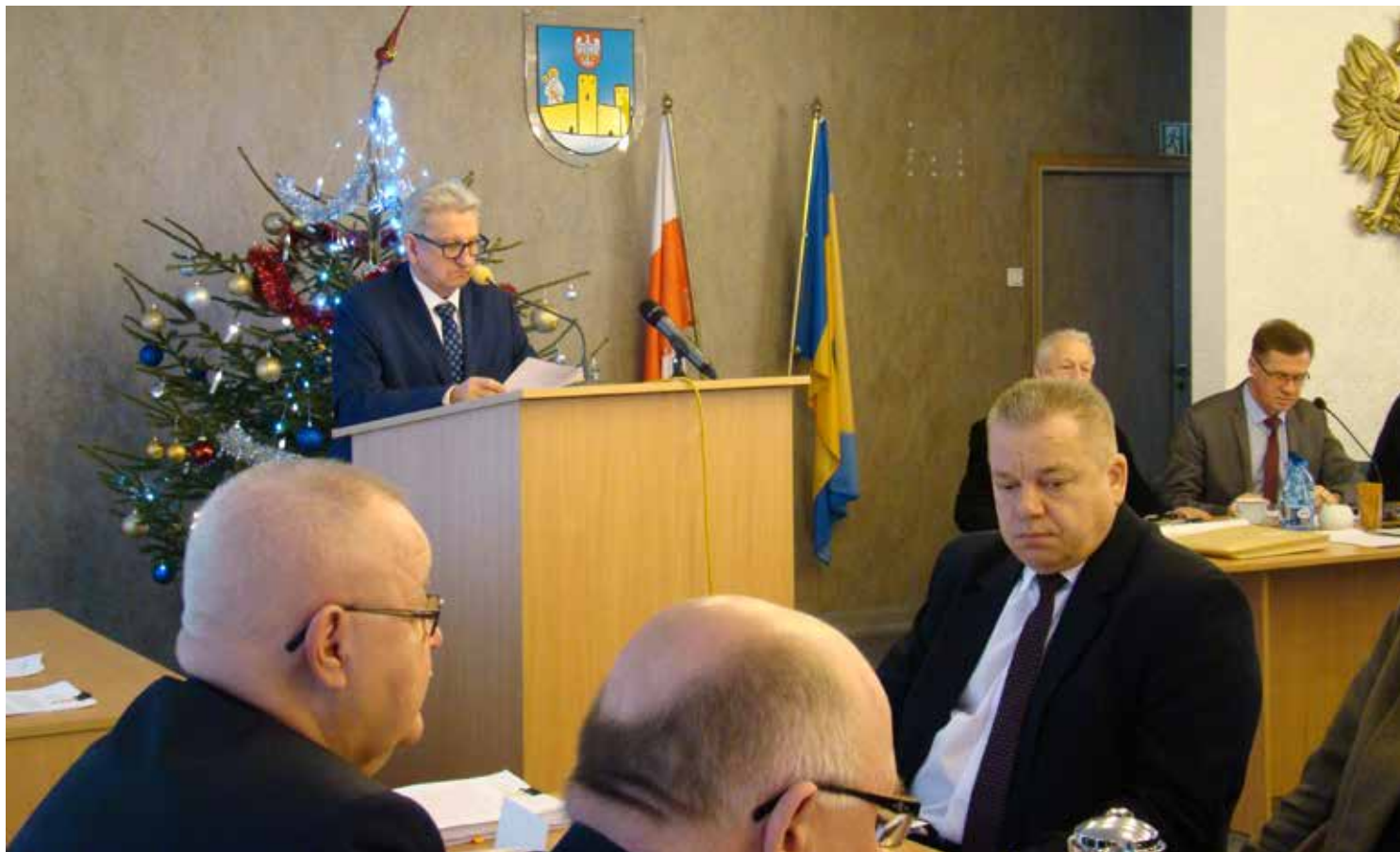
Jedna z najważniejszych sesji w roku - tzw. budżetowa - odbywała się w świątecznej atmosferze