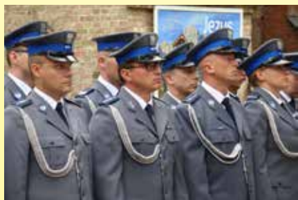
Policjantki i policjanci otrzymali wyróżnienia i awanse zawodowe

Świętowanie „Dnia Policji Państwowej” w Ciechanowie rozpoczęło się w piątek 21 lipca i potrwało do soboty 22 lipca. W tych dniach odbyła się uroczysta akademicka i piknik dla mieszkańców miasta. Święto Policji było okazją do złożenia kwiatów pod tablicami i pomnikami poświęconymi pamięci poległych na służbie oraz do wręczenia odznaczeń i awansów na wyższe stanowiska służbowe. Oprócz odznaczeń państwowych i resortowych były to także odznaczenia i wyróżnienia, m.in.: Krzyże Zasługi za Dzielność, Medale za Długoletnią Służbę, Medale za Zasługi dla Policji, Odznaki Zasłużonego Policjanta oraz nagrody rzeczowe i finansowe dla poszczególnych funkcjonariuszy.