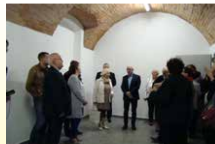
Zwiedzanie pomieszczeń budynku po remoncie