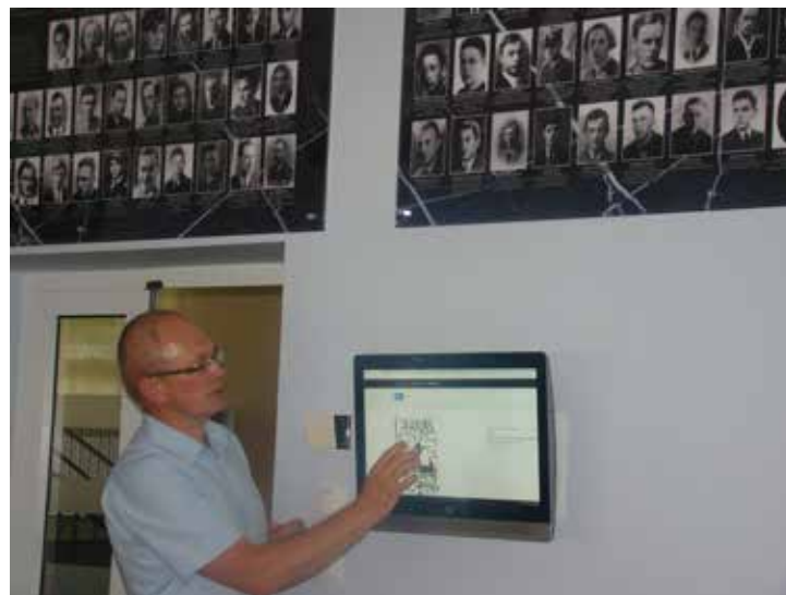
Pracownia multimedialna w I LO w Ciechanowie pozwala na ciekawą prezentację historii szkoły