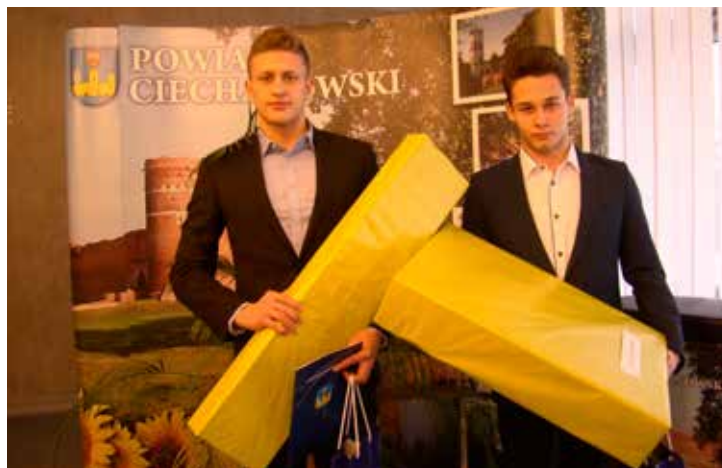
Ciechanowscy pływacy z otrzymanymi nagrodami