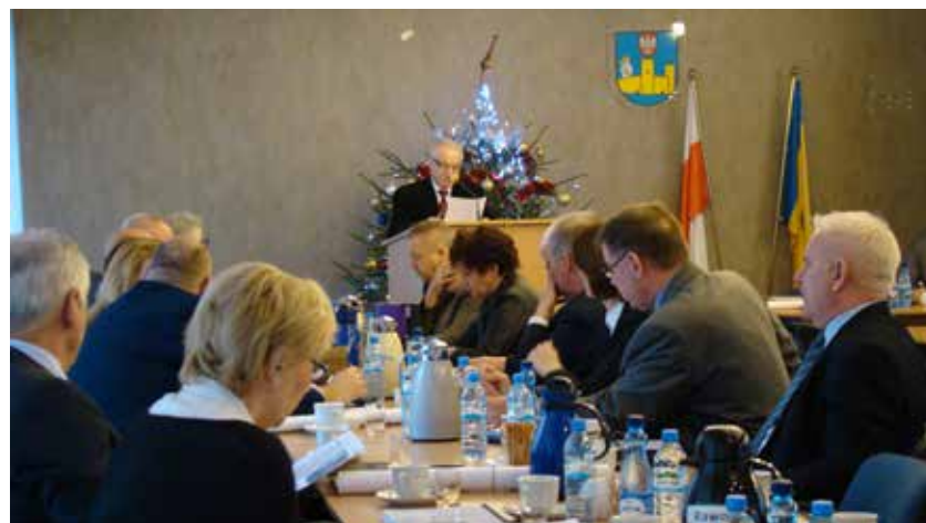
Radni podczas sesji zdecydowali, że najwięcej pieniędzy samorząd przeznaczy na wykonanie inwestycji drogowych