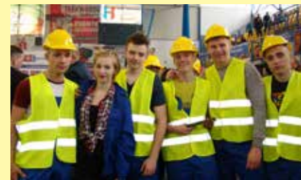
Uczniowie promowali swoje szkoły, w których się uczą