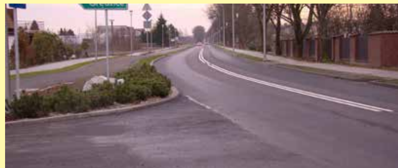
Fragment ulicy Sońskiej po remoncie

Ulica Sońska w Ciechanowie została oddana do użytku! Tuż przed okresem świątecznym udało się zakończyć prace modernizacyjne tej drogi. Arteria jest szeroka, ma nową nawierzchnię, ścieżkę rowerową i nową zieleń. Inwestycję, choć z dużym poślizgiem udało się zakończyć. Prace wykonała firma z Mińska Mazowieckiego. Całkowity koszt inwestycji wyniósł 7 262 221,81 zł. Red.