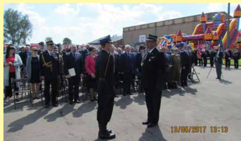
Uroczysty apel z okazji Dnia Strażaka w Głinojecku

Powiat ciechanowski przebuduje dwie drogi z udziałem środków unijnych. Podpisanie dwóch umów dotyczących realizacji projektów w ramach Regionalnego Programu Operacyjnego Województwa Mazowieckiego 2014-2020 odbyło się 13 czerwca 2017 r. w Starostwie Powiatowym w Ciechanowie. Umowy dotyczyły przebudowy dwóch dróg powiatowych: Ciechanów – Młock i Pniewo-Czeruchy – do granicy po-