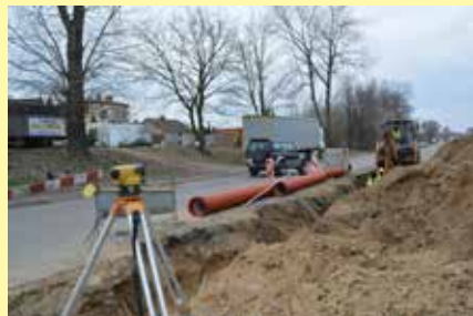
Ulica Sońska w trakcie przebudowy ⇨

Wykonawca robót – Przedsiębiorstwo Budowy Dróg i Mostów z Mińska Mazowieckiego przejął plac budowy związany z przebudową ulicy Sońskiej w Cie-