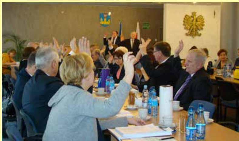
Radni uchwałę przyjęli jednogłośnie

Rada Powiatu Ciechanowskiego, podczas sesji 30 stycznia 2017 r. przyjęła Plan inwestycyjny dla subregionu ciechanowskiego objętego Obszarem Strategicznej Interwencji w ramach Regionalnych Inwestycji Terytorialnych . Dokument został sporządzony w Ciechanowie przez gminę miejską – lidera działań w subregionie ciechanowskim przy współpracy Starostwa Powiatowego w Ciechanowie. Samorząd powiatowy w ramach Planu wyremontuje 2 drogi powiatowe: Ciechanów-Młock i Pniewo-Czeruchy – granica powiatu. Dodatkowo Powiatowy Zarząd Dróg w 2017 roku zrealizuje 7 zadań inwestycyjnych w tym pięć związanych z przebudową dróg i dwa opracowania dokumentacji technicznej pod przyszłe inwestycje. Wielkość wydatków inwestycyjnych wyniesie ponad 10 mln zł. Łączny zakres prac inwestycyjnych obejmie: przebudowę 8,4 km dróg powiatowych, budowę 5,08 km chodników, 1,9 km ścieżki rowerowej, ok. 2,5 km kanalizacji deszczowej.