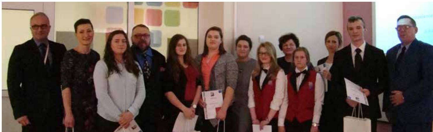
Zwycięzcy konkursów z organizatorami i gośćmi