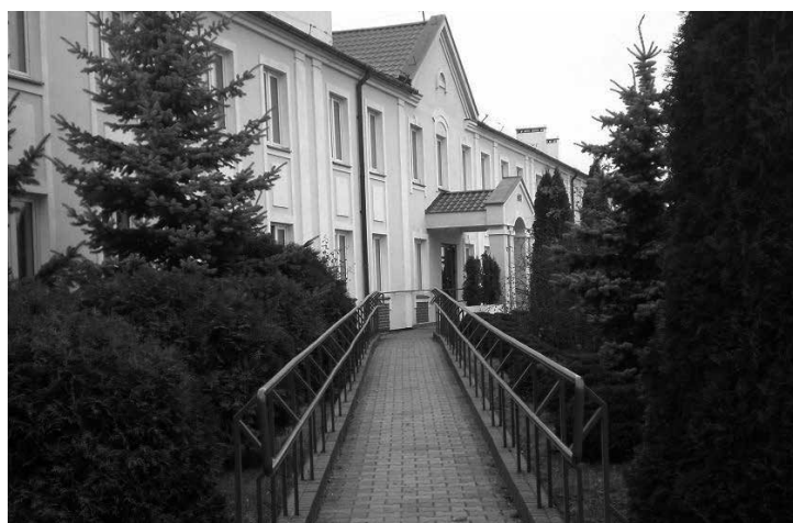
Dom Pomocy Społecznej przy ul. Kruczej w Ciechanowie