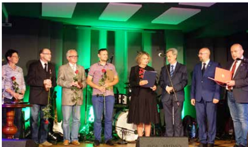
Z okazji święta ludzi kultury wręczone zostały medale i odznaczenia