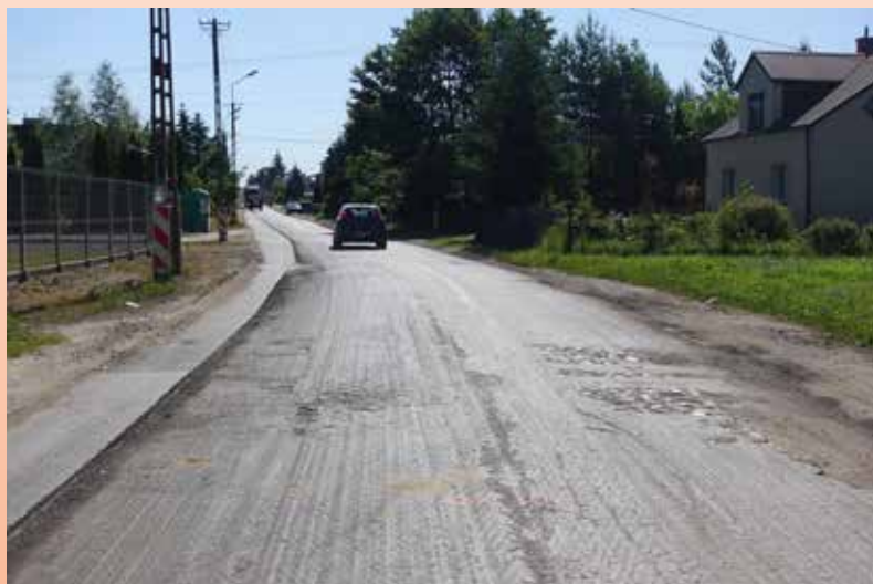
Asfalt w ulicy został już zdjęty