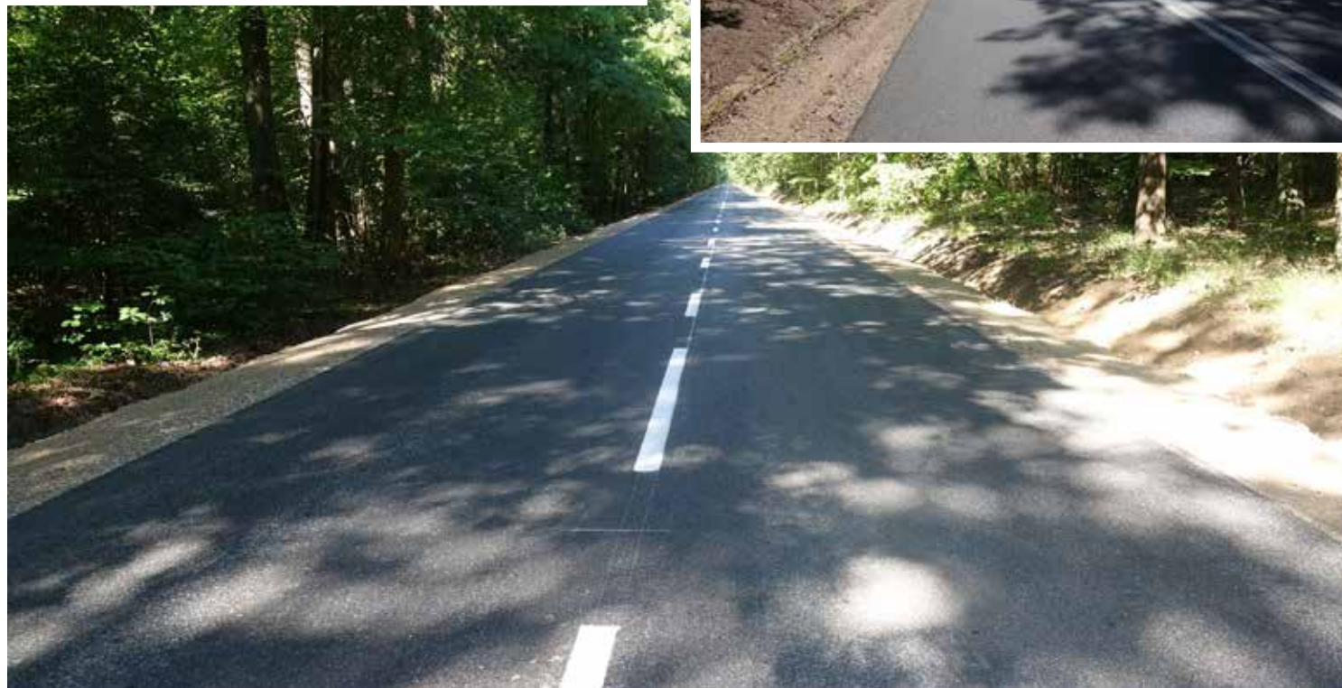
Przebudowana droga w kierunku Strzegowa