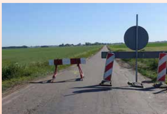
Most na rzece Sonie jest zamknięty, ale można do niego dojechać z obu stron

Obecna nawierzchnia drogi jest bardzo zniszczona, a jezdnia bardzo wąska