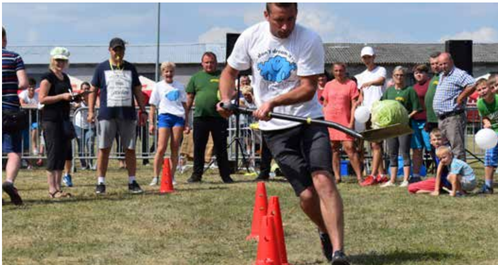
Na ten dzień przygotowano dla mieszkańców całej gminy wiele atrakcji, m.in. turniej sołectw