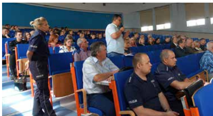
Każdy z uczestników miał możliwość zgłoszenia własnych spostrzeżeń, uwag czy wniosków dotyczących bezpieczeństwa