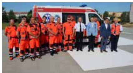
Nowa karetka dla ciechanowskiego szpitala.

28 maja – Zakład Pomocy Doraźnej Szpitala Wojewódzkiego w Ciechanowie otrzymał nową karetkę. Ambulans wyposażony jest w najnowocześniejszy sprzęt do ratowania zdrowia i życia mieszkańców naszego regionu. Będzie przede wszystkim obsługiwał transport medyczny pacjentów z ciechanowskiego szpitala do ośrodków medycznych o wyższej referencyjności, ale też będzie stanowił samochód rezerwowy floty trzech karettek funkcjonujących w ramach Zespołów Ratownictwa Medycznego. Pojazd kosztował ok. 470 tysięcy złotych i został kupiony ze środków własnych ciechanowskiego szpitala.