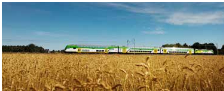
Pociąg cieszy się dużym powodzeniem i można nim dojechać z Ciechanowa na Wybrzeże