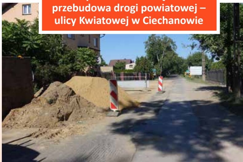
Prace w ulicy Kwiatowej prowadzone są intensywnie

– tyle kosztować będzie przebudowa drogi powiatowej – ulicy Kwiatowej w Ciechanowie