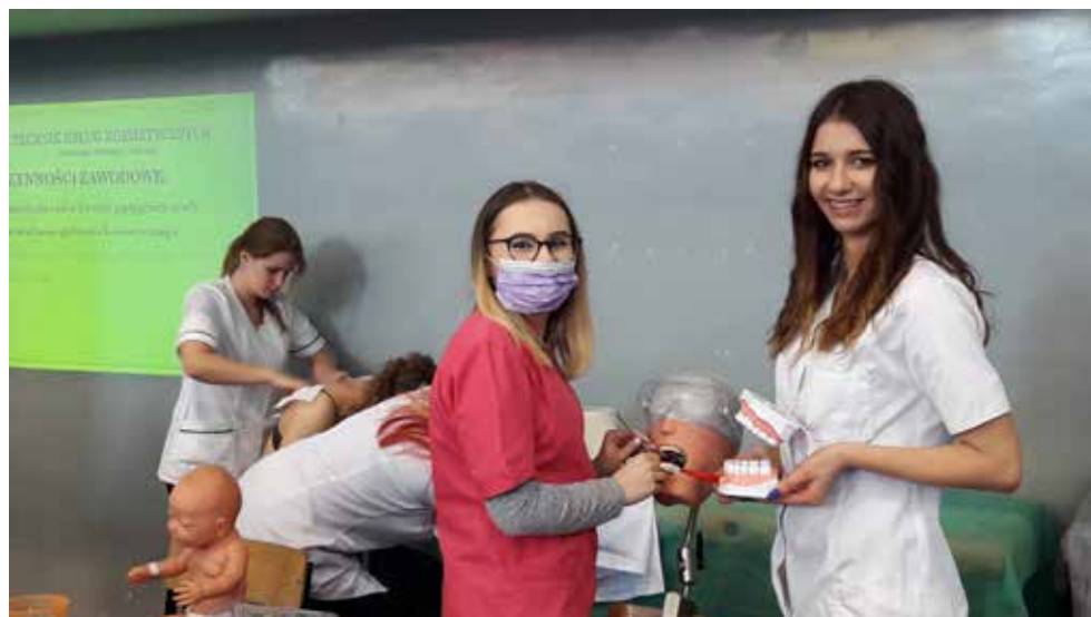
Śluchacze szkoły często uczestniczą w targach edukacyjnych, dniach promocji zdrowia prezentując swoje umiejętności

Kształcenie odbywa się w systemie dziennym, zaocznym i wieczorowym. Taki rodzaj nauki sprzyja osobom, które pracują i jednocześnie chcą uzupełnić wykształcenie i podnieść kwalifikacje.