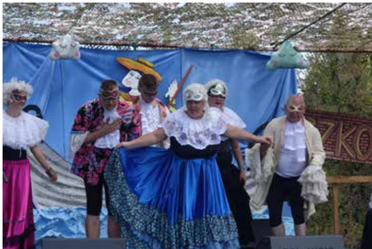
Scenki zaprezentowane przez artystów opowiadały o kulturze i muzyce słonecznej Italii

Przeгляд odbył się po raz szósty. Wzięło w nim udział ponad dwadzieścia drużyn reprezentujących domy pomocy społecznej, ośrodki wsparcia, warsztaty terapii zajęciowej z terenu Mazowsza. Spotkanie otworzyli: starosta ciechanowski Sławomir Mo-