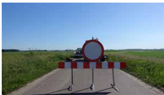
Przebudowa drogi powiatowej staje się faktem. Na placu budowy pracuje już wykonawca robót

Koszt tej inwestycji to 11,5 mln zł. Pozyskane dofinansowanie i wkład województwa mazowieckiego – w ramach „Mazowieckiego instrumentu wsparcia dróg lokalnych o istotnym znaczeniu dla rozwoju społeczno-gospodarczego regionu” – wynosi 4,2 mln zł. Powiat ciechanowski przeznaczył na ten cel 4,450 mln zł, samorząd miasta Ciechanowa wesprze inwestycję kwotą 2,2 mln zł, a gmina Opinogóra Górna 700 tys. zł.