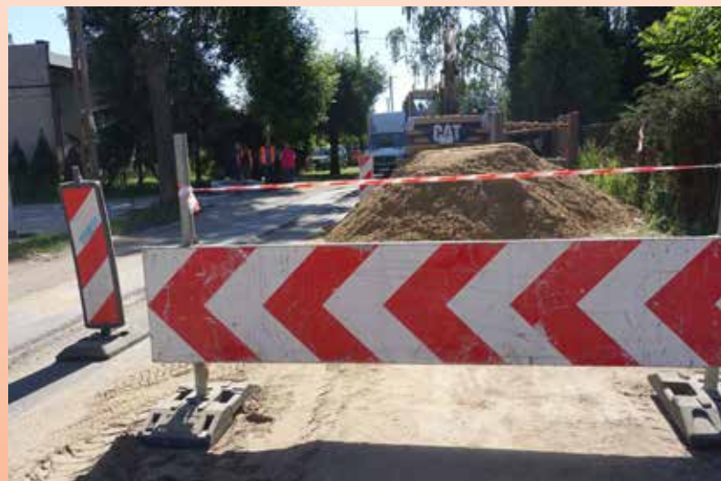
Droga podczas remontu będzie przejezdna dla aut osobowych. Dla samochodów ciężarowych wprowadzono zakaz przejazdu