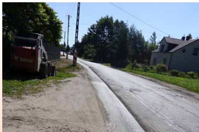
Droga będzie miała pobocza i chodnik

Czternastego czerwca 2018 r. została wprowadzona czasowa organizacja ruchu drogowego. Polega na zakazie wjazdu pojazdów o całkowitej masie powyżej 3,5 t w ulicę Kwiatową w Ciechanowie. Został wyznaczony objazd przez pętlę miejską, ulicę Leśną do miejscowości Rutki Marszewice i dalej do Gorysz. W związku z utrudnieniami związanymi z pracami drogowymi prosimy o wyrozumiałość, a kierowców samochodów osobowych prosimy - w miarę możliwości - o ograniczenie korzystania z ulicy Kwiatowej.