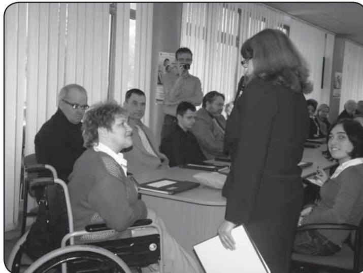
Uczestnicy projektu chętnie się wypowiadali, dzieląc się wrażeniami z jego realizacji