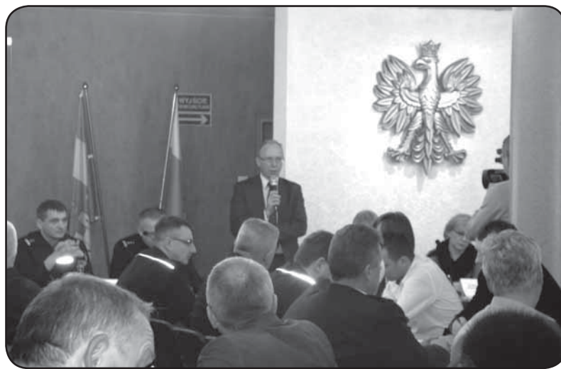
Debata zgromadziła dużą grupę uczestników, jednak brakowało podczas niej mieszkańców miasta i powiatu

korzystających z usług kolei, braku zabezpieczeń na skrzynkach energetycznych przy lampach energetycznych i niebezpieczeństwa porażenia prądem np. dzieci, niebezpiecznego wyjazdu ze Starostwa Powiatowego i częstych wypadków, do których dochodzi w tym miejscu, źle usytuowanego radaru przy ul. 17 Stycznia, braku ścieżek rowerowych (m.in. na odcinku od ulicy Tatarskiej do Pułtuskiej) i zagrożeń dla rowerzystów, rowerzystów porusza-