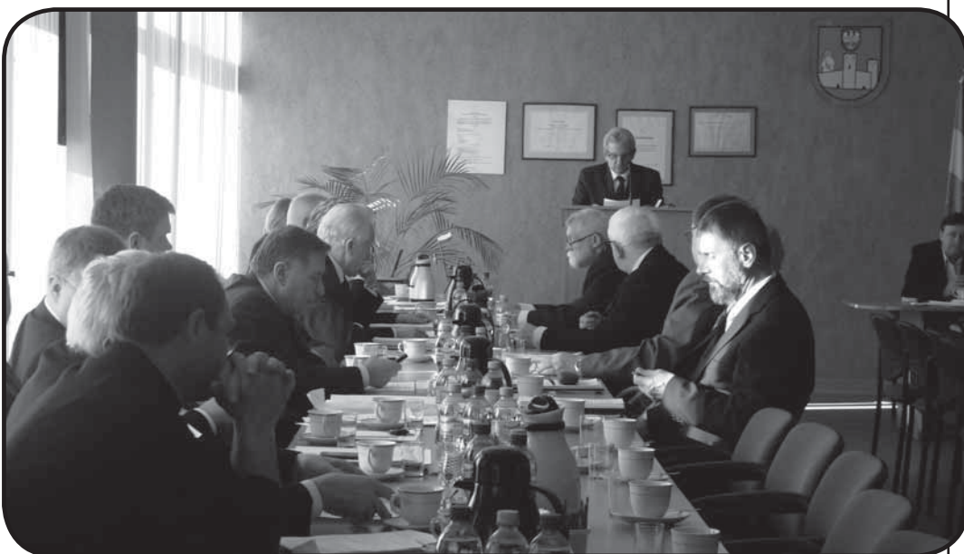
Radni powiatu ciechanowskiego głosują podczas sesji imiennie, czyli każdy z nich wyraża ustnie decyzję o wyniku głosowania

- zmianą uchwały Nr IV/21/151/2013 Rady Powiatu Ciechanowskiego z dnia 25 marca 2013 roku w sprawie określenia zadań z zakresu zatrudnienia i rehabilitacji zawodowej oraz społecznej osób niepełnosprawnych i wysokości środków Państwowego Funduszu Rehabilitacji Osób Niepełnosprawnych przeznaczonych na