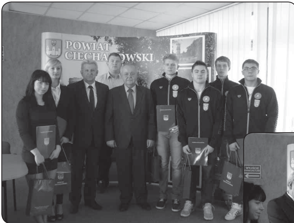
Nagrodzeni sportowcy w otoczeniu władz powiatowych