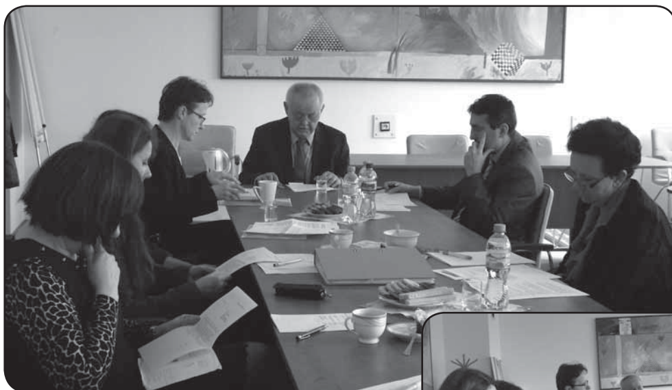
Uczestnicy listopadowego spotkania zespołu koordynującego realizację Powiatowego programu ochrony zdrowia psychicznego 2012 – 2015 dyskutowali o zagadnieniach zdrowia psychicznego mieszkańców powiatu