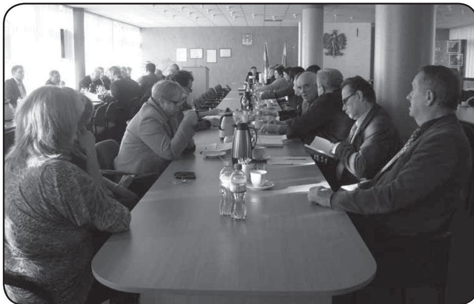
Zaproszeni goście biorący udział w sesji

Powiatowego, przedstawiciele innych samorządów, służb i inspekcji oraz lokalne media.