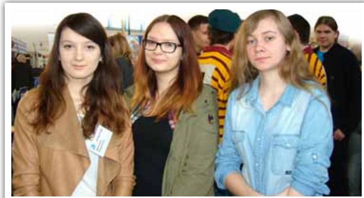
Impreza jest adresowana głównie do młodzieży, przez którą stoi wybór szkoły w kolejnym etapie kształcenia