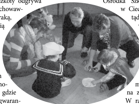
Różne formy nauki i zabawy zapewniają dzieciom niepełnosprawnym wszechstronny rozwój

przyszkolna infrastruktura sportowa tj. wielofunkcyjne boisko szkolne ze sztuczną nawierzchnią wraz z bezpiecznym placem zabaw, zagospodarowane otoczenie wokół obiektów: droga dojazdowa, chodniki, parkingi z podjazdami, modernizacja ogrodzenia. Warto podkreślić, że wszystkie obiekty dostosowane będą do potrzeb osób niepełnosprawnych. Realizacja projektu przewiduje też wyposażenie nowego budynku w meble, montaż zaplecza kuchennego, pracowni fizykoterapii oraz montaż pozostałego wyposażenia.