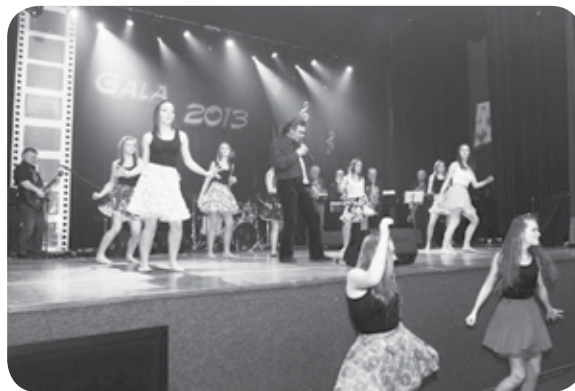
Występ zespołów Funny i Why Ducky podczas Gali Noworocznej 2013

Przypomnijmy, że środki na Fundusz „Sztuka Młodych”, na rzecz uzdolnionej młodzieży z powiatu ciechanowskiego zbierane są corocznie podczas Koncertu Noworocznego „Gala”. W tym roku, w czasie przerwy w koncercie sprzedawane były okolicznościowe cegiełki, które brały udział w losowaniu nagród filmowych, ufundowanych przez Polski Instytut Sztuki Filmowej w Warszawie i Polskie Nagrania w Warszawie. Cegiełki tradycyjnie już sprzedawane były przez ciechanowskich dziennikarzy. Tym razem zbiórkę przeprowadzili redaktorzy z: Tygodnika Ciechanowskiego, Katolickiego Radia Ciechanów, Extra Ciechanów, CiechiTivi i Samorządowca Powiatu Ciechanowskiego. Zebrana kwota była rekordowa - 5.034,56 zł.