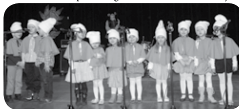
Ciekawe i profesjonalne występy dzieci i młodzieży zachwyciły widzów piosenki o zdrowiu