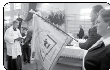
Poświęcenie sztandaru w SP w Gumowie

Wspólna fotografia uczestników uroczystości na tle pomnika Marszałka Józefa Piłsudskiego