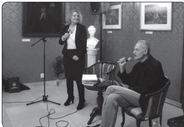
Spotkanie z Eustachym Rylskim przejdzie do historii, jako jedno z najciekawszych spotkań literackich w historii naszego regionu

pięknem tego miejsca i celnymi pytaniami... A dotyczyły one różnych zagadnień: powodów pisania, tematyki Jego książek, akcentów w twórczości związanych z historią rodziny na Wołyniu, a nawet tego – czy lubi pisać? Eustachy Rylski z wrodzoną pewnością siebie oraz rozbijającą szczerością odpowiedział, że nie lubi pisać, męczy go to i nudzi. Jego zdaniem – pisanie z wielu przyjemności życia i tak jest najbardziej fascynujące i ekscytujące. Ale już napisana książka sprawia radość i przyjemność. Dodał też, że pisze z egoizmu i pychy. A zaczął późno, bo już po trzydziestce. Wcześniej miał się różnych zawodów, był nawet budowlanem. Kiedy przeniósł się z Dolnego Śląska do Warszawy zaczął pisać i już nie przestał. Podczas spotkania w Opinogórze zaznaczył wyraźnie, że nie czuje się pisarzem, ale do-