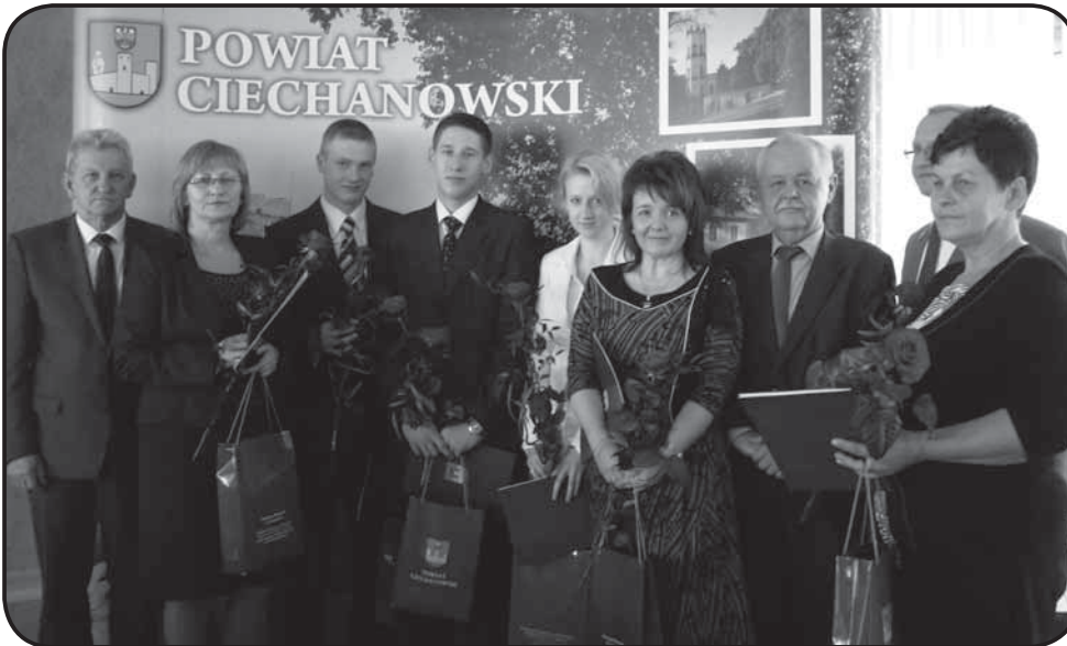
Pamiątkowa fotografia najlepszych maturzystów oraz rodziców i dyrektorów szkół, którzy odebrali gratulacje od władz powiatowych

Sesja rozpoczęła się miłym akcentem, wręczeniem nagród najlepszym maturzystom ze szkół prowadzonych przez powiat ciechanowski oraz laureatom olimpiad.