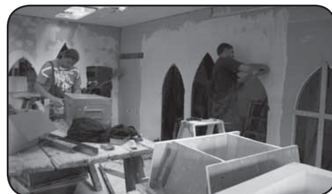
Młodzież z ZST na praktykach w Niemczech