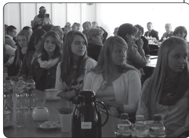
Uczniowie, uczestniczący w projekcie nt. demokracji lokalnej, bacznie obserwowali obrady samorządowców

We wszystkich głosowaniach nad projektami uchwał radni byli zgodni i przyjęli je