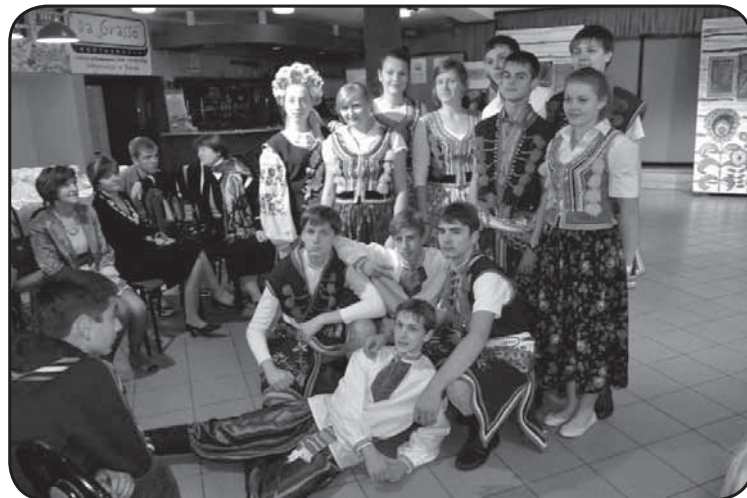
Spotkanie miało ogromne znaczenie dla młodzieży z obu krajów, przybliżyło kulturę państw oraz zbliżyło młodzież