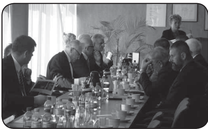
Wrześniowe obrady rajców powiatowych

Dwudziesta szósta sesja Rady Powiatu Ciechanowskiego IV kadencji (pierwsza po letniej przerwie) odbyła się 30 września 2013 roku w sali konferencyjnej budynku Starostwa Powiatowego przy ul. 17 Stycznia 7 w Ciechanowie. Radni wysłuchali sprawozdania Starosty z działalności Zarządu Powiatu w okresie między sesjami, rozpatrzyli informację Zarządu Powiatu Ciechanowskiego o realizacji zadań oświatowych powiatu ciechanowskiego w roku szkolnym 2012/2013, w tym o wynikach matur oraz informacji o organizacji szkół i placówek oświatowych na rok szkolny 2013/2014.