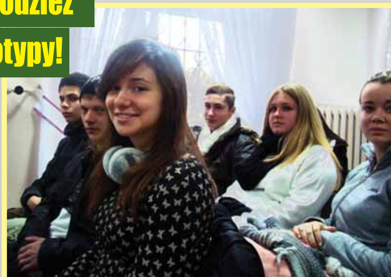
Izraelska młodzież podczas spotkania w ZS nr 2 w Ciechanowie

Mogliśmy się o tym przekonać podczas wizyty młodzieży z Izraela w Zespole Szkół nr 2 w Ciechanowie, która miała miejsce 13 listopada br. Spotkania uczniów z obu krajów w tej szkole stają się powoli tradycją. ZS nr 2 nawiązał współpracę z Yohana Jabotinski School w Beer Yakow (nie wielkie miasteczko na przedmieściach Tel Awiwu) w 2009 roku. Listopadowe spotkanie było piątym z kolei. Uczestniczyły w nim 50 młodych Izraelczyków oraz podobna liczba polskich uczniów.