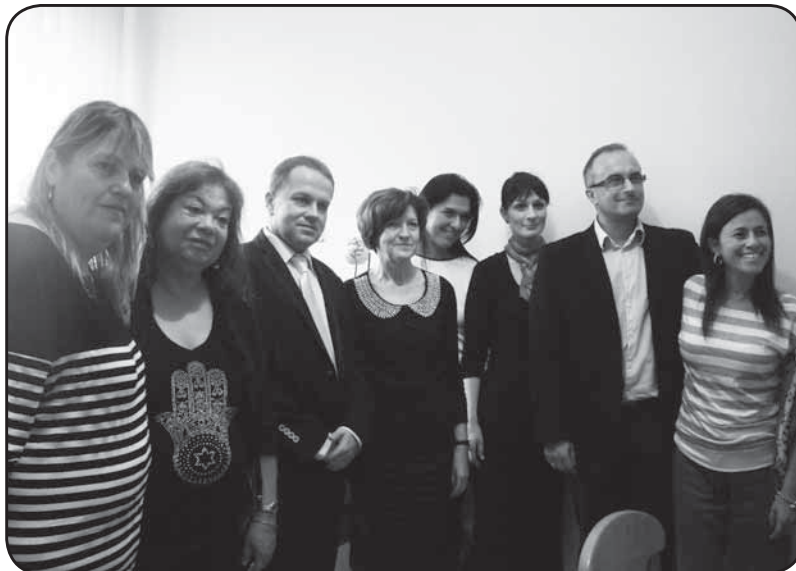
Na wspólnej fotografii prezentują się nauczycielki z Izraela oraz dyrekcja i nauczyciele z ciechanowskiej szkoły

W ubiegłych latach młodzież z zaprzyjaźnionych szkół uczyła się między innymi wspólnie tańczyć poloneza, zwiedzała Ciechanów oraz dwukrotnie odwiedziła pozostałości dawnego obozu koncentracyjnego w Treblince. W tym roku, po uroczystym powitaniu i bardzo ciekawych multimedialnych prezentacjach obydwu szkół i państw, uczniowie uczestniczyli w zajęciach integracyjnych przygotowanych i prowadzonych w języku angielskim i rosyjskim przez młodzież z Ciechanowa. Język rosyjski został wybrany nie bez przyczyny, bowiem młodzi Izraelczycy odwiedzający nasze miasto świetnie się nim posługują. Goście z Beer Yakow najczęściej urodzili się już w Izraelu, ale ich rodzice