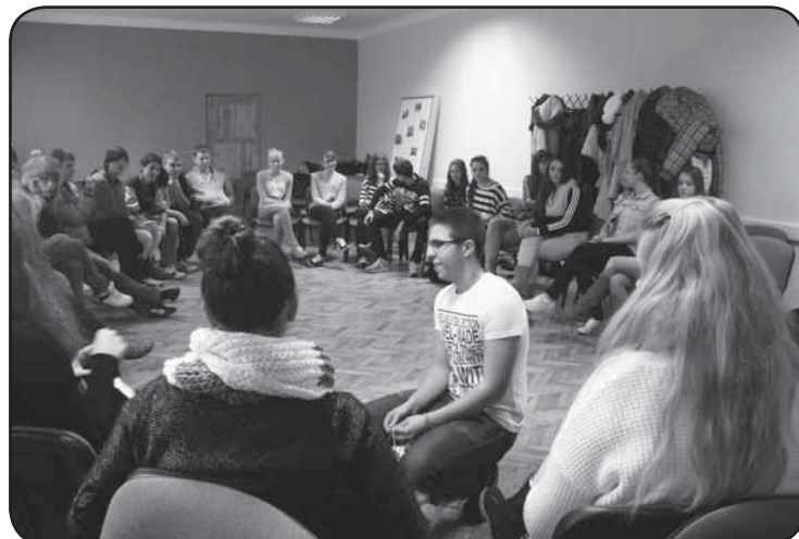
Wspólne zajęcia i prezentacje były nie tylko interesujące, ale również pozwoliły na wzajemne poznanie się młodzieży z różnych kultur