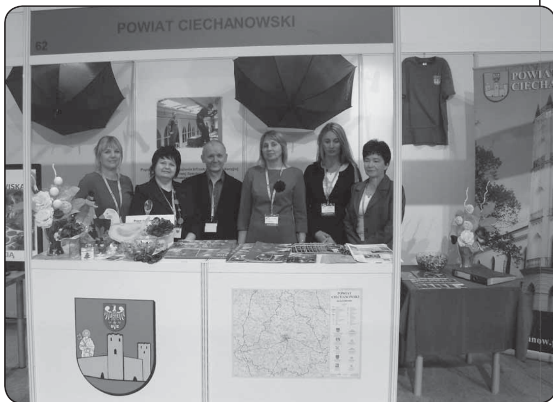
Przedstawiciele powiatu ciechanowskiego na IV Forum Rozwoju Mazowsza

mechanizmy wspierania młodych firm oraz statystyki w zakresie nowo otwartych działalności gospodarczych. Nie zabrakło informacji o instytucjach udzielających bezzwrotnych dotacji oraz pożyczek. Zebrani dowiedzieli się też o planach