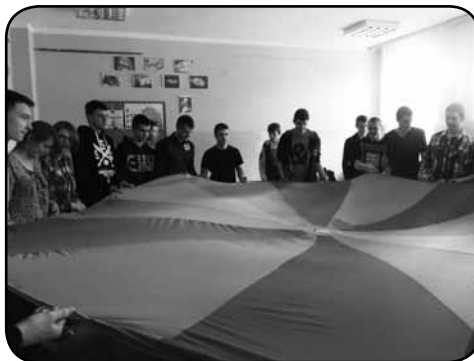
Ciekawe zajęcia zachęciły młodzież do poznawania języka naszego zachodniego sąsiada

Z warsztatów skorzystało 58 uczniów klas pierwszych i drugich technikum. Na początku spotkania uczniowie zaprezentowali, przygotowane pod kierownictwem nauczycielki języka niemieckiego, krótki program artystyczny – scenki rodzajowe i inscenizację do piosenki niemieckiego wykonawcy. Podczas warszta-