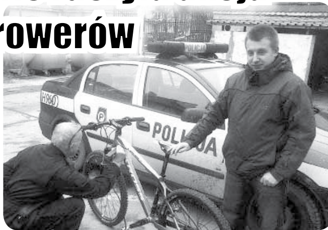
Prosta czynność, polegająca na wybiciu numeru na rowerze, może uchronić w przyszłości nasz rower przed kradzieżą

Mimo, że trwa zima, cykliści przygotowują się do sezonu i pytają o możliwość oznakowania swojego roweru. Właściciel jednego z rowerów skontaktował się z policją i podał numer swojej komórki. Na odpowiedź nie musiał długo czekać, po południu jego rower już został oznakowany.