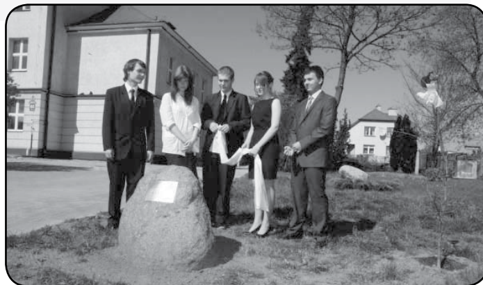
Pożegnanie maturzystów w 2012 roku. Posadzenie dębu maturzystów