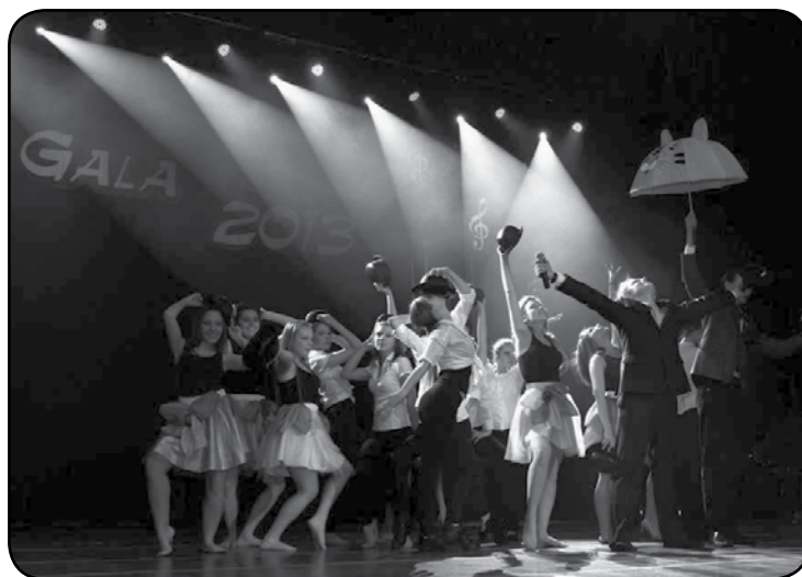
Jeden z występów uzdolnionej młodzieży podczas Gali 2013

Przypomnijmy, iż Fundusz przyznaje stypendia od 23 lat. Środki na ten cel zbierane są podczas Koncertu Noworocznego „Gala”, który każdego roku w styczniu odbywa się w powiatowej jednostce kultury (niegdyś Wojewódzkim Domu Kultury). Tylko w tym roku ciechanowscy dziennikarze na ten cel zebrali 5.034,56 zł.