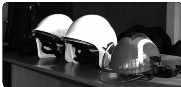
Strażacy mogli obejrzeć nowoczesny sprzęt, który będzie im służył w akcjach