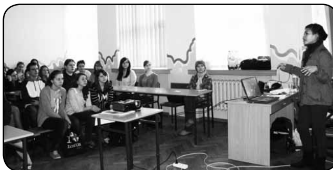
Ciekawie przygotowane zajęcia, z udziałem studentów z egzotycznych krajów cieszyły się dużym zainteresowaniem uczniów „Krasiniaka”