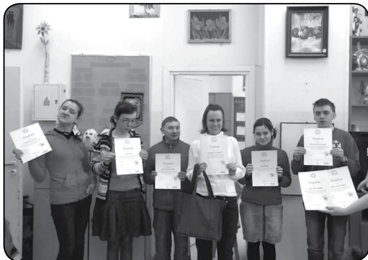
Wyróżnieni uczestnicy WTZ dumnie prezentują dyplomy uznania zdobyte w konkursie