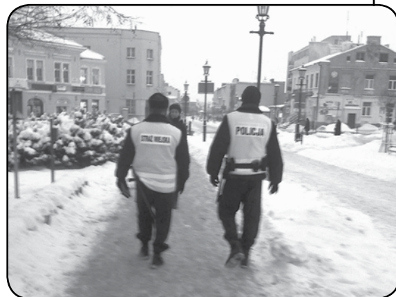
Stróże prawa patrolowali miejsca, gdzie młodzież mogła spędzać wolny czas

którzy przypominali o zasadach bezpiecznego zachowania w czasie aktywnego wypoczynku na świeżym powietrzu. Zbiorniki wodne, tzw. dzikie kąpieliska, często stanowią cel wypraw dzieci i młodzieży również zimą. Rejony wyrobisk, stawy, mokradła kontrolowały patrole połączonych służb policji, straży miejskiej i straży leśnej. Ponadto rodzice i przedstawiciele szkół, którzy chcieli, aby policjanci sprawdzili autobus przed wyjazdem dzieci do miejsc wypoczynku mogli kontaktować się w tej sprawie z Wydziałem Ruchu Drogowego Komendy Powiatowej Policji w Ciechanowie.