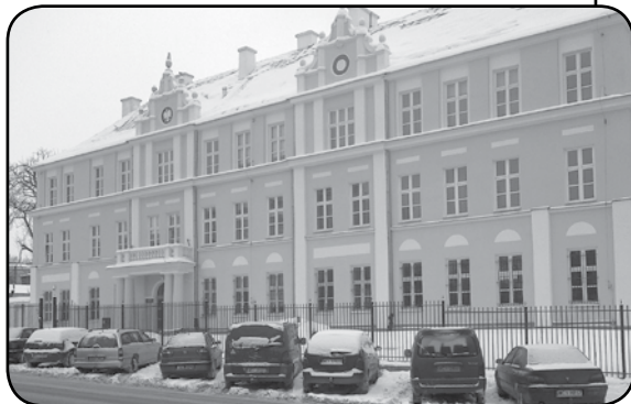
Komenda Powiatowa Policji w Ciechanowie w nowej odsłonie

28 stycznia - Najpiękniejszy budynek w mieście, będący siedzibą Komendy Powiatowej Policji, zmienił swój wygląd. A to za sprawą eleganckiej, nowej elewacji kamienicy przy ul. 11-go Pułku Ułanów Legionowych 25. Od 1999 roku jest to siedziba ciechanowskiej policji. Gdy obiekt nabrał ładnego wyglądu, Komendant Powiatowy Policji w Ciechanowie zdecydował o usunięciu krzewów, rosnących wokół budynku. Zgoda służb konserwatorskich skutkowałą wycięciem kilkudziesięciu tui zakrywających elewację. Budynek nie tylko z zewnątrz wygląda bardzo ładnie. Inwestycje poczynione przez KWP w 2012 roku (wymiana wszystkich drzwi, prace malarskie i konserwatorskie), także przyczyniły się do poprawy wyglądu obiektu. Policjanci mają zapewnione godne warunki pracy, a interesanci są przyjmowani w dobrych warunkach, co też decyduje o postrzeganiu i opiniach obywateli na temat lokalnej policji.