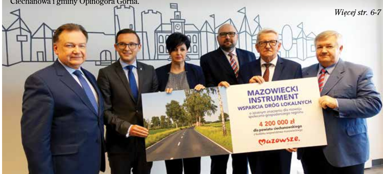
Samorządowcy prezentują symboliczny czek, ilustrujący dofinansowanie do przebudowy drogi