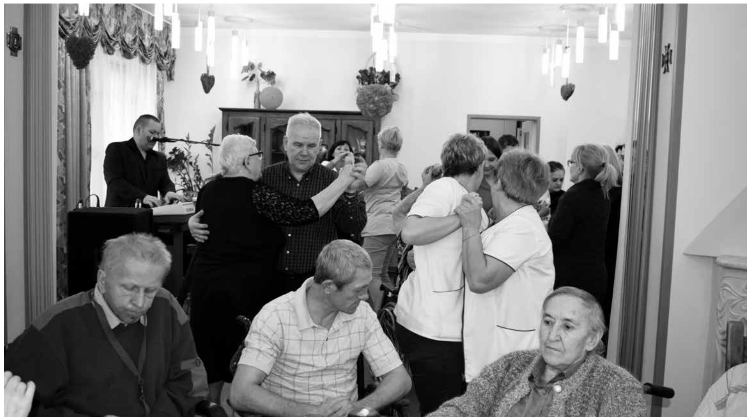
Zabawa walentynkowa w „Kombatancie”