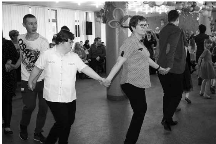
Dobra zabawa trwała kilka godzin, a do tańca nikogo nie trzeba było prosić