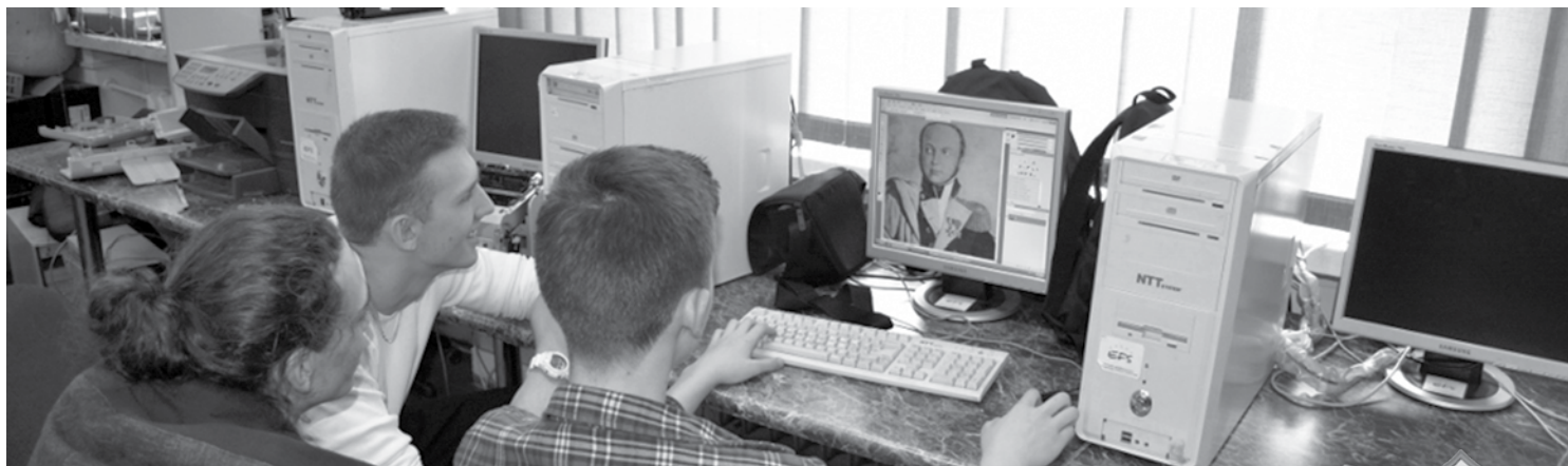
Uczniowie Technikum nr 1 w pracowni informatycznej