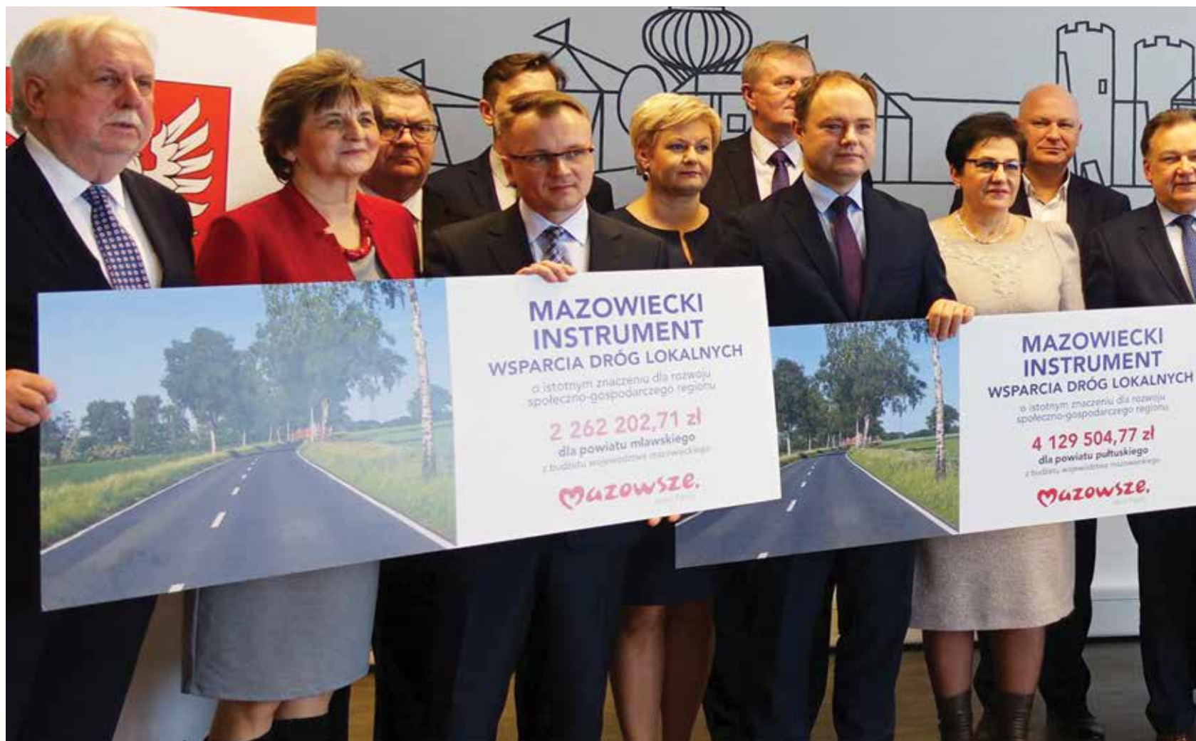
Samorządowcy podczas spotkania w Ciechanowie podpisali umowy na dofinansowanie przebudowy dróg powiatowych