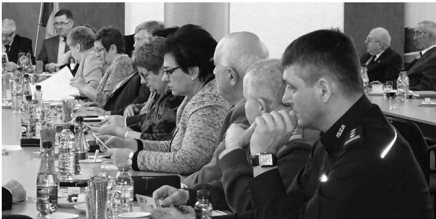
Goście sesji Rady Powiatu