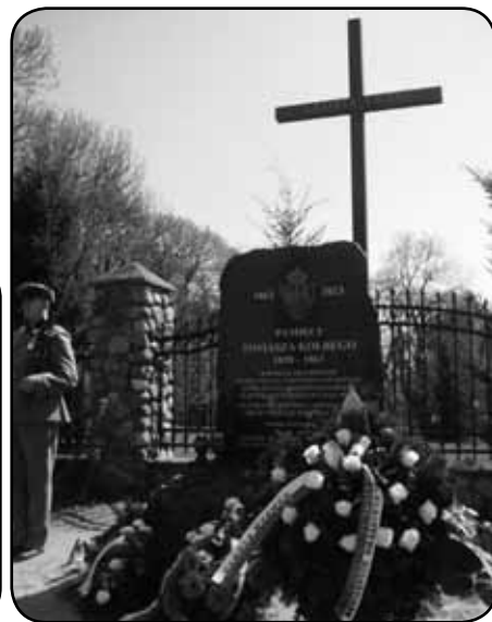
Uroczystość upamiętniająca powstanie styczniowe w Rydzewie