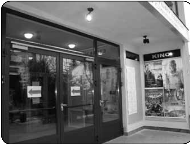
Wejście do powiatowej jednostki kultury po remoncie

Warto przypomnieć, że w ubiegłym roku Centrum Kultury otrzymało z MKiDN 126.000