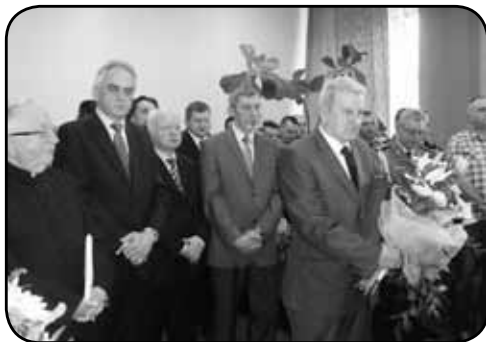
Delegacja samorządowców, księży i pracowników komendy podczas pożegnania komendanta policji