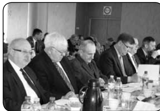
Radni wszystkich klubów Rady Powiatu pozytywnie ocenili wykonanie budżetu.

się kierowania bezrobotnych na staże. Radni 17 głosami, przy dwóch głosach wstrzymujących się, uznali skargę za bezzasadną.