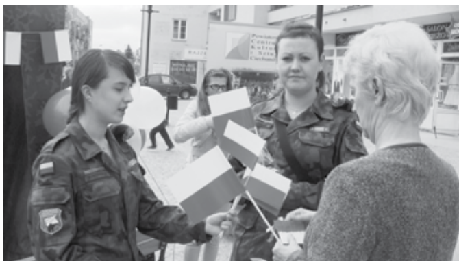
Uczniowie rozdawali mieszkańcom Ciechanowa małe flagi oraz kotyliony, których noszenie w Dniu Flagi stało się już tradycją

2 maja – Obchodziliśmy Dzień Flagi. W Ciechanowie na deptaku wolontariusze (głównie uczniowie) rozdawali przechodniom narodowe flagi. Organizatorami obchodów było: Starostwo Powiatowe w Ciechanowie, Urząd Miasta Ciechanów, Wojskowa Komenda Uzupełnień w Ciechanowie, Miejski Zespół Szkół nr 1 w Ciechanowie oraz Powiatowe Centrum Kultury i Sztuki. W tym dniu z mieszkańcami spotkali się m.in.: starosta ciechanowski Sławomir Morawski, wiceprezydenci Ciechanowa Ewa Gładysz i Cezary Chodkowski, komendant Wojskowej Komendy Uzupełnień ppłk Dariusz Kossakowski. A w Muzeum Szlachty Mazowieckiej przygotowana została specjalna wystawa poświęcona „Biało-czerwonej”.