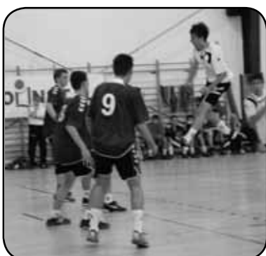
Zawodnicy podczas meczów wykazali się dużą walecznością