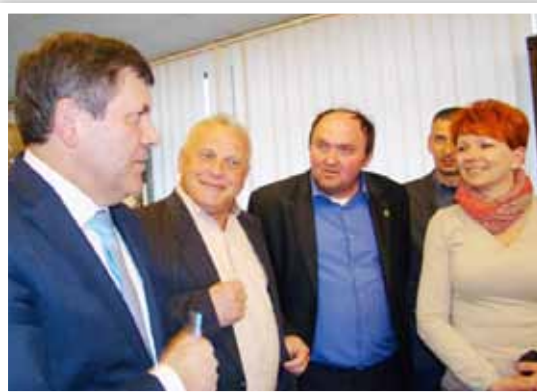
Wicepremier J. Piechociński rozmawia z mieszkańcami regionu ciechanowskiego