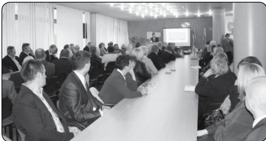
Sala Starostwa Powiatowego podczas spotkania była wypełniona po brzegi

Fotoreportaż ze spotkania prezentujemy na str. 10