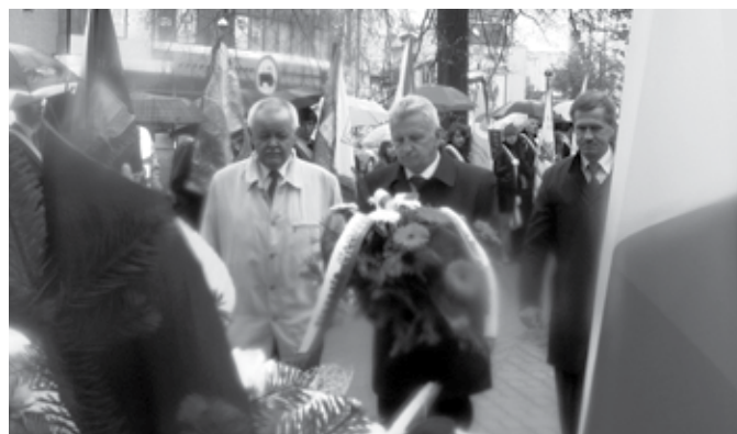
Przemarsz delegacji do kościoła św. Tekli na uroczystą mszę św. Delegacja powiatu ciechanowskiego złożyła kwiaty pod pomnikiem POW

7 maja – Na budynku Miejskiej Biblioteki Publicznej - Oddział Zbiorów Naukowych i Regionalnych przy Pl. Piłsudskiego odsłonięta została tablica pamiątkowa poświęcona Jerzemu Stanisławowi Górskiemu. Uroczystość, zorganizowaną w 80. rocznicę urodzin zasłużonego dla miasta społecznika przygotowały: Towarzystwo Miłośników Ziemi Ciechanowskiej i Ciechanowskie Towarzystwo Naukowe.