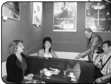
Dziennikarze przy pysznej kawie pytają o szczegóły działalności kawiarenki