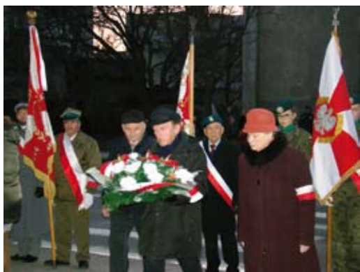
Kwiaty od stowarzyszenia

Wiązanek kwiatów złożyli m.in. przedstawiciele „Sybiraków”.