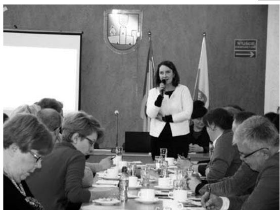
Konferencja nt. praw pacjentów odbyła się w Starostwie Powiatowym w Ciechanowie

Przyjęcia interesantów w Biurze: Poniedziałek - piątek w godzinach od 9.00 do 15.00 Ogólnopolska bezpłatna infolinia Rzecznika Praw Pacjenta: Tel: 800 - 190 - 590 (z tel. stacjonarnych i komórkowych) czynna pn. - pt. w godz. 9.00 - 21.00