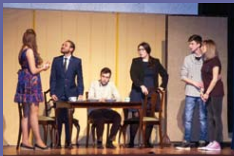
Kolejna premierowa sztuka teatru