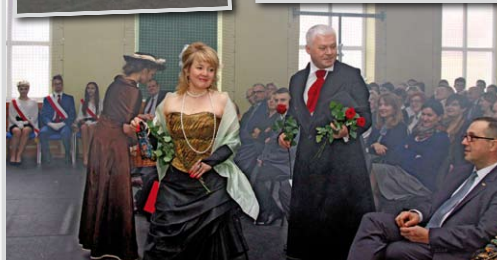
Obchody Dnia Patrona w I LO w Ciechanowie.