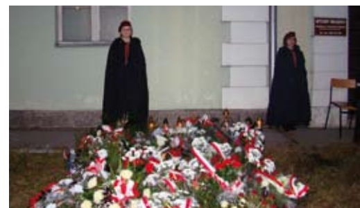
Harcerze pełniący wartę honorową

Tego samego dnia, o godzinie 17.00, delegacje wielu środowisk: kombatanckich, parlamentarnych, samorządowych i szkolnych złożyły kwiaty pod dawną siedzibą Powiatowego Urzędu Bezpieczeństwa Publicznego, przy ul. 11 Pułku Ułanów Legionowych.