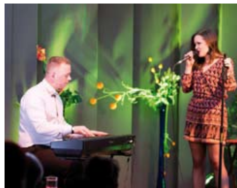
Młoda, zdolna wokalistka zachwyciła wszystkich swoim talentem