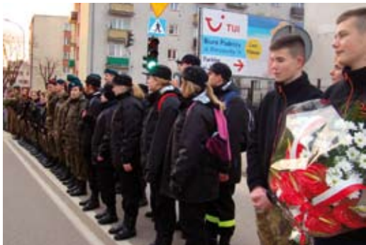
Młodzież podczas uroczystości

W uroczystym apelu uczestniczyła duża grupa harcerzy, uczniów szkół mundurowych i młodzieży szkolnej.