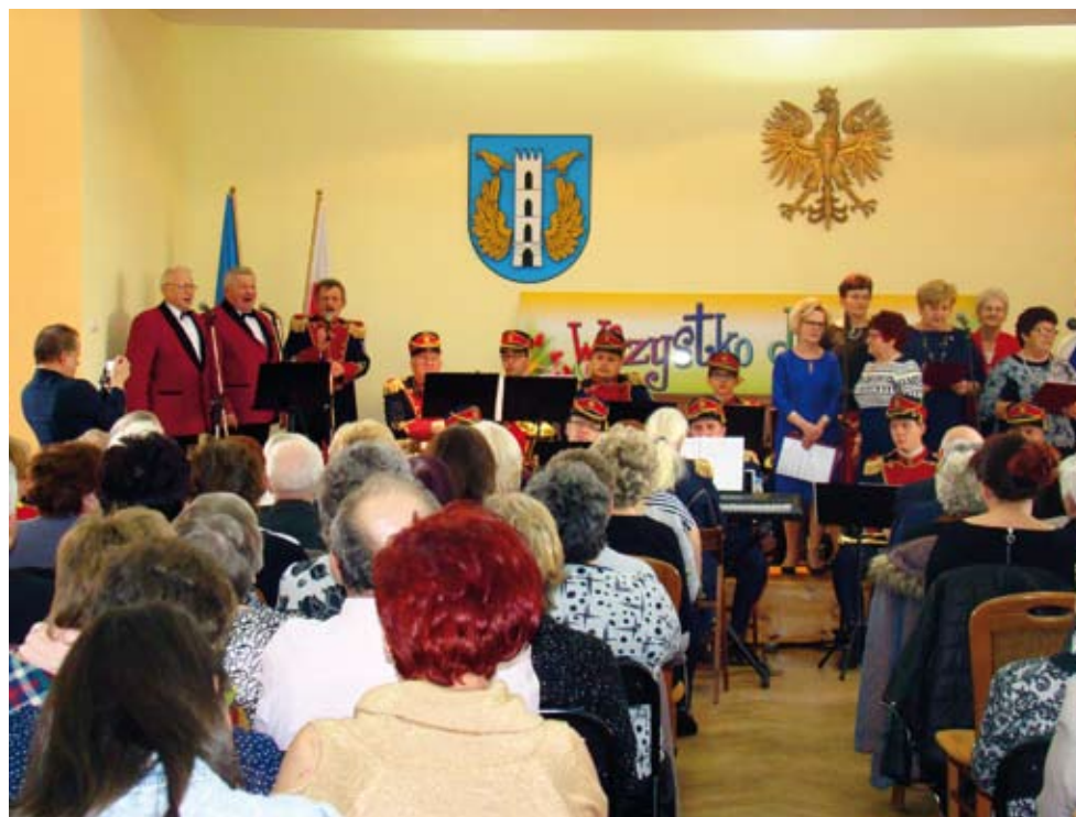
Owacje zebrał wspólny występ zespołów „Melodia” i „Nadzieja”