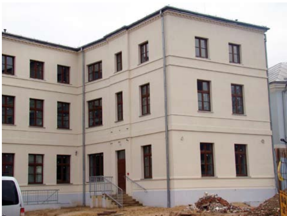
Budynek dawniej Polonii, stan na marca 2017 roku