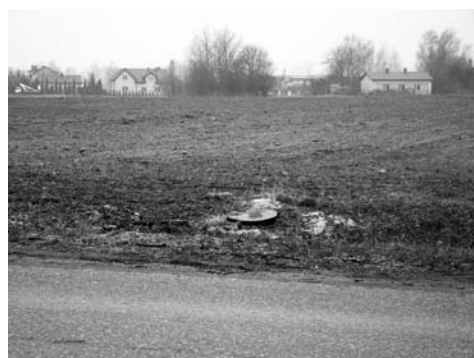
Wstępne prace w ulicy Sońskiej polegają na wycince drzew i przygotowaniu placu pod inwestycję

Szacunkowa wartość inwestycji wyniesie ponad 7 mln zł. Samorząd powiatowy pozyskał na ten cel rządowe dofinansowanie w ramach Programu Rozwoju Gminnej i Powiatowej Infrastruktury Drogowej na lata 2016-2019 w kwocie 3 mln zł.