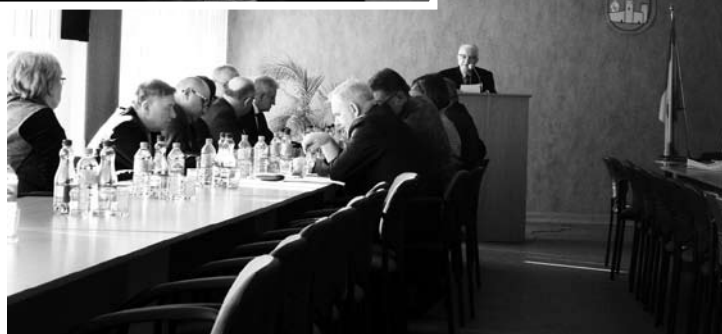
Nadzwyczajna sesja Rady Powiatu, choć krótka, przyniosła ważne decyzje związane z realizacją powiatowych inwestycji drogowych