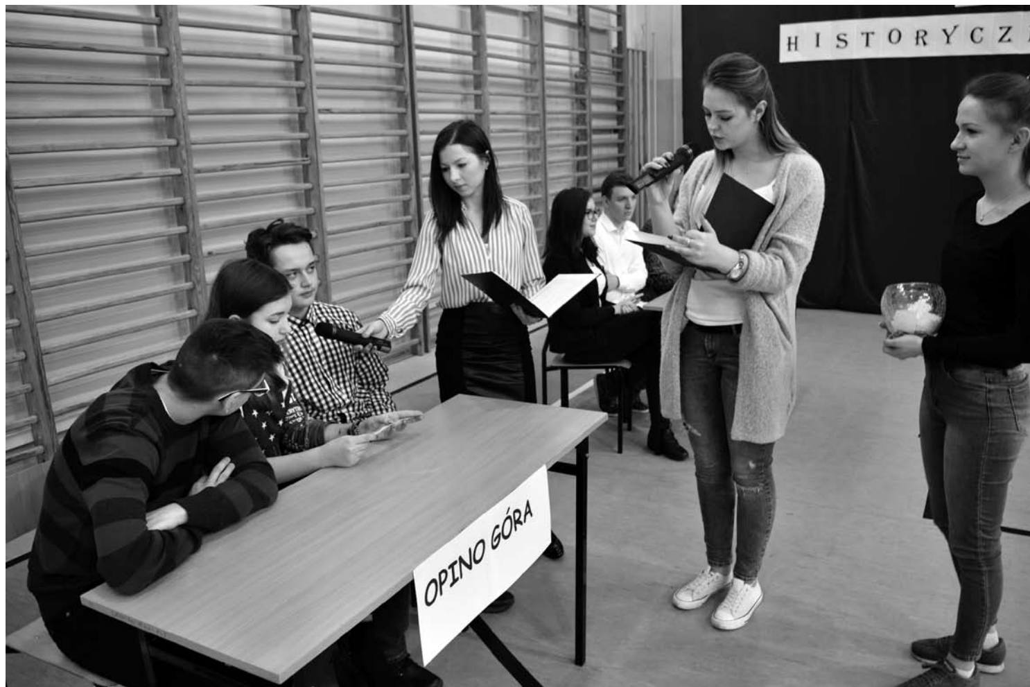
Młodzież odpowiada na pytania dotyczące postaci Marszałka J. Piłsudskiego