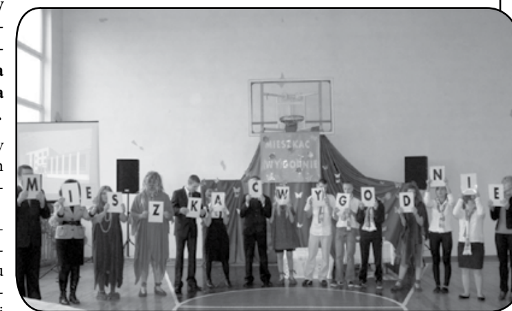
Młodzież cieszyła się z wiadomości, że miejsce ich nauki i mieszkania będzie nowoczesne i komfortowe