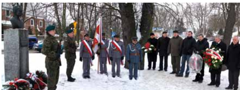
Rocznicę wybuchu powstania uczczono złożeniem kwiatów pod pomnikiem T. Kolbe

tencji żołnierzy powstania styczniowego, 20 i 27 stycznia 2013 r. w kościele farnym i w klasztorze. Ponadto 20 i 22 stycznia br., przed pomnikiem bohaterskiego dowódcy powstania Tomasza Kolbe, na skwerze Tajnej Organizacji Nauczycielskiej w Ciechanowie (obok ciechanowskiego klasztoru) złożone zostały wiązanki kwiatów. W Muzeum Szlachty Mazowieckiej mogliśmy obejrzeć wystawę pt.: „Chwała Zwycięzcom”. W 150 rocznicę Powstania Styczniowego, a w Powiatowym Centrum Kultury i Sztuki w Ciechanowie odbył się koncert muzyczny i projekcja filmu „Wierna rzeka”.