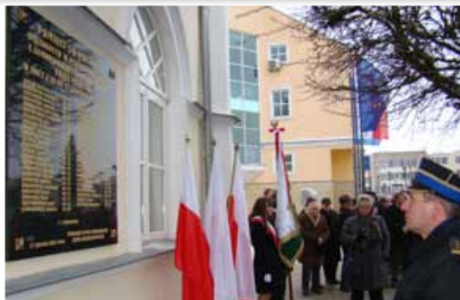
Nowa tablica, poświęcona zamordowanym przez okupanta polskim bohaterom, została odsłonięta na Ratuszu

Inną ważną datą dla ziemi ciechanowskiej jest 150. rocznica wybuchu Powstania Styczniowego. W związku z obchodami odprawione zostały msze św. w in-