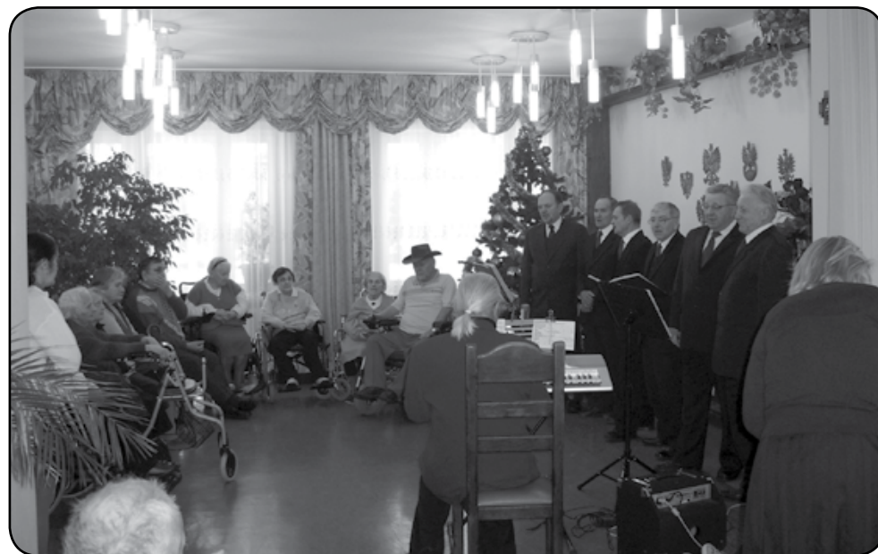
Koncert kołęd i piosenek ludowych, w wykonaniu zespołu Melodia, sprawił ogromną radość mieszkańcom Kombatanta

Występ zespołu był o tyle interesujący, że wśród znanych kołęd zaprezentowano także rzadziej wykonywane utwory oczywiście w aranżacji J. Szpojankowskiego m.in. „Śpij mój maleńki”, „Jakieś światło”, „Jezusek czuwa”, „Kolęda kołysanka”. Druga część koncertu to wesole piosenki i przyspiewki, także z lat młodości słuchających m.in. „Gwiazdeczka”, „To mój jest świat”, „Za-