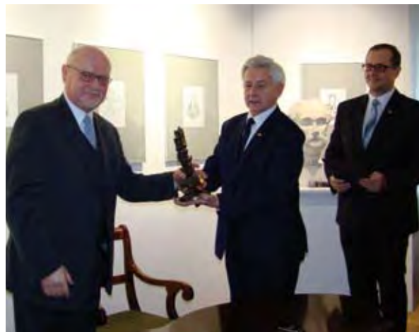
Laureat odbiera gratulacje od Zarządu TMZC