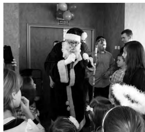
Dzieci z TPD odwiedził Mikołaj z paczkami

Zabawę karnawałową, od wielu lat, wspiera także samorząd powiatowy, udostępniając nieodpłatnie salę konferencyjną na zabawę.