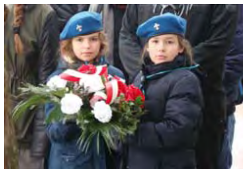
Najmłodszy pamiętają o historii miasta i regionu