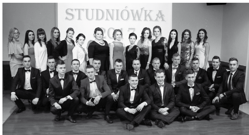
Klasa maturalna w Zespole Szkół Technicznych

Spśród szkół ponadgimnazjalnych najwcześniej bawili się uczniowie z Zespołu Szkół nr 3 im. S. Staszica w Ciechanowie. Setka uczniów wraz z osobami towarzyszącymi, na miejsce balu maturalnego wybrała dom weselny we Władysławowie. Studniówkę zainaugurował oczywiście tradycyjny polonez. Później przyszedł czas na przemówienia, podziękowania i życzenia. Pomyślności, połamania piór i odwagi, która dodaje skrzydeł i prowadzi w wymarzonej kierunku – życzyła maturzystom