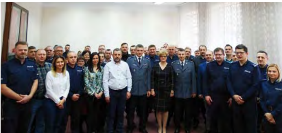
Emerytowanych pracowników KPP żegnali nie tylko ich koledzy mundurowi, ale również pracownicy cywilni