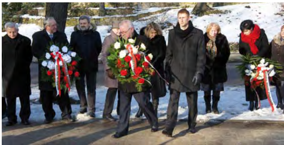
Delegacja powiatu ciechanowskiego złożyła kwiaty pod pomnikiem dowódcy powstania styczniowego