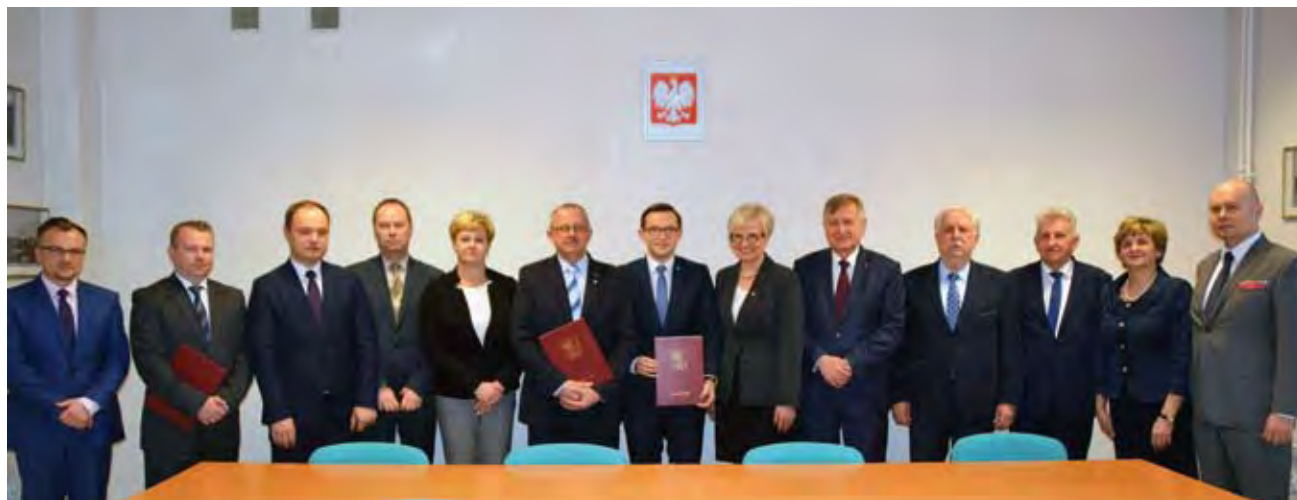
Podpisanie porozumienia przez samorządowców subregionu ciechanowskiego w sprawie wspólnego realizowania inwestycji