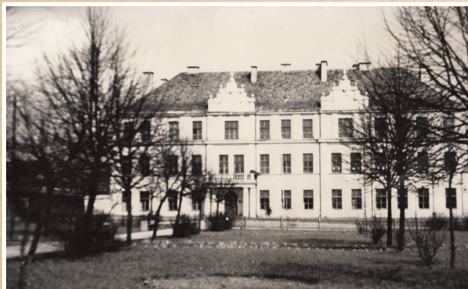
Budynek Starostwa; w okr. międzywojennym była tu siedziba Komendy Powiatowej Policji