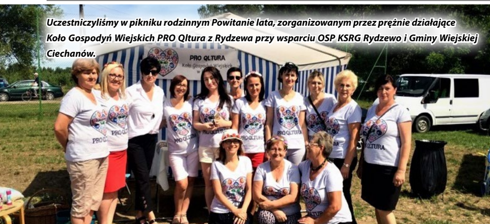
Uczestniczyliśmy w pikniku rodzinnym Powitanie lata, zorganizowanym przez prężnie działające Koło Gospodyń Wiejskich PRO Qltura z Rydzewa przy wsparciu OSP KSRG Rydzewo i Gminy Wiejskiej Ciechanów.