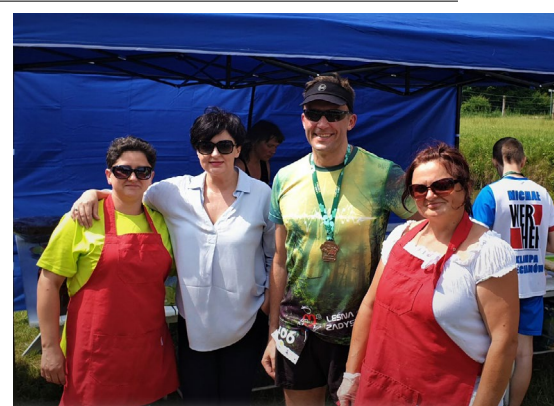
W tym roku IV edycja Leśnej zaDyszkę w Szulmierzu zgromadziła ponad 500 uczestników biegu. Impreza promująca przepiękne tereny powiatu ciechanowskiego, z roku na rok zrzesza coraz większą liczbę fanów tego rodzaju sportu.