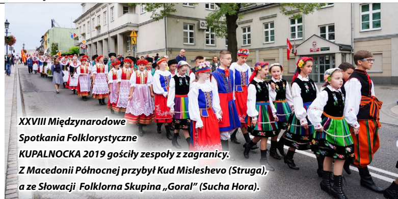
XXVIII Międzynarodowe Spotkania Folklorystyczne KUPALNOCKA 2019 gościły zespoły z zagranicy. Z Macedonii Północnej przybył Kud Misleshevo (Struga), a ze Słowacji Folklorna Skupina „Goral” (Sucha Hora).