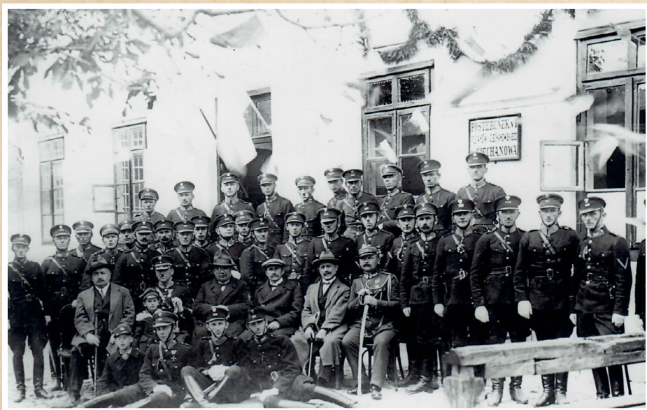
Policjanci ciechanowscy, 1934 r.

stwem katolickim. Administracja powiatu spoczywała w rękach wyznaczonego przez urząd gubernialny naczelnika powiatu, który stał na czele Zarządu Powiatowego. Naczelnik miał dwóch pomocników: jednego do spraw administracyjnych, drugiego