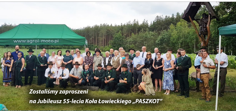
Zostaliśmy zaproszeni na Jubileusz 55-lecia Koła Łowieckiego „PASZKOT”