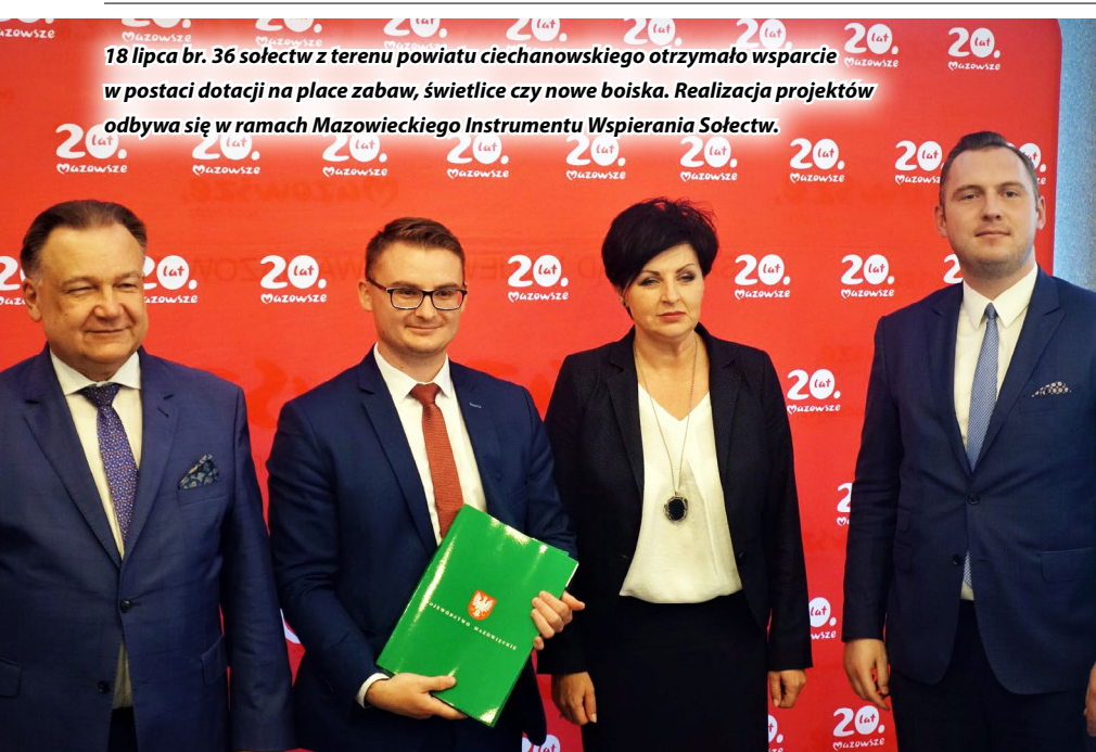
18 lipca br. 36 sołectw z terenu powiatu ciechanowskiego otrzymało wsparcie w postaci dotacji na place zabaw, świetlice czy nowe boiska. Realizacja projektów odbywa się w ramach Mazowieckiego Instrumentu Wspierania Sołectw.