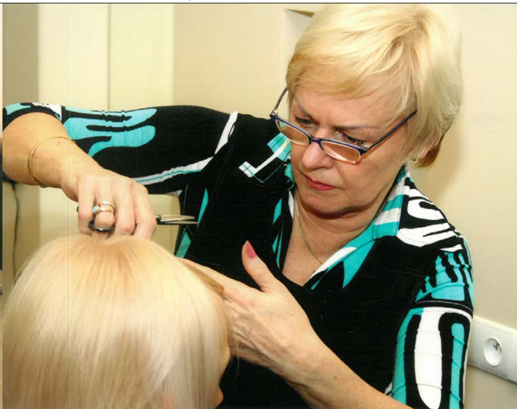
Strzyżenie jest najważniejsze i wymaga skupienia

problemu dostarczone. Poza tym dzięki mediom społecznościowym i kontaktom online można mieć stały kontakt z producentami, uczestniczyć w szkoleniach i prezentacjach. To pozwala być na bieżąco z nowościami w branży fryzjerskiej. Nie spełniły się na szczęście czarne scenariusze, że już w 2000 roku fryzjerzy nie będą mieli kogo czesać, bo kobiety stracą włosy od agresywnych chemicznych preparatów. Dziś fryzjerstwo korzysta z badań instytutów naukowych i renomowanych laboratoriów, dzięki czemu pojawiają się coraz lepsze, bardziej bezpieczne preparaty używane w salonach.