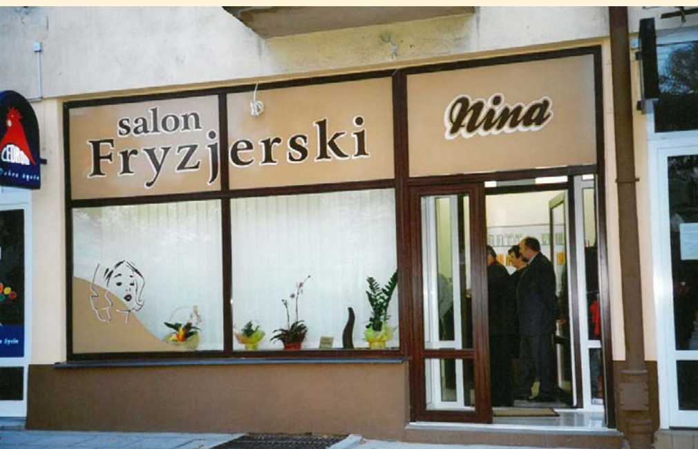
Salon „NINA” działa od 2005 roku

Rewolucja w branży fryzjerskiej stała się faktem. Pamiętam pierwsze pokazy, wystawy firm zachodnich na początku lat dziewięćdziesiątych. Oglądając prezentowane produkty niemieckie czy francuskie, już wówczas dostawałyśmy oczopląsu. Polskie fryzjerstwo znacząco zmienili Niemcy. Niemiecka firma Wella nawiązywała współpracę z zakładami fryzjerskimi nawet z małych, prowincjonalnych miasteczek. Moja współpraca z tą firmą trwa już trzydzieści lat. Firmy francuskie interesowały się wówczas wyłącznie dużymi miastami. Dziś zaopatrzenie w naszej branży to inna rzeczywistość. Doczekałam czasów, że nie muszę nigdzie jeździć. Wszystko, co jest mi potrzebne w pracy, może być bez