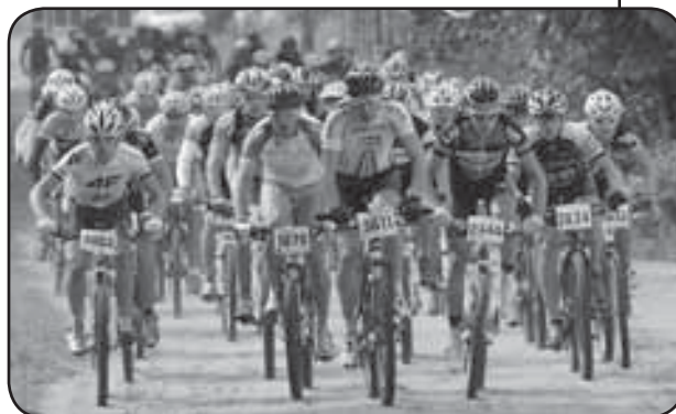
Peleton kolarzy na trasie maratonu