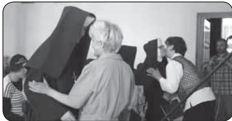
Siostry, pracujące w DPS przy ul. Kruczej żegnali mieszkańcy, dziękując za troskę i serce wkładane w pracę z podopiecznymi

Z miastem i Domem Pomocy Społecznej przy ul. Kruczej, Albertynki pożegnały się ostatecznie w sierpniu.