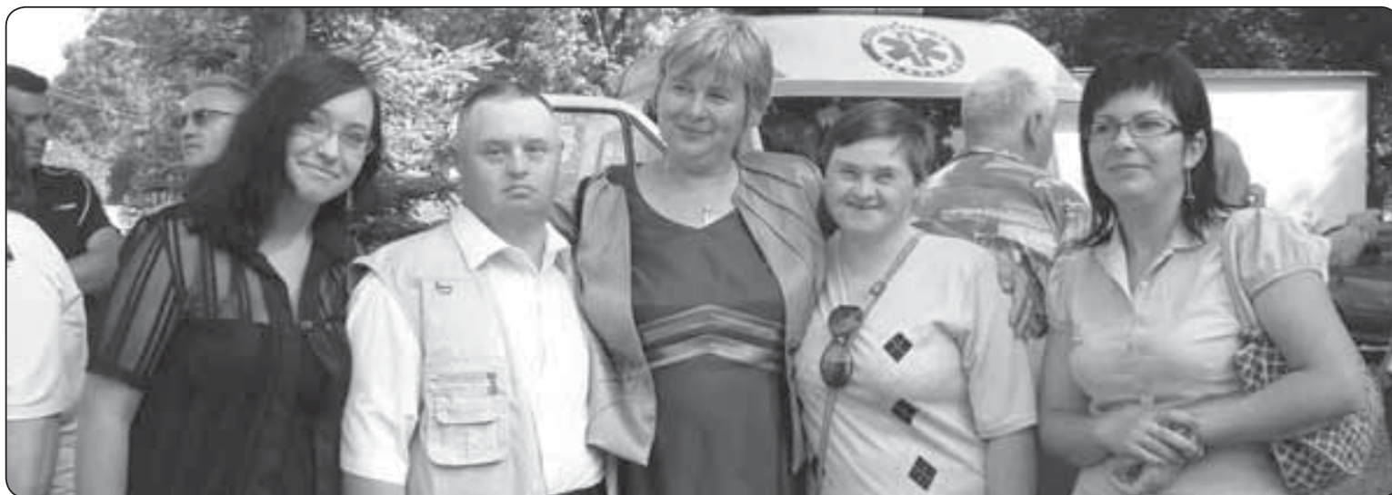
Atmosfera spotkania była wyjątkowa, ciepła i serdeczna. Uczestnicy nawiązywali nowe znajomości i świetnie się bawili

Realizacja projektu zakończy się 31 grudnia 2012 r.