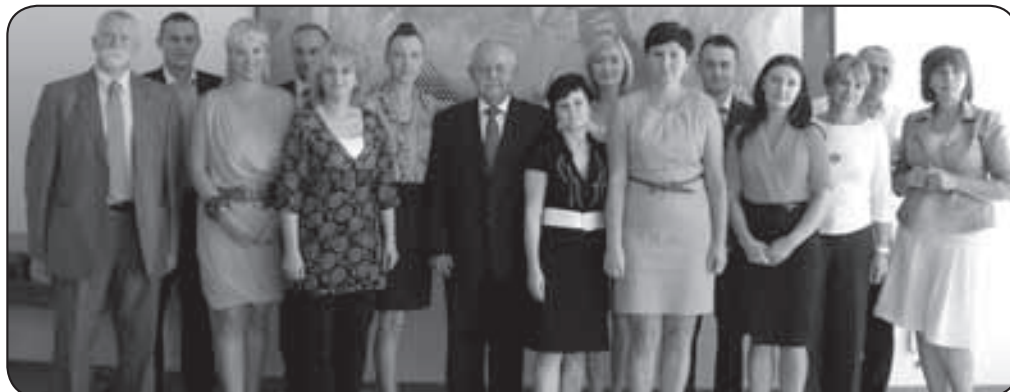
Nowi nauczyciele mianowani w szkołach powiatowych w towarzystwie przedstawicieli władz powiatowych i dyrektorów szkół