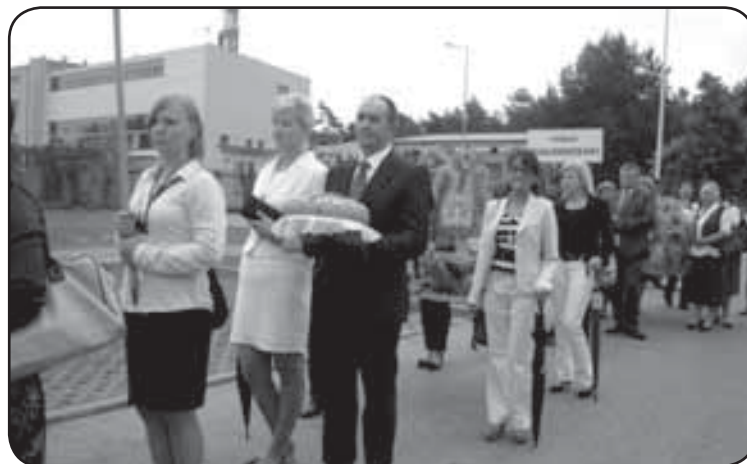
Przemarsz korowodu dożynkowego na stadion w Kozienicach

kom towarzyszyły liczne pokazy, kiermasze, wystawy i inne występy artystyczne.