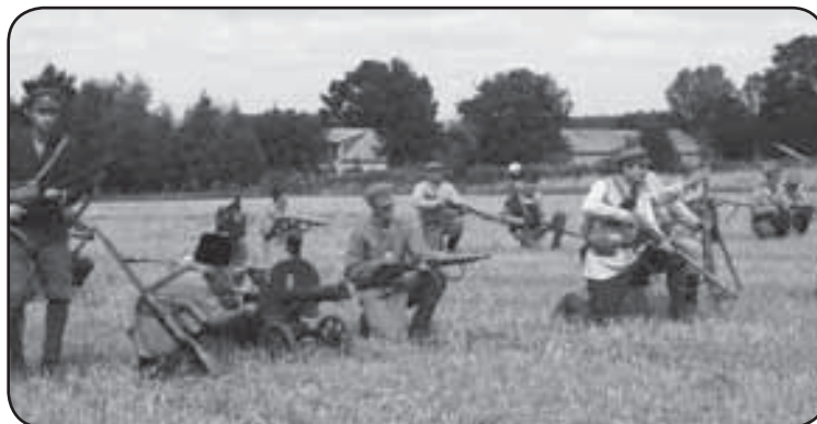
Widowisko było inscenizacją jednej z ważniejszych bitew rozegranych podczas wojny 1920 roku

Użycie efektów pirotechnicznych podczas tegorocznej rekonstrukcji sprawiło, że odtwarzane sceny walk wyglądały realistycznie. Na polu bitewnym użyto m.in. samochodu pancernego, wykonanego na podwoziu Forda T oraz armaty wzór 02/26. Rekonstruktorzy grający bolszewików w ramach swojej roli zdobyli armatę, „rozstrzelali” jednego z mieszkańców, „podpalili” okoliczne zabudowania, a potem... zabrali