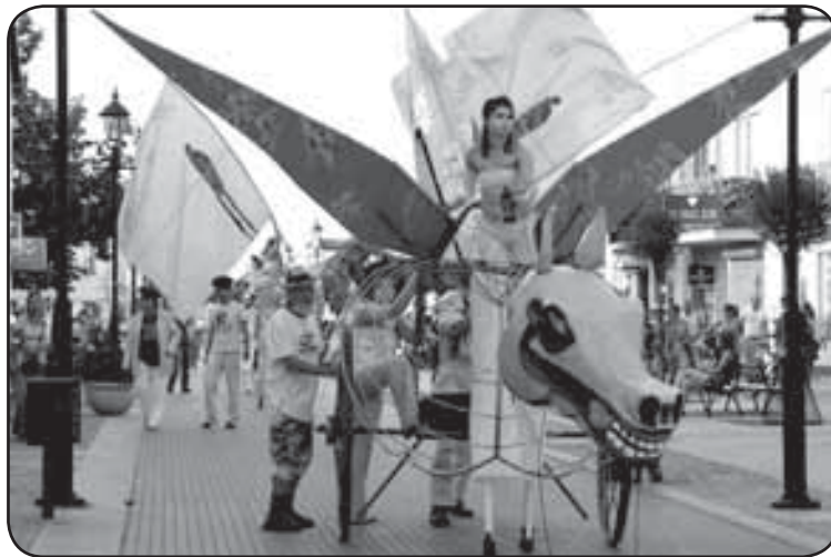
Występ jednego z teatrów na deptaku przy ul. Warszawskiej