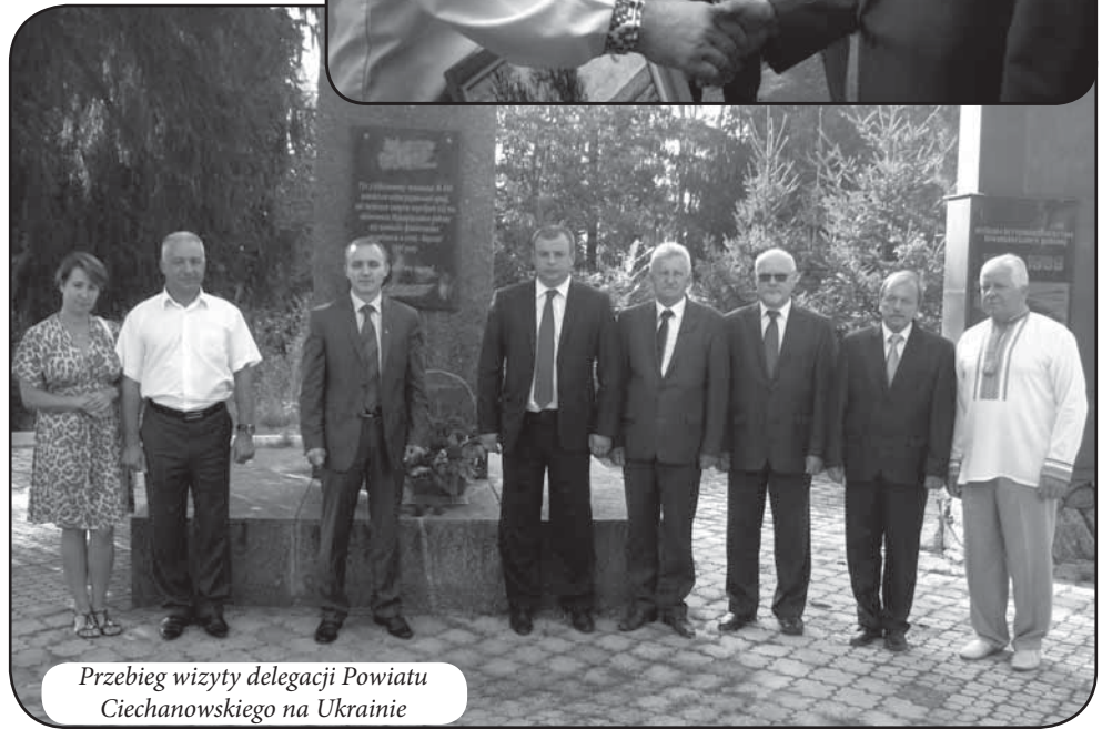
Przebieg wizyty delegacji Powiatu Ciechanowskiego na Ukrainie