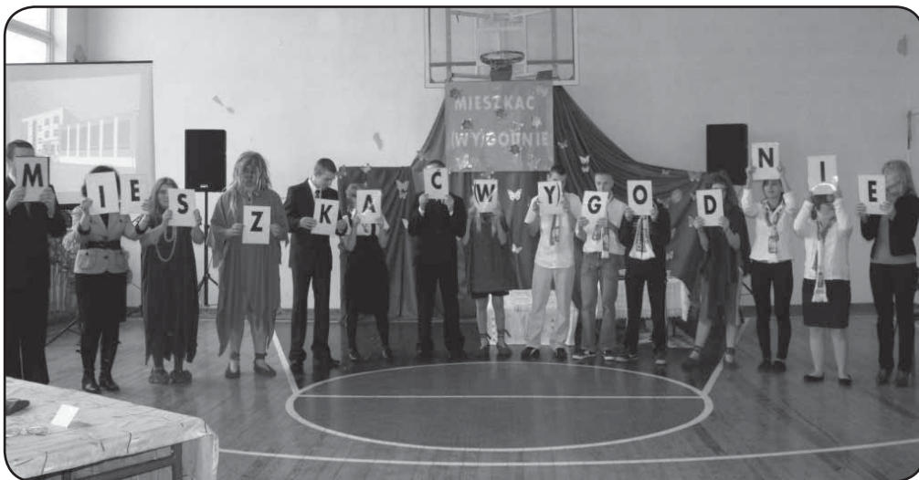
Przedstawienie wychowanków SOSW, czekających na nowy budynek ich „drugiego domu”