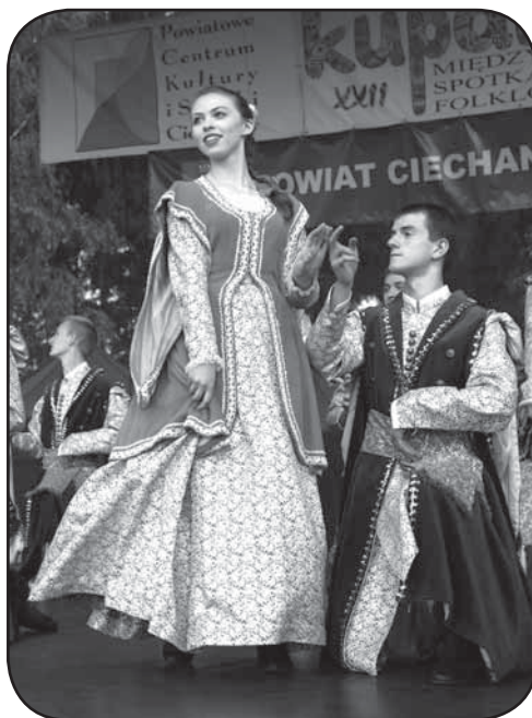
Nasza дума - LZA Ciechanów zawsze wypada doskonale podczas występów na scenie