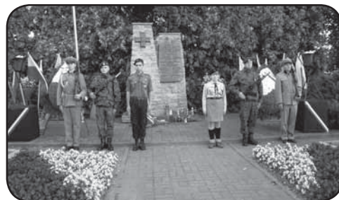
Kwaterna Wojska Polskiego i Ofiar Terroru