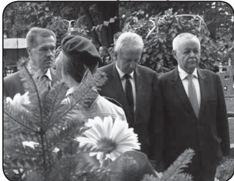
Delegacja władz powiatowych składa wiązankę kwiatów na Cmentarzu Komunalnym w Ciechanowie.