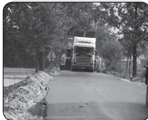
Kołaki Kwasy gm. Grudusk

Natomiast nowa nawierzchnia i chodniki w miejscowości Przywilecz gm. Grudusk (0,5 km) będą kosztowały 383 274 zł., a powiat obie inwestycje wsparł kwotą 246 684 zł.