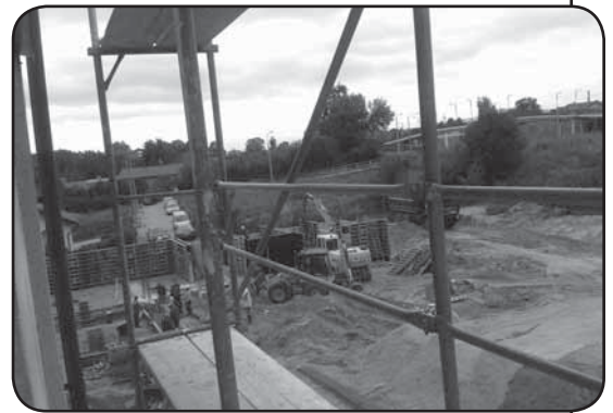
Trwające prace nad rozbudową placówki specjalnej w Ciechanowie