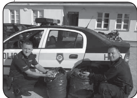
Akcja zbiórki nakrętek jest godna pochwały. Każda inicjatywa pomagająca dzieciom jest bardzo ważna

5 września - Policjanci z Ciechanowa uczestniczyli w pomocy chorym dzieciom, wymagającym kosztownego leczenia i sprzętu do rehabilitacji. Przez kilka miesięcy trwała zbiórka plastikowych nakrętek w Ciechanowskiej Komendzie Policji. To dzielnicowi wystawili kartonik w holu jednego z budynków. W takiej akcji mógł uczestniczyć każdy policjant, ale również każdy z interesantów. Zebrane dwa worki nakrętek przekazane zostały dla Żoliborskiego Stowarzyszenia „Dom - Rodzina - Człowiek”. Z ich sprzedaży są finansowane zabiegi leczenia i zakup sprzętu do rehabilitacji dla dzieci. Akcja będzie kontynuowana.