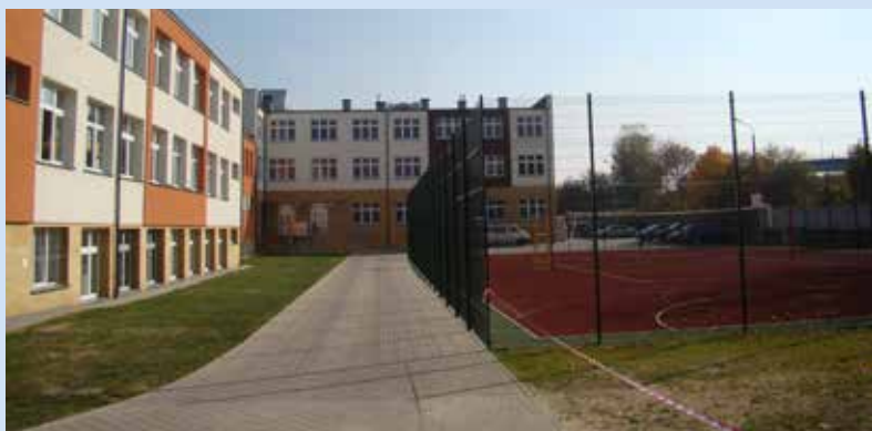
SOSzW po rozbudowie