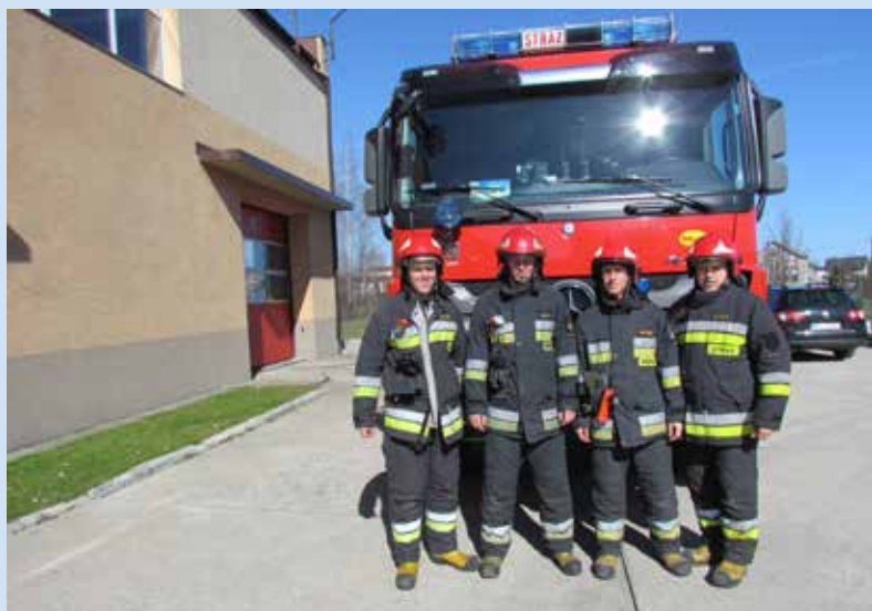
Ciężki samochód ratowniczo-gaśniczy KP PSP w Ciechanowie