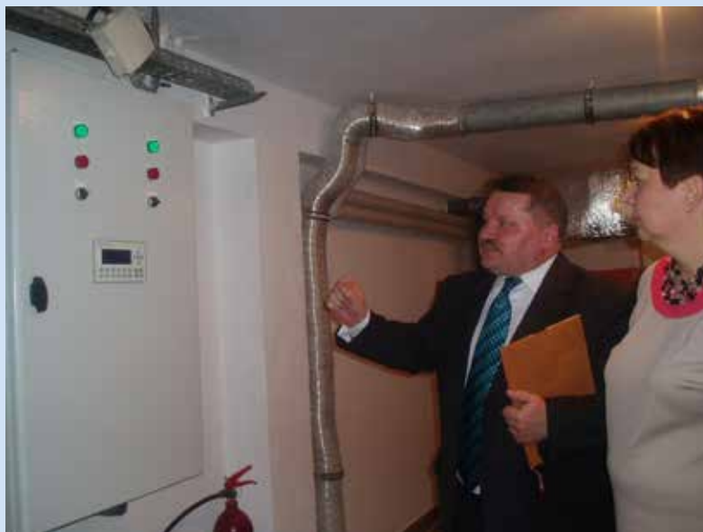
Aparatura sterująca urządzeniami basenowymi