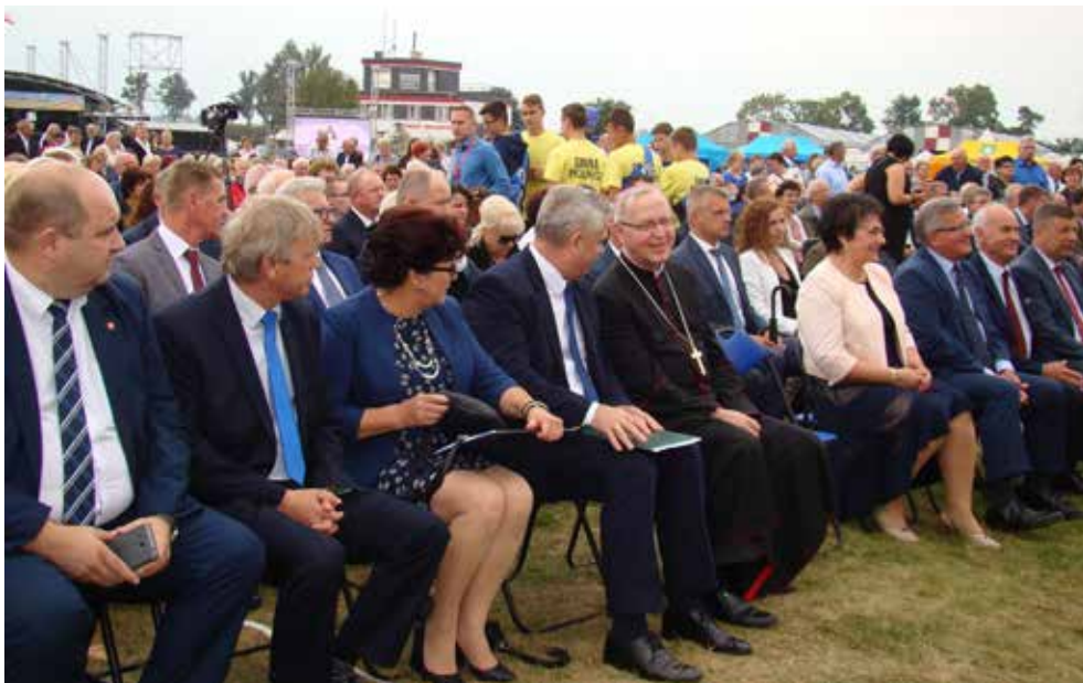
Święto plonów województwa mazowieckiego na lotnisku w Sierakowie