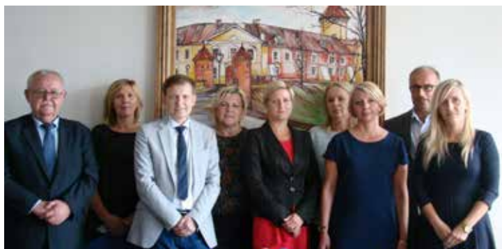
Mianowani nauczyciele wraz z dyrektorami swoich szkół oraz przedstawicielami samorządu powiatowego