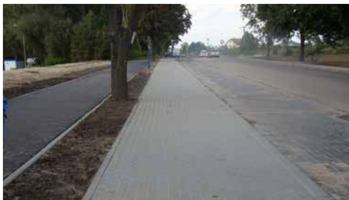
Ulica Sońska w Ciechanowie w czasie przebudowy