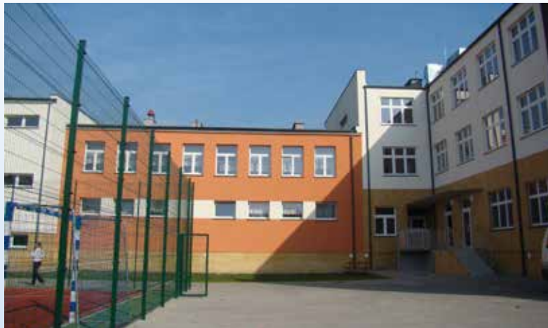
SOSzW po zakończeniu projektu