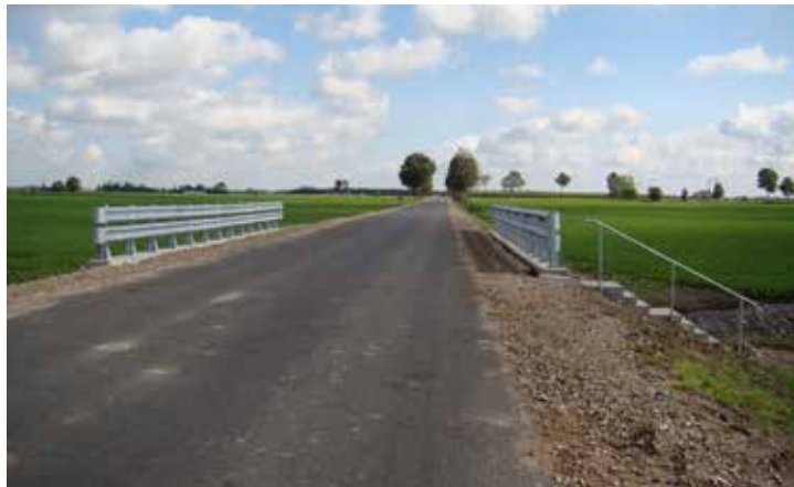
Przebudowana droga Opinogóra-Długoleka