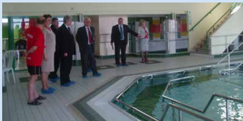
Zmodernizowany basen w DPS Kombatant