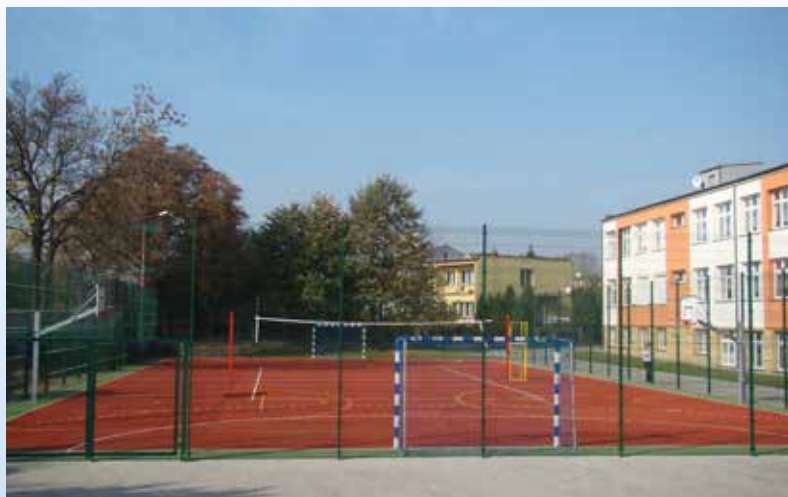
Boisko w SOSzW