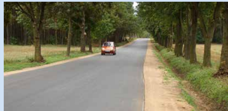
Zmodernizowana droga Ciechanów-Modła