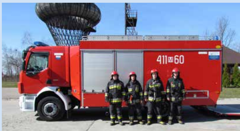
Ciężki samochód ratownictwa chemicznego