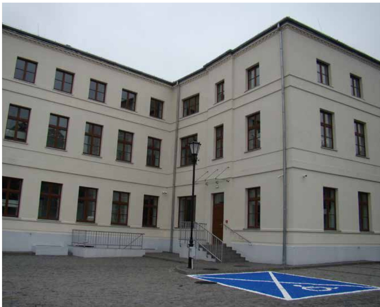
Elewacja przebudowanego budynku Polonii od podwórka