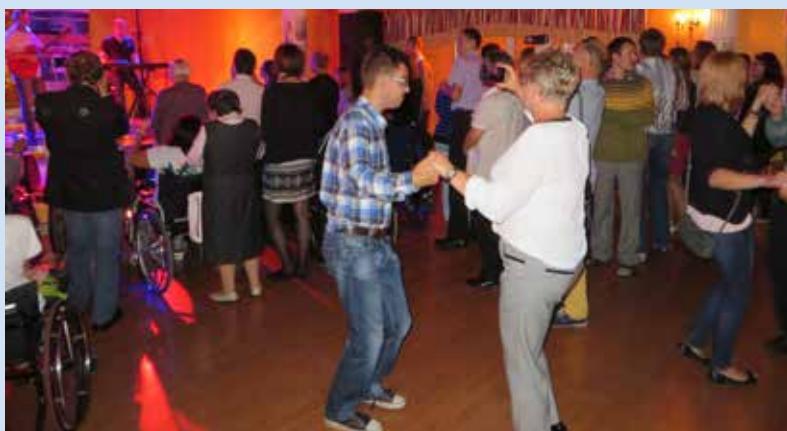
Festyn dla osób niepełnosprawnych w Niestumię