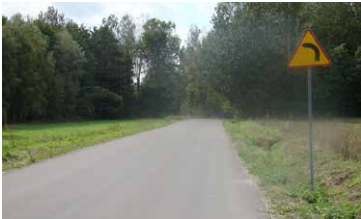
Droga Gołoczyna-Zawady po remoncie