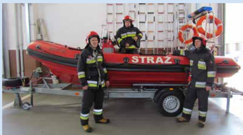
Łódź do prowadzenia działań podwodnych i na powierzchni