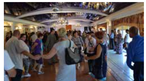
Przebieg festynu dla osób niepełnosprawnych i ich opiekunów w Niestumiu