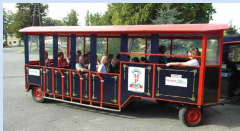
Festyn dla osób niepełnosprawnych w Niestumiu