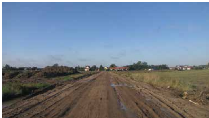
Remontowana droga Ciechanów-Młock