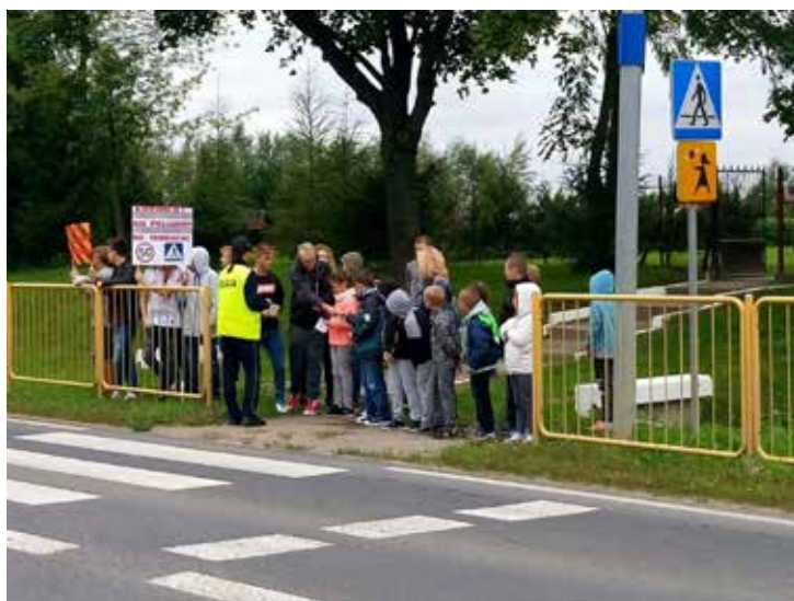
Młodzież pod opieką policjantów oceniała jazdę kierowców w rejonie przejść dla pieszych

4 września – Przez pierwsze dni nowego roku szkolnego policjanci prowadzili wzmożone działania mające na celu zapewnienie bezpieczeństwa dzieciom. W trakcie działań policjanci ruchu drogowego kontrolowali tzw. gimbusy, czyli autobusy dowożące dzieci do szkoły, sprawdzali stan techniczny pojazdów, wyposażenie oraz uprawnienia kierujących autobusami. Dodatkowo policjanci sprawdzali w jaki sposób rodzice dowożą dzieci do szkoły, czy stosowane są foteliki, podwyższenia oraz pasy bezpieczeństwa. W tym czasie w rejonach szkół można było zobaczyć policjantów oraz funkcjonariuszy Straży Miejskiej, którzy mieli za zadanie pomóc najmłodszym w prawidłowym, bezpiecznym poruszaniu się na drodze szczególnie przechodzeniu przez jezdnię.