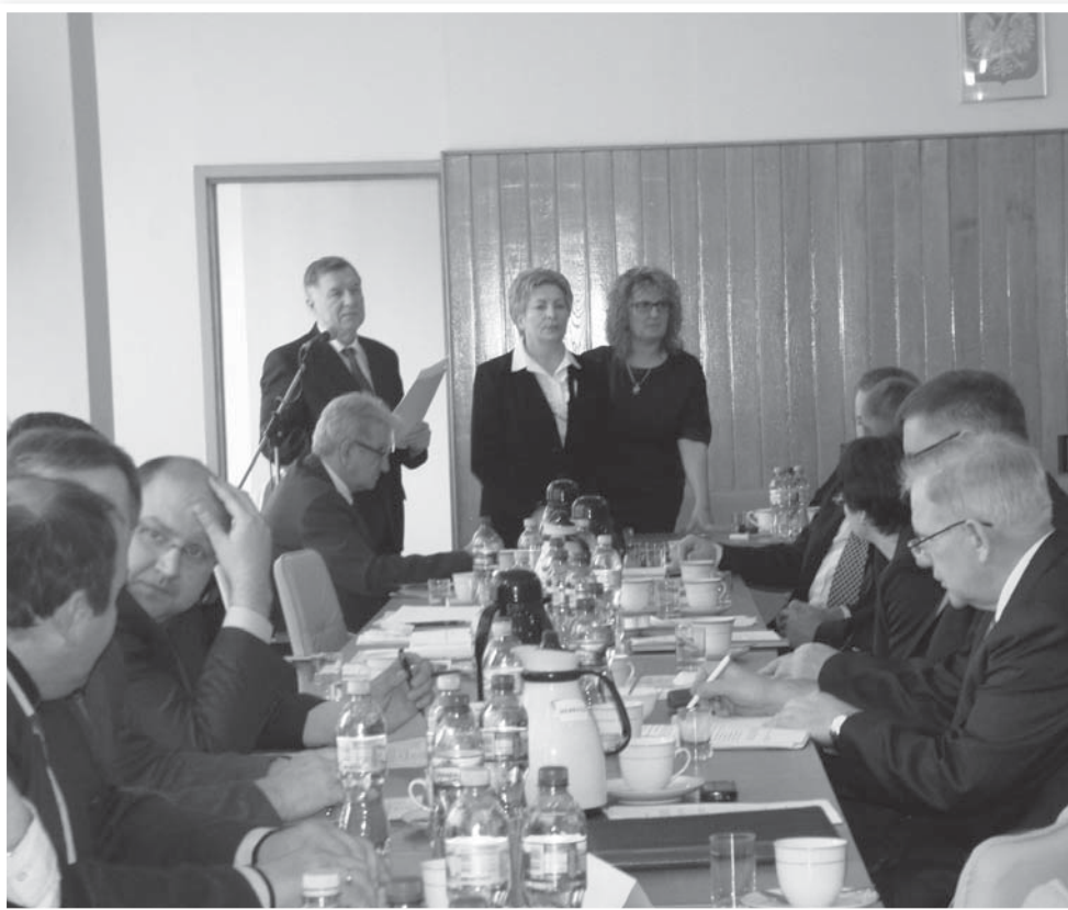
Przebieg obrad pierwszej sesji RP