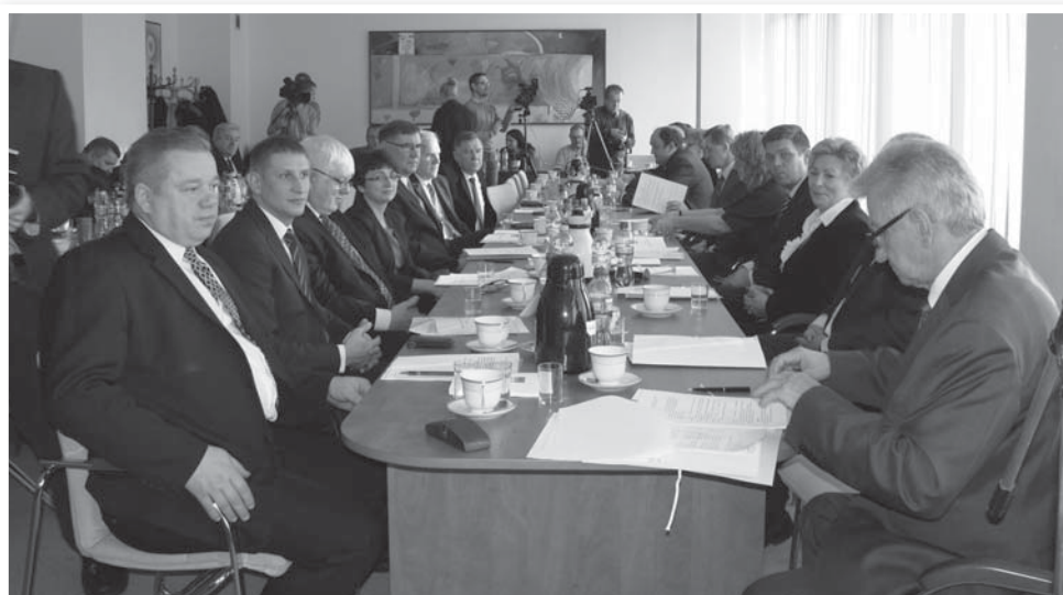
Nowa Rada Powiatu