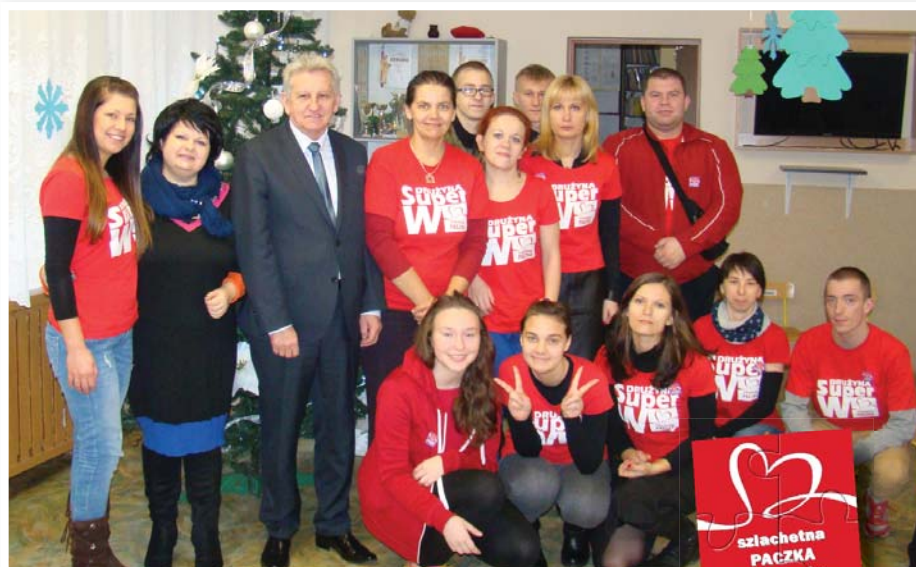
W sztabie akcji Szlachetna Paczka w Ciechanowie