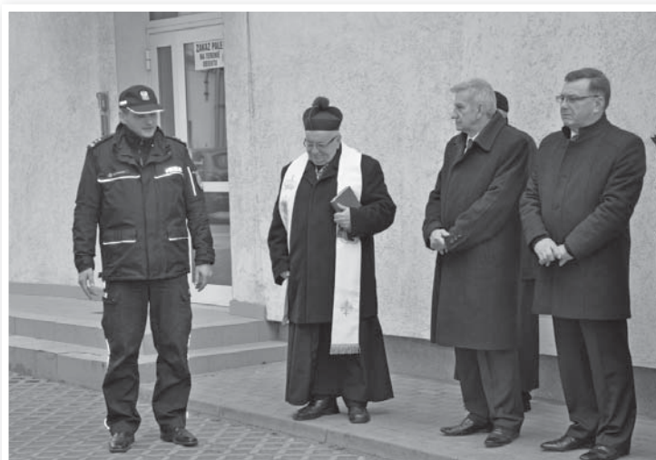
Przekazanie pojazdów Komendzie Powiatowej Policji w Ciechanowie