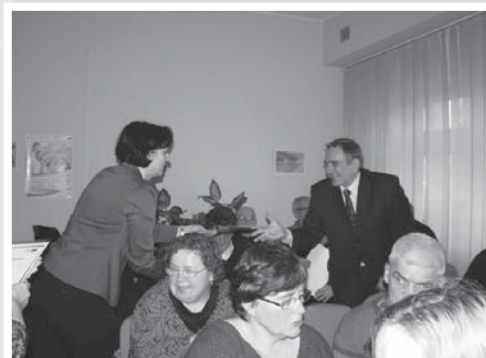
Przebieg spotkania kończącego realizację projektu w Ciechanowie