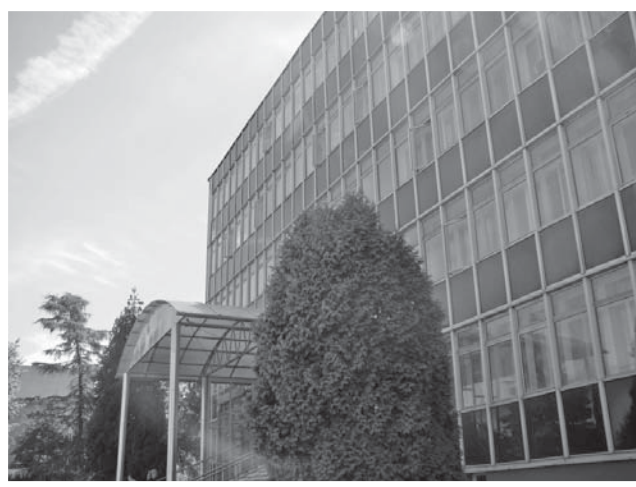
Budynek Starostwa Powiatowego w Ciechanowie

Lekarz Bogdan Latko poinformował o sytuacji zagrożeń zachorowania na ASF na terenie Polski, ze szczególnym uwzględnieniem terenów województw wschodnich. Przekazał, że dotychczas stwierdzono 21 takich przypadków – wśród trzody chlewnej 7 (w 2 gospodarstwach), a pozostałe to zakażenia dzików. Podkreślił, że wszystkie przypadki zachorowań wśród dzików stwierdzono w bezpośredniej bli-