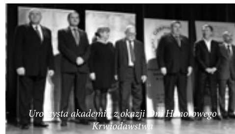
Uroczysta akademii z okazji Dni Honorowego Krwiodawstwa