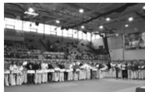
Przebieg turnieju Mazovia Cup 2015