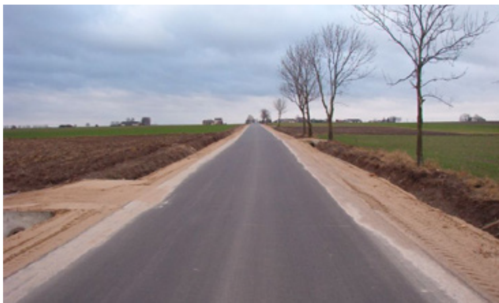
Przebudowana droga w okolicach Szulmierza