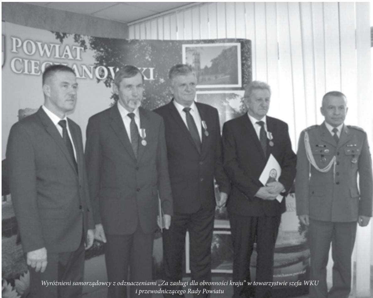
Wyróżnieni samorządowcy z odznaczeniami „Za zasługi dla obronności kraju” w towarzystwie szefa WKU i przewodniczącego Rady Powiatu

Podczas sesji trzech samorządowców zostało wyróżnionych medalami „Za zasługi dla obronności kraju”. Złoty medal otrzymał