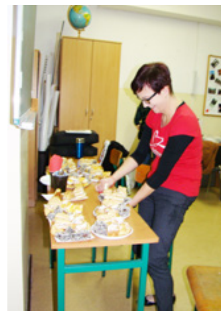
W sztabie akcji Szlachetnej Paczki w Ciechanowie Na prośbę rodziny nie publikujemy fotografii z wizyty w ich mieszkaniu