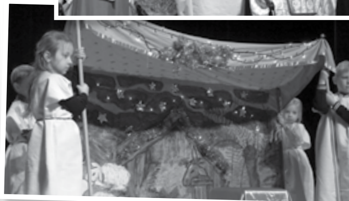
Dzieci i młodzież podczas przedstawień jasełkowych