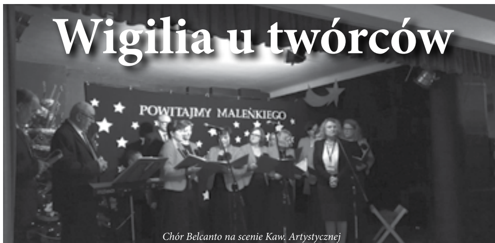
Chór Belcanto na scenie Kaw. Artystycznej

Koncert pod hasłem „Powitajmy Małego”, dzielenie się opłatkiem, życzenia zdrowych i spokojnych Świąt Bożego Narodzenia oraz wieczerza złożyły się na niedzielne (13 grudnia br.) spotkanie twórców z powiatu ciechanowskiego na spotkaniu w Powiatowym Centrum Kultury i Sztuki w Ciechanowie.