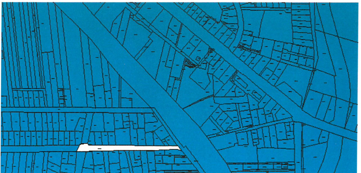
m. Ciechanów, obr. Śmiecin, dz. 320/2, 471/2