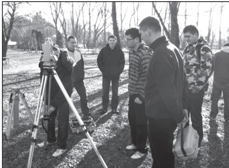
Uczniowie ZST podczas ćwiczeń w ramach zajęć unijnych „Geoderza dla technika drogownictwa”

W Zespole Szkół nr 1 w Ciechanowie pojawi się po kilku latach nieobecności technik elektryk, a także technik informatyk i pokrewny technik teleinformatyk. W Zespole Szkół nr 2 w Ciechanowie zaproponowano zgodnie z profilem szkoły zawody ekonomiczne i gastronomiczno – hotelarskie, w Zespole Szkół nr 3 w Ciechanowie – technik pojazdów samochodowych, także związany z tradycyjnym profilem szkoły. W Zespole Szkół Technicznych w Ciechanowie pojawia się jako ciekawa propozycja tzw. klas dwuzawodowych. Oznacza to, że uczniowie jednej klasy będą wspólnie uczyć się przedmiotów ogólnokształcących i najbardziej zbliżonych programowo teoretycznych przedmiotów zawodowych, a pozostałych przedmiotów, w tym praktycznych, będą uczyć się w oddzielnych grupach szkolnych.