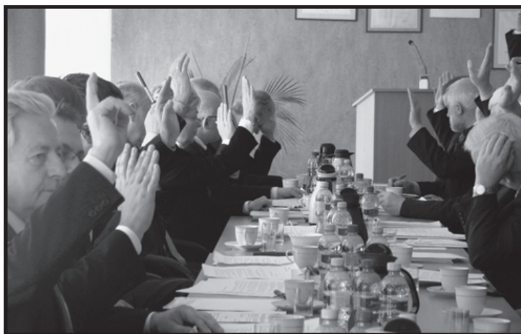
Sesja – głosowanie radnych

c) zmiana uchwały budżetowej powiatu ciechanowskiego na 2012 rok. Wynik głosowania – 20 głosów – za.