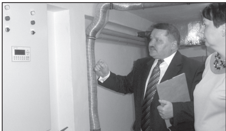
Aparatura, wykorzystywana do pracy pływalni jest bardzo nowoczesna. Z jednej skrzynki, komputerowo, można sterować całym zasobem basenowym