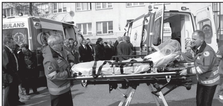
Nowe karetki pogotowia są bardzo nowoczesne, dobrze wyposażone i zapewniają udzielenie szybszej pomocy pacjentom