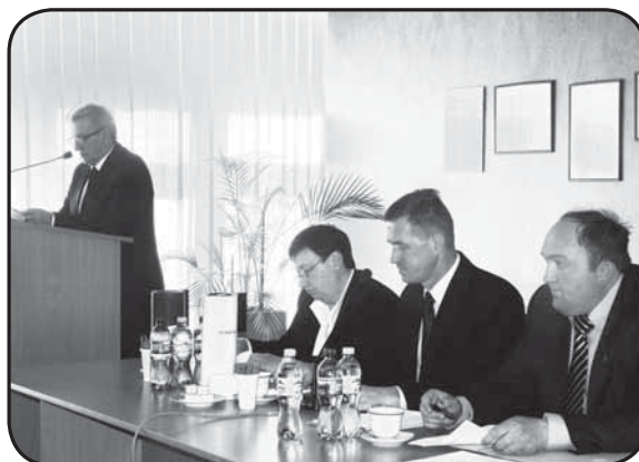
Starosta składa relację z wykonania budżetu powiatu w 2013 roku

Starosta podkreślił też, że Zarząd Powiatu w sposób racjonalny i oszczędny wydatkował środki finansowe w roku 2013, a podejmowane działania zwiększyły wpływy do budżetu powiatu, co w konsekwencji pozwoliło na realizację