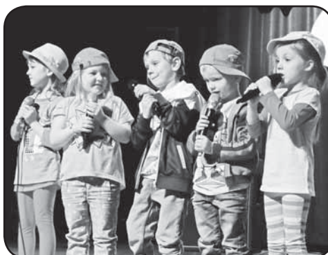
Największe brawa otrzymały oczywiście przedszkolaki, które bardzo profesjonalnie przygotowały się do występów

Celem tego konkursu jest zainteresowanie dzieci, młodzieży i ich opiekunów tematyką zdrowia oraz aktywizacja środowisk szkolnych w zakresie działań prozdrowotnych. Uczniowie wraz z opiekunami przygotowali własne utwory wokально – muzyczne dotyczące szeroko rozumianego zdrowia; czyli zdrowego stylu życia, zdrowego odżywiania, profilaktyki nałogów, higieny osobistej, ochrony środowiska. Rywalizacja konkursowa odbywała się na profesjonalnej scenie Centrum Kultury i Sztuki w Ciechanowie w trzech kategoriach wiekowych: przedszkola, szkoły podstawowe, gimnazja. W tegorocznym przeglądzie wzięło udział 157 uczestników z 21 placówek – zaczynając od najmłodszych przedszkolaków poprzez