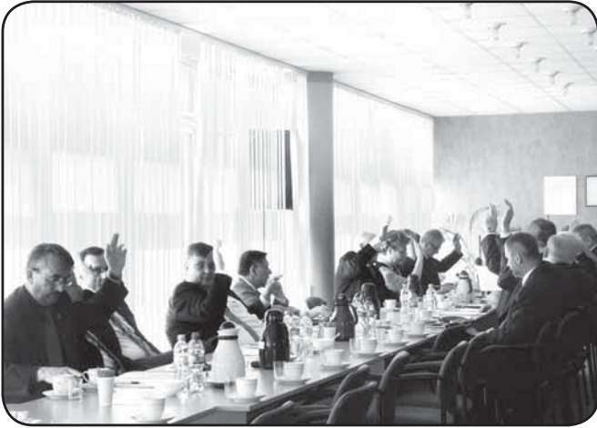
Radni przyjęli zgodnie dwa stanowiska zaproponowane na sesji