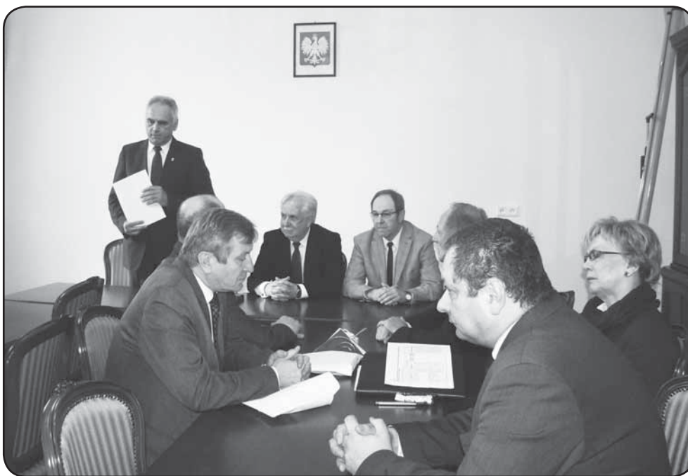
List intencyjny przedstawiciele samorządów z subregionu podpisali 7 kwietnia w ciechanowskim Ratuszu

Powiat ciechanowski: Budowa centrum logistycznego wraz z drogowo - kolejowym węzłem przesiadkowym w rejonie dworca PKP w Ciechanowie; Zwiększenie mobilności regionalnej, poprawa dostępności do kształcenia zawodowego oraz do wysokiej jakości usług poprzez włączenie dojazdu do Specjalistycznego Szpitala Wojewódzkiego w Ciechanowie do systemu transportowego subregionu; Poprawa spójności komunikacyjnej i dostępności szkolnictwa zawodowego w powiecie ciechanowskim poprzez przebudowę drogi powiatowej nr 1241W na odcinku Ciechanów - Młock oraz przebudowę drogi powiatowej nr 1237W na odcinku Ciechanów - Opinogóra -