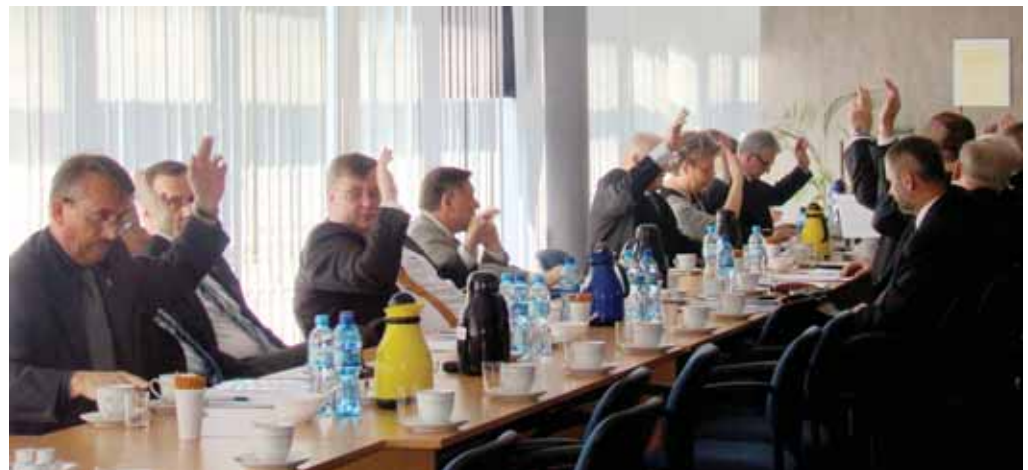
Radni w sprawie udzielenia absolutorium byli zgodni i udzielili Zarządowi skwitowania zdecydowaną większością głosów

Jedną z ważniejszych sesji Rady Powiatu Ciechanowskiego, dotycząca sprawozdania z wykonania budżetu powiatu za ubiegły rok i udzielenia absolutorium Zarządu odbyła się 22 kwietnia 2014 roku w sali konferencyjnej budynku Starostwa w Ciechanowie.