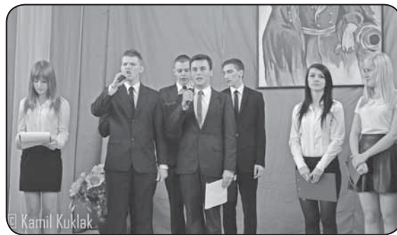
Młodzież prezentuje część artystyczną, poświęconą swojemu patronowi