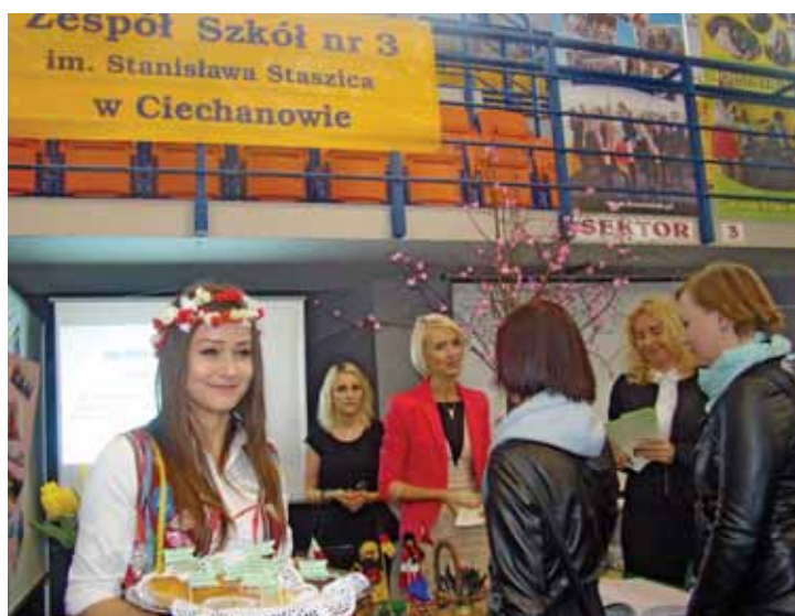
Ciekawe stoiska przyciągały uwagę zwiedzających, głównie młodzieży, która stoi przed wyborem szkoły

Prezentacje ofert wystawców, występy młodzieży, testy monocyklów i cardów złożyły się na VI Subregionalne Targi Edukacji i Pracy, które odbywały się w Ciechanowie 16 kwietnia br. Od sześciu lat impreza ma nową formułę organizacyjną, zastępującą lokalne spotkania młodzieży, organizowane przez służby zatrudnienia.