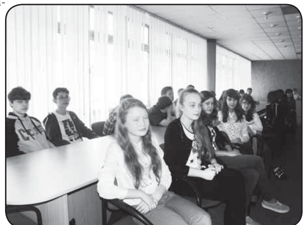
Obrady rajców obserwowała grupa młodzieży z Gimnazjum TWP w Ciechanowie