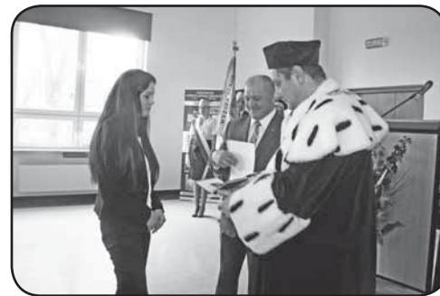
Dyplomy, absolwenci Rolnictwa ciechanowskiej PWSZ odebrali m.in. z rąk ministra i rektora uczelni

Następnie minister Marek Sawicki, razem z rzecznikiem PSL Krzysztofem Kosińskim wziął udział w krótkiej konferencji prasowej na temat aktualnej sytuacji w rolnictwie i eksporcie polskiej żywności. Na pytanie