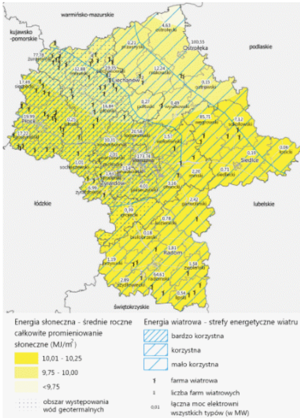
Rysunek. Potencjał energetyki odnawialnej w województwie mazowieckim.

inwestorów. Zwracano uwagę, że tym zakresie, oprócz atrakcyjnych działań promocyjnych i edukacyjnych, konieczne są sprzyjające uwarunkowania formalno-prawne oraz ekonomiczne w wymiarze ogólnopolskim. W minionych kilku latach pojawiły się działania, których efektem są zainstalowane urządzenia służące wykorzystywaniu energii wiatrowej (tzw. wiatraki), ale pojawiły się również w skali ogólnopolskiej nowe problemy, które ograniczyły ich rozwój. Należy dodać, że na obszarze powiatu ciechanowskiego istnieją udokumentowane zasoby wód geotermalnych, które stanowią mogą efektywne źródło energii odnawialnej.