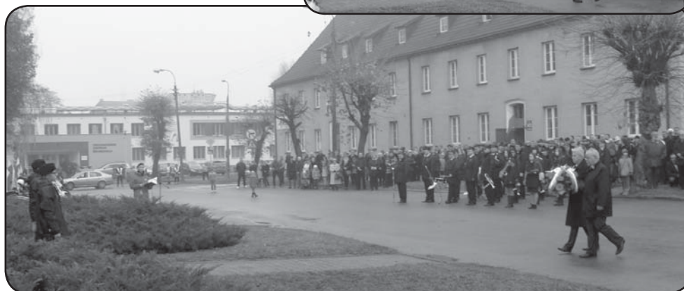
Uroczystości 11 Listopada na Placu Piłsudskiego w Ciechanowie