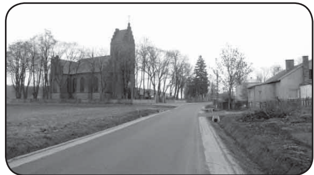
Fragmety drogi Ościslówo-Sulerzyż przebudowanej w ramach tzw. „schetyńówki”

infrastruktury drogowej. Stanowi kontynuację „Narodowego programu przebudowy dróg lokalnych 2008-2011”. W 2013 r. remonty lub budowy dotyczyły 140 km dróg za 102,5 mln zł., z tego rządowa dotacja to 48 mln zł. W 2014 r. - 148 km tras za 138 mln zł (dotacja 67,5 mln zł).