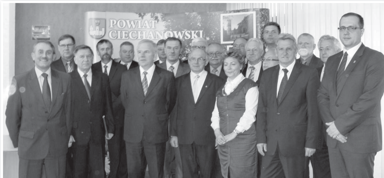
Pożegnanie radnych powiatu ciechanowskiego