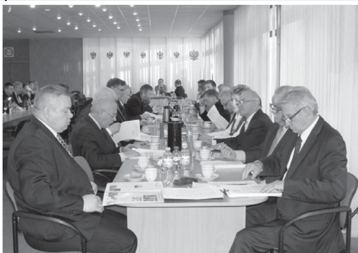
Rada Powiatu IV kadencji