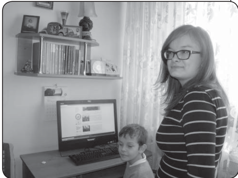
Dzieci cieszą się z dostępu do Internetu