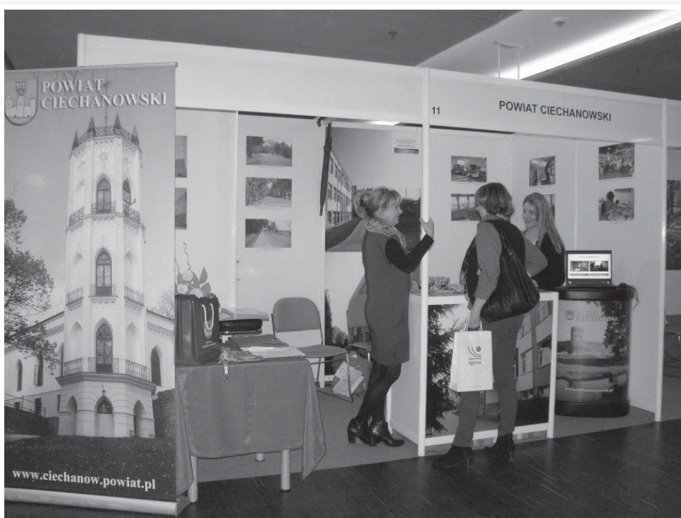
Jedno ze stoisk przygotowali pracownicy Starostwa Powiatowego w Ciechanowie oraz Specjalnego Ośrodka Szkolno-Wychowawczego

Zwiedzający mogli obejrzeć fotografie i otrzymać informacje o inwestycjach: rozbudowie Specjalnego Ośrodka Szkolno-Wychowawczego w Ciechanowie, modernizacji dróg powiatowych, modernizacji krytej pływalni w DPS „Kombatant” i zakupie sprzętu dla