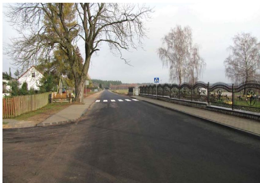
Fragment drogi Ościsłowo-Sulerzyż przebudowanej w ramach Narodowego Programu Przebudowy Dróg Lokalnych

W ten sposób powiat ciechanowski będzie mógł zamknąć cykl inwestycji drogowych na tzw. południowo-zachodniej pętli powiatu, łączącej powiaty ciechanowski, mławski i pułtowski. Pętla prowadzi drogami przez miejscowości: Gąsocin