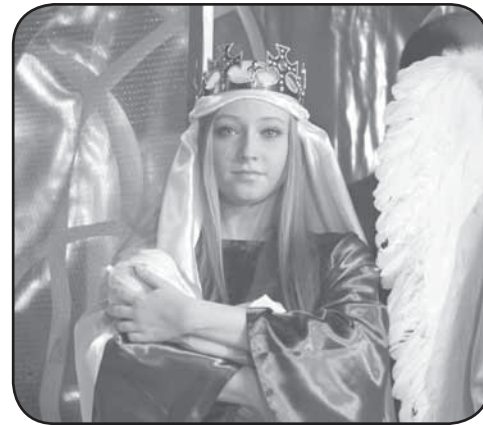
Kadr z Betlejem Polskiego podczas Gali Noworoczej 2014

Przypomnijmy, iż stypendystami byli w ubiegłych latach młodzi tancerze, wokaliści, muzycy klasyczni, plastycy.