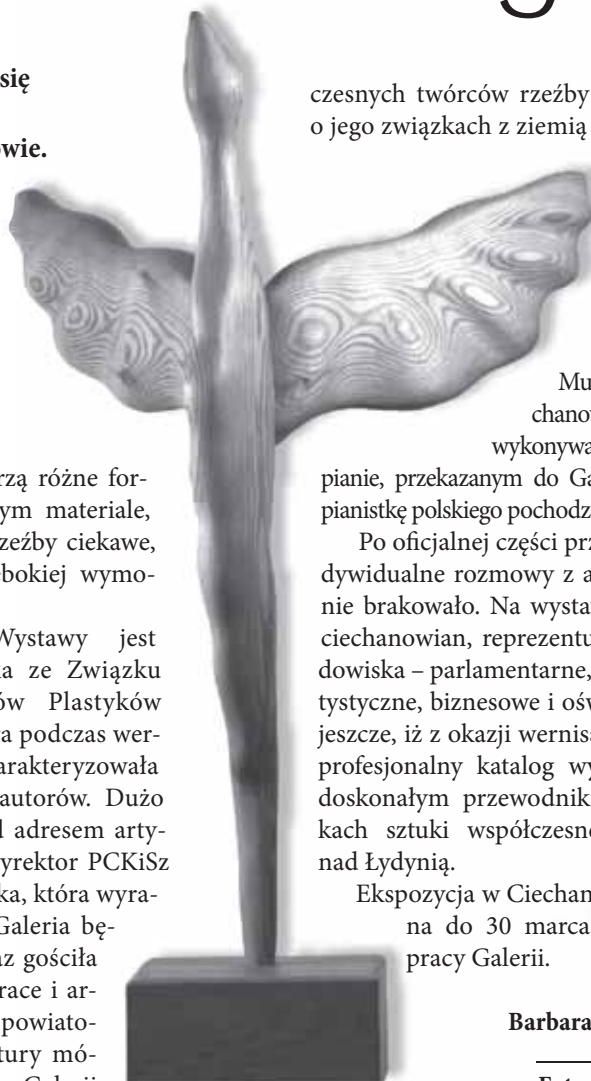
Lapiący marzenia - praca M. Brzozowskiego

Fotoreportaż z otwarcia wystawy prezentujemy na str. 10