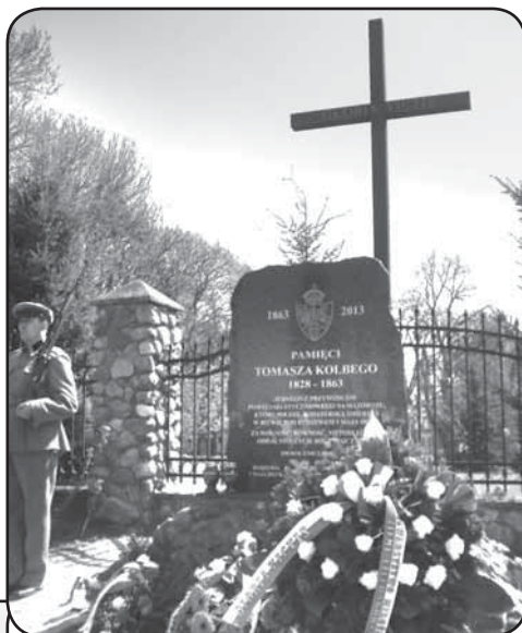
Tablica upamiętniająca wydarzenia 1863 roku pod Rydzewem, maj 2013 r.

Pomnik upamiętniający jednego z najdzielniejszych przywódców powstania