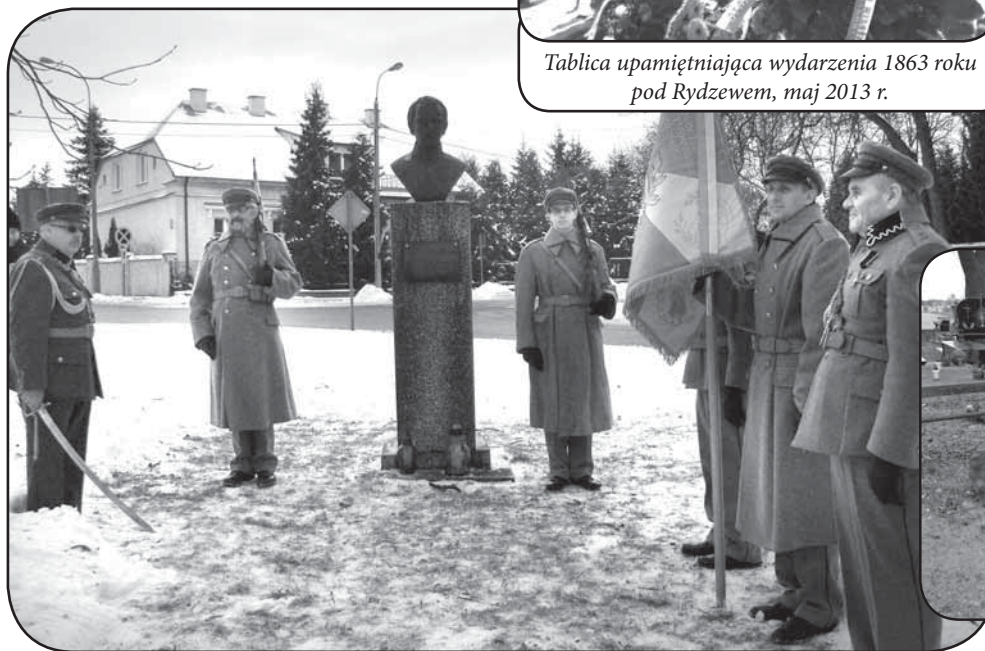
Popiersie poświęcone T. Kolbe w Ciechanowie, styczeń 2014 r.