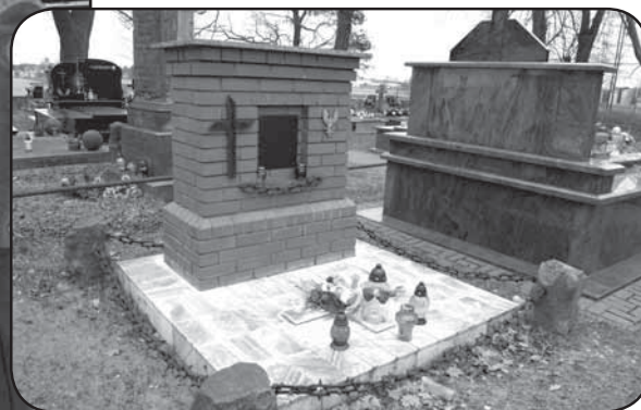
Grób naczelnika na cmentarzu w Unierzyżu, gdzie został pochowany, styczeń 2013 r.

Oddział Tomasza Kolbego stacjonował pod Rydzewem na początku maja 1863 roku. Tu dopadli go Moskale, naprowadzeni prawdopodobnie przez niemieckiego kolonistę z Ojrzenia. Na tym skrawku mazowieckiej ziemi rozegrała się bitwa, którą nazwano po latach plockimi (czyt. mazowieckimi) Termopilami. Oddział Moskali (600 piechurów i 250 jeźdźców) natarł z trzech stron, pozostawiając jedynie otwartą drogę na rozliczne mokradła w tej okolicy. Tomasz Kolbe dopuścił Rosjan na odległość 100 metrów i doszło do obstrzału. Kilkunastu żołnierzy rosyjskiego dowódcy Wałujewa padło, ale przewaga Rosjan i tak była duża. Powstańcy Kolbego toczyli heroiczny bój przez dwie i pół godziny, ostrzeliwując Rosjan, aby choć część oddziału mogła przedrzeć się przez bagna rzeczki Rosicy. Rzeczywiście, jedna grupa powstańców przebiła się przez Kozaków i uszła na mokradła. Z osiemnastu żołnierzy Kolbego przeżył