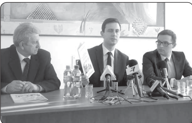
Wizyta ministra w Ciechanowie