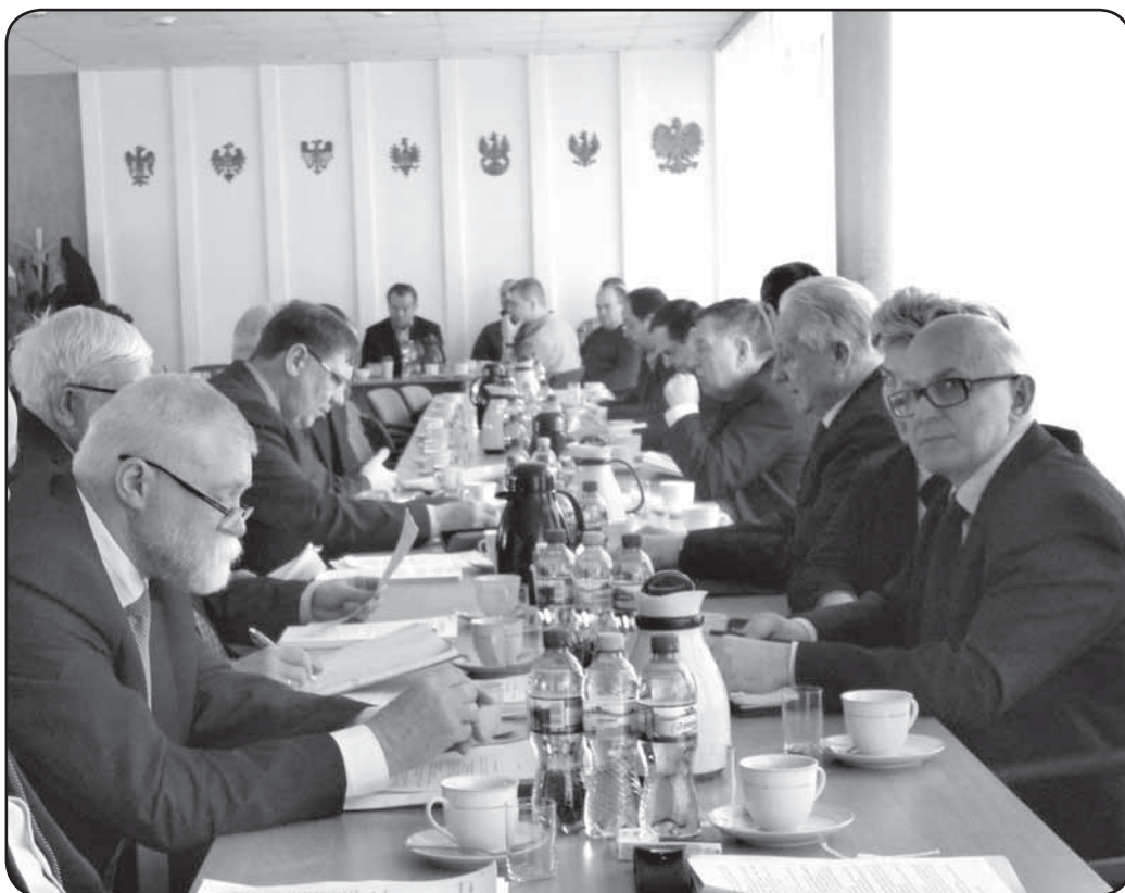
Radni powiatowi przyjęli zaproponowane uchwały jednomyślnie

Kalendarz imprez zapowiadanych przez obie jednostki jest bardzo duży. Znajdą się w nim imprezy stałe, cykliczne, organizowane każdego roku, ale również nowości tematyczne, np. związane z obchodami Roku Oskara Kolberga i innych rocznic.