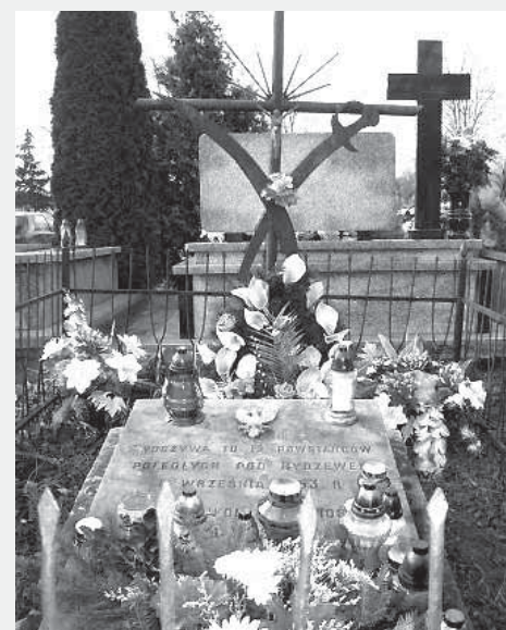
Grób powstańców styczniowych na cmentarzu w Sulerzyżu, listopad 2013 r.

Śmierć Kolbego i Padlewskiego oraz kolejne krwawe bitwy z Rosjanami miały duży wpływ na przebieg powstania styczniowego na północnym Mazowszu. Kolejny patriotyczny zryw powoli wygasł, w domach na czarno ubrane kobiety oplakiwały śmierć swoich mężów, synów i braci. Zagubione w lasach domostwa, dwory i majątki ziemskie spowijając będzie jeszcze długo ból, rozpacz i zawód, że taka potężna danina krwi okazała się jeszcze zbyt małą. Mgła przygnębienia podniesie się dopiero za kilkadziesiąt lat, w XX wieku.