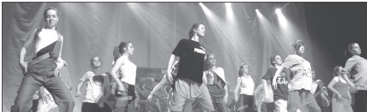
Fragment spektaklu „Młodzi, gniewni, pozytywni”