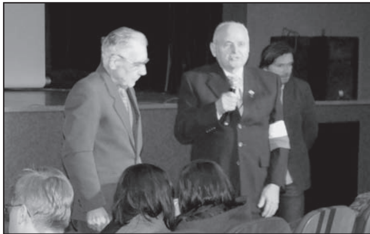
Spotkanie w Powiatowym Centrum Kultury i Sztuki poświęcone było Żołnierzom Wyklętym