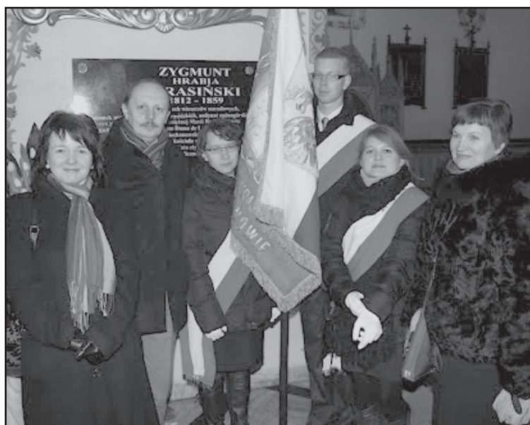
Poczet sztandarowy I LO podczas uroczystości w Kościele Farnym w Ciechanowie

Mimo że Tydzień Patrona dobiegł końca, planowane są kolejne przedsięwzięcia związane z podwójną rocznicą. W Liceum odbędzie się konkurs literacki i plastyczny dla uczniów gimnazjów i szkół ponadgimnazjalnych – „W romantycznym duchu”. Organizowany jest rajd rowerowy szlakiem Krasinińskich. Młodzież pracuje nad muzycznymi adaptacjami poezji Zygmunta Krasinińskiego i wydaniem płyty. W czerwcu odbędzie się XIII Zjazd Koleżeński Absolwentów Krasiniaka, ukaże się również broszura okolicznościowa z okazji stulecia szkoły pt.: „Krasiniak XXI wieku”. Na grudzień planowane jest wydanie kalendarza na 2013 rok poświęconego jubileuszowi. Oficjalnym zakończeniem obchodów stanie się wmurowanie tablicy pamiątkowej upamiętniającej stulecie szkoły.