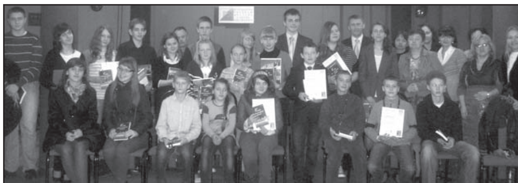
Wszyscy uczestnicy konkursu Wiedzy o Regionie „Ciechanów i okolice”