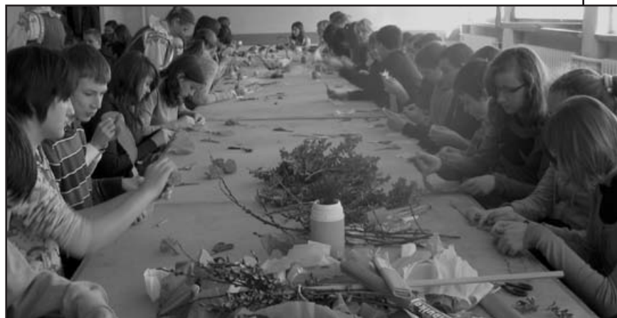
W pracowniach plastycznych PCKiSz prowadzone są zajęcia dla dzieci i młodzieży, które cieszą się dużym powodzeniem