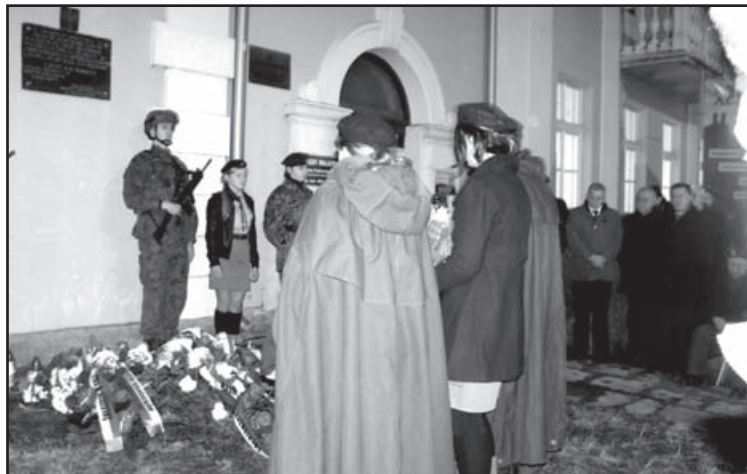
Pod tablicą na budynku byłej siedziby Powiatowego Urzędu Bezpieczeństwa Publicznego złożono wiązanki kwiatów