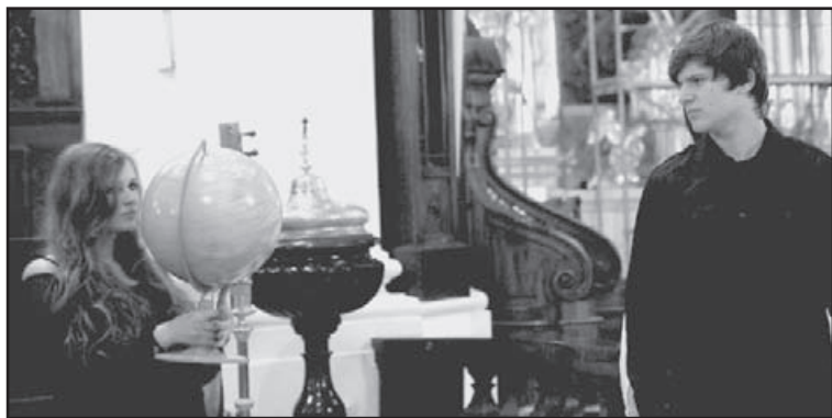
Jedna z symbolicznych scen inscenizacji „Roku Pańskiego”