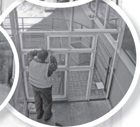
Prace przygotowawcze do montażu windy