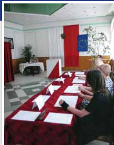
Komisja wyborcza w DPS „Kombatant”

GAZETA SAMORZĄDOWA POWIATU CIECHANOWSKIEGO