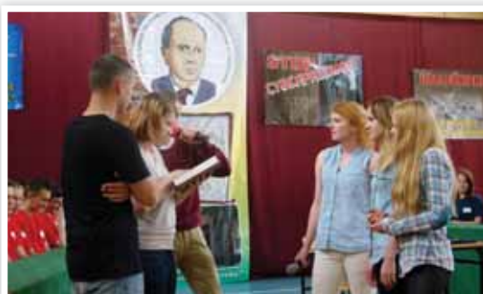
Młodzież z ZST przygotowała scenki, w których prezentowali jak rodzi się przemoc i jakie skutki wywołuje u ofiary

Cyberprzemoc - pojęcie nieco kosmiczne. Co kryje się pod tym zjawiskiem? O tym oraz o problemie uzależnień od komputera i telefonu komórkowego, debatowali 28 maja br. w Ciechanowie, w Zespole Szkół Technicznych uczniowie ze szkół podstawowych i gimnazjalnych z powiatu ciechanowskiego. Debatę poprzedziły dyskusje w klasach. Przeprowadzony został również konkurs plastyczny, a zwycięzcy zostali nagrodzeni. To wszystko dzięki współpracy powiatu ciechanowskiego i ZST z Wojewódzkim Kuratorem Oświaty w ramach programu „Dziecko bezpieczne w Rodzinie i Szkole”, w którym jako jedyna z regionu uczestniczy ta szkoła.