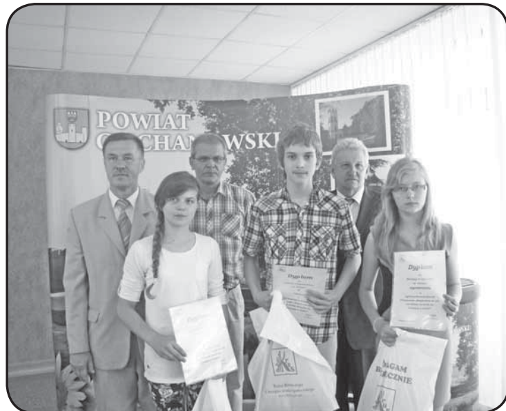
Pamiątkowe fotografie laureaci wykonali z przedstawicielami KRUS oraz władzami samorządowymi powiatu ciechanowskiego