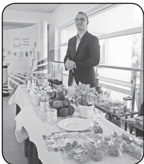
Prezentację zdrowej żywności przygotował jeden z dostawców, biorących udział w programie