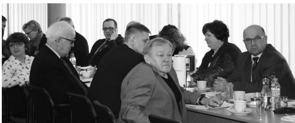
Radni Powiatu Ciechanowskiego podczas sesji

Miłym akcentem podczas kwietniowej sesji było wręczenie czworgu uczniom I LO im.