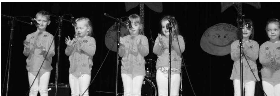
Najmłodsi wykonawcy zachwycili publiczność festiwalową żywiołowymi występami na scenie

przedszkola: I miejsce zajęło Przedszkole nr 5 w Ciechanowie, II miejsce Przedszkole nr 10 w Ciechanowie, III miejsce Przedszkole w Gołotczyźnie; w kategorii szkoły podstawowe: I miejsce powędrowało do Szkoły Podstawowej STO w Ciechanowie, II miejsce zajęła Szkoła Podstawowa w Ojrzeniu, a III miejsce Szkoła Podstawowa Gąsocinie; w kategorii gimnazja: I miejsce Gimnazjum TWP w Ciechanowie, II