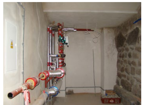
Wygląd pomieszczeń budynku po zakończeniu drugiego etapu remontu