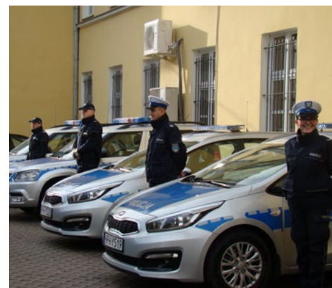
Nowe samochody dla policji przekazane przez samorząd powiatowy i miejski