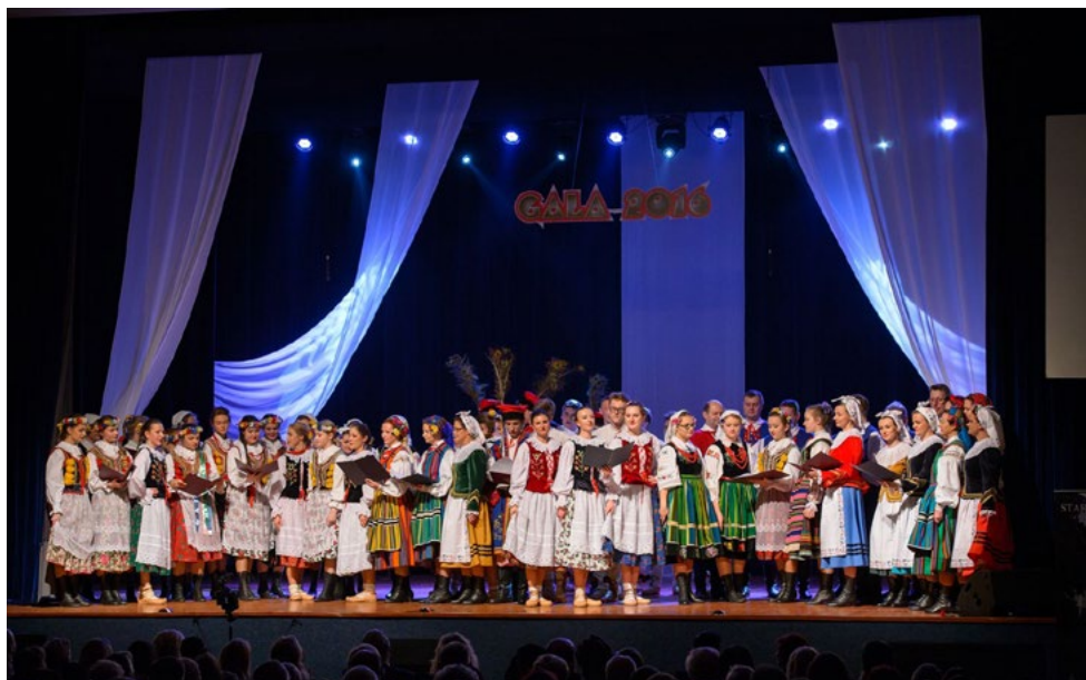
Występ Ludowego Zespołu Artystycznego „Ciechanów” podczas Koncertu Noworocznego Gala 2016

Czternasty zjazd wychowanków Gimnazjum i Liceum im. Zygmunta Krasińskiego w Ciechanowie odbywać się będzie od 24 do 26 czerwca 2016 r. w Ciechanowie. Będzie okazją do spotkania się po latach z koleżankami, kolegami, nauczycielami, ale również do odwiedzenia Ciechanowa, Opinogóry, czy Gołotczyzny. Na gościnnej ziemi ciechanowskiej spotkają się absolwenci różnych roczników. Zjazd rozpocznie się w piątek 24 czerwca, o godz. 11.00 w szkole przy ul. 17 Stycznia i będzie miał formę pikniku. Następnego dnia – w sobotę – o godz. 11.00 odprawiona zostanie msza św. w „Klasztorcu”, po niej odbędą się spotkania towarzyskie i bal absolwentów. Niedziela będzie dniem spacerów po Ciechanowie, spotkań towarzyskich oraz zapoznania się ze zmianami, które zachodzą na terenie powiatu.