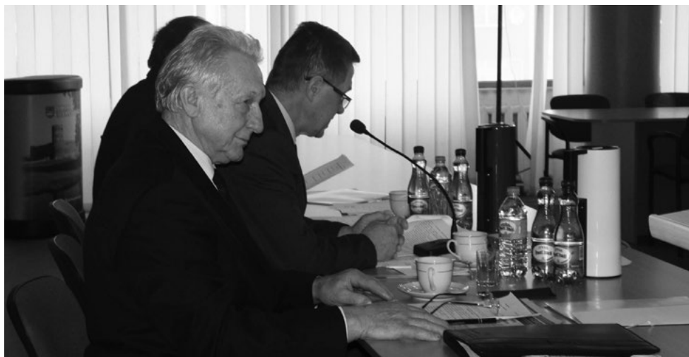
Prezydium Rady Powiatu

Zygmunta Krasińskiego w Ciechanowie nagród i dyplomów za uzyskanie bardzo dobrych wyników podczas olimpiad przedmiotowych (piszemy o tym na str. 5).