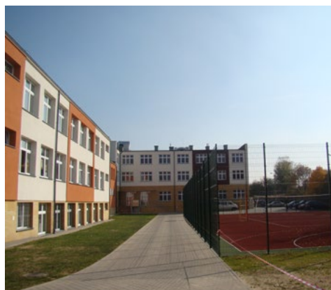
Specjalny Ośrodek Szkolno-Wychowawczy po rozbudowie i modernizacji