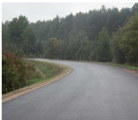
Jedna z dróg powiatowych zmodernizowanych przez samorząd