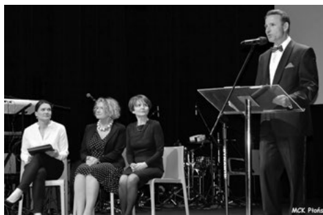
Koncert inaugurujący Międzynarodowe Dni ks. M.K. Sarbiewskiego w Płońsku