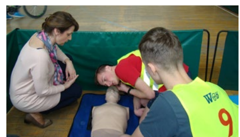
Do pokonania było wiele nietatwych przeszkód, z którymi uczniowie dobrze sobie radzili