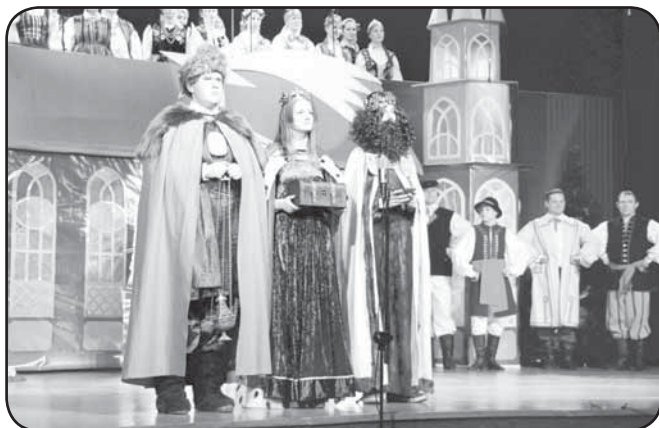
Występ młodych artystów z teatru Rozmyty Kontrast podczas Koncertu Noworocznego Gala 2014