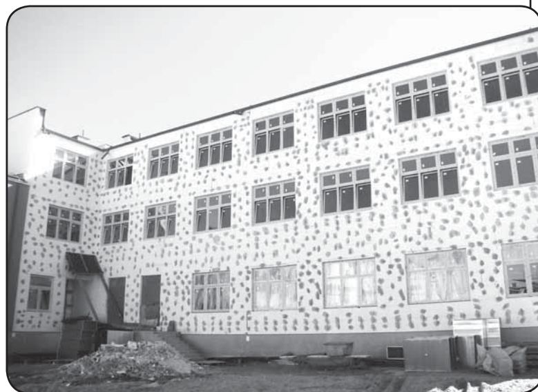
Budynek nowego internatu SOSW z zewnątrz

– Przy tak dużej inwestycji budowlanej staramy się tak wykonywać prace, aby nasi uczniowie nie odczuli dyskomfortu i hałasu. Wykonawca tak planuje prace, aby nie kolidowały one z lekcjami lub czasem wypoczynku dzieci – zapewniła nas pani dyrektor.