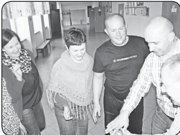
Ćwiczenia warsztatowe najlepiej sprawdzają się podczas szkoleń, nie są nudne i pozwalają uczestnikom wypracować wspólnie wnioski

Drugi atut dotyczy tematyki szkolenia. Wdług nauczycieli, projekt spełnia oczekiwania szkoły całościowo. Najpierw podczas dyskusji nauczyciele określili potrzeby szkoły, a później podczas ćwiczeń wypracowują sposoby ich rozwiązywania. Podczas dyskusji regimińskich nauczycieli ujawniły się potrzeby umiejętności pracy w grupie - warsztat „Efektywne organizowanie pracy zespołów nauczycielskich” oraz „Wykorzystanie technologii informacyjnej na lekcjach”.