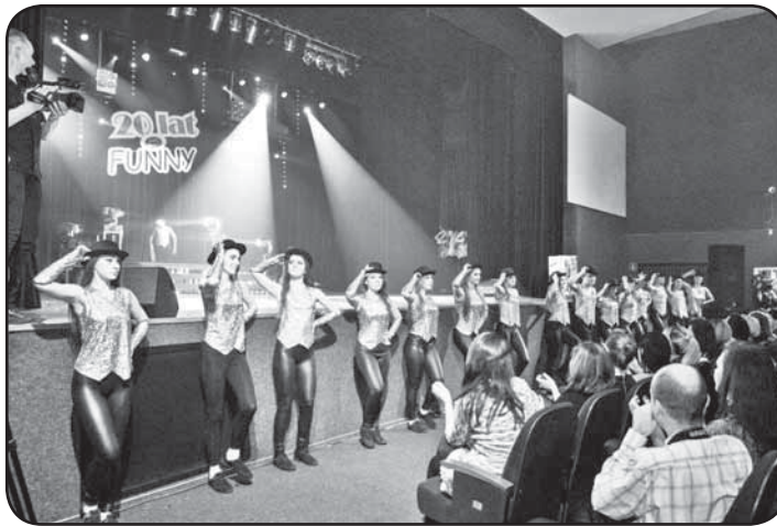
Jubileuszowy koncert galowy obfitował w wiele ciekawych prezentacji tanecznych, które wzbudzały zachwyt publiczności

Przez 20 lat istnienia grupy, przewinęło się przez nią ok. 3,5 tys. młodych ludzi, w wieku od 6 do 18 lat. Wielu z dawnych tancerzy podziwiał występ swoich młodszych kolegów, a wśród nich piosenkarka Dorota Rabczewska, która swoją