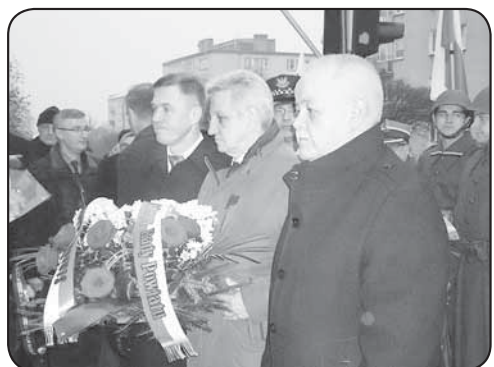
Apel poległych pod tablicą upamiętniającą pomordowanych działaczy podziemia