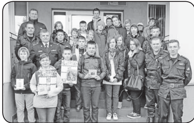
Uczestnicy turnieju oraz strażacy z KP PSP przed budynkiem straży w Ciechanowie

Organizatorem konkursu jest Zarząd Główny Związku Ochotniczych Straży Pożarnych Rzeczypospolitej Polskiej oraz Komenda Główna Państwowej Straży Pożarnej. Etapy poszczególnych eliminacji obejmują: szczebel środowiskowy, gminny,