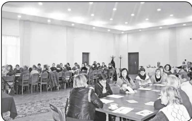
Foto: Przebieg spotkania informacyjnego w Opinogórze

Łączna wartość otrzymanego przez Powiat Ciechanowski dofinansowania na realizację projektu wynosi 19 992 281,10 zł.