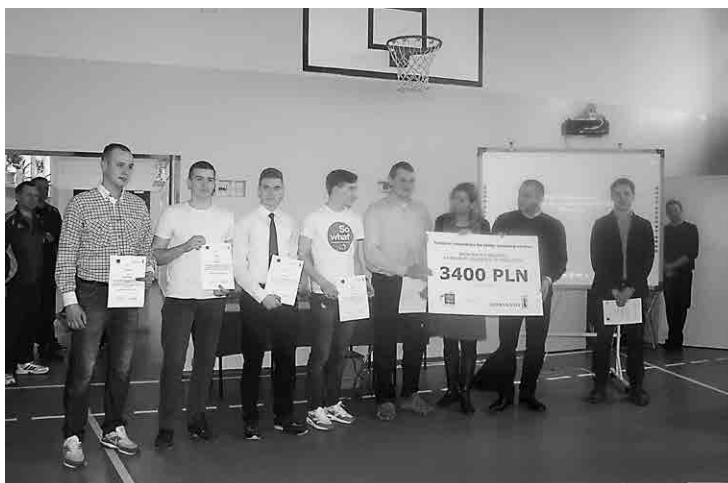
Moment wręczenia nagrody zwycięzkiemu zespołowi