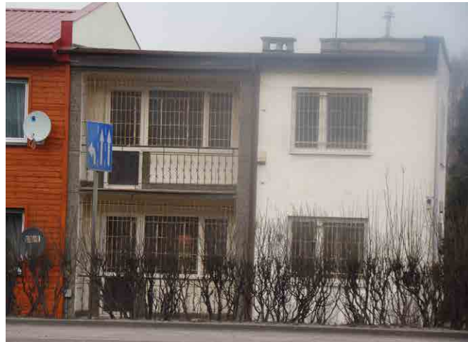
Obecny wygląd budynku, znajdującego się naprzeciwko Starostwa Powiatowego w Ciechanowie. Nadaje się on do generalnego remontu

Komenda Wojewódzka Policji w Radomiu złożyła wniosek (9 sierpnia 2010 roku) o wygaszenie prawa trwałego zarządu z uwagi na zły stan techniczny budynków. Wydziały, które znajdowały się w tym obiekcie zostały przeniesione w inne miejsce, a Stacja Obsługi Pojazdów została zlikwidowana. 9 lipca 2010 roku, na wygaszenie trwałego zarządu na nieruchomości zgodę wyraził Wojewoda Mazowiecki.