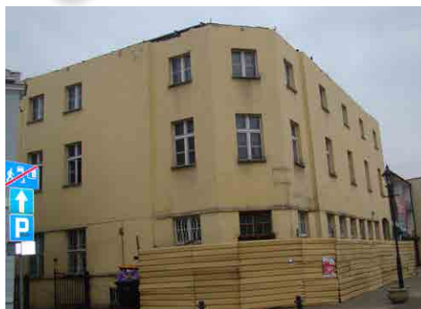
Prace remontowe budynku wchodzą w fazę wzmocnienia fundamentów. Na takiej bazie będzie można wykonać wszystkie pozostałe roboty

Sprzyjająca pogoda pozwoliła na wznowienie prac remontowych w obiekcie przy ul. Warszawskiej 34, które zostały wstrzymane w ubiegłym roku. Zeszłorocznego planu remontowego nie udało się wykonać, gdyż okazało się, że metoda zastosowana przez projektanta w zakresie wzmocnienia fundamentów budynku dawnego hotelu Polonia nie może zostać zrealizowana przez wykonawcę. Z uwagi na to, że powiat nie uzyskał zgody władz miasta na wejście z pracami w pas drogowy ulicy Warszawskiej i ulicy Pijanowskiego, zaszła konieczność sporządzenia projektu zamiennego w zakresie wzmocnienia fundamentów obiektu, co wymagało zgody projektanta i sporządzenia tego projektu. To z kolei spowodowało, że roboty musiałyby być prowadzone zimą. Inspektor nadzoru stwierdził, że nie jest to możliwe i niewskazane dla inwestycji, zdecydował też o wstrzymaniu robót. W związku z tym podjęto decyzję, że prace polegające na podbiciu fundamentów wznawione zostaną wiosną 2015 roku, w sprzyjających warunkach atmosferycznych.