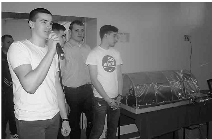
Autorzy projektu prezentują swój wynalazek