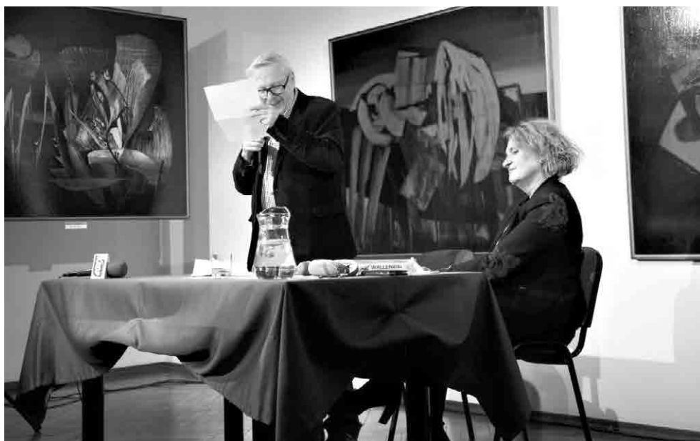
Satyryk prezentował swoje humoreski