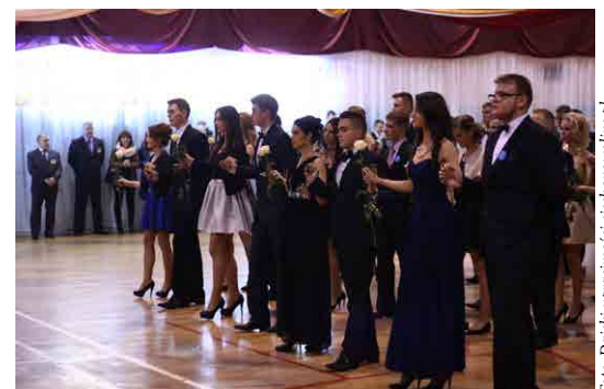
Tak tańczyli Poloneza uczniowie „dwójki”