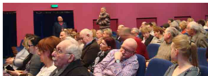
Spotkanie z K. Zanussim w PCKiSz w Ciechanowie