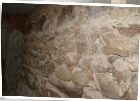
Remont Polonii uwidocznił piękne zabytkowe piwnice budynku