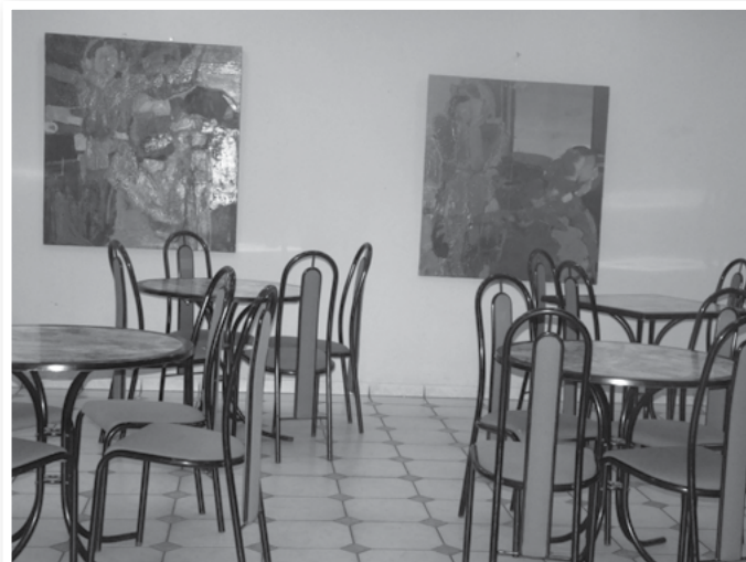
W takim wydaniu Kawiarnia Artystyczna przechodzi już do historii

zyskały nowe betonowe podłoże, następnie nową nawierzchnię, odnowione zostały schody i cokoliki, naprawione i pomalowane balustrady wokół tarasów, wykonane prace blacharskie oraz uporządkowany cały teren.