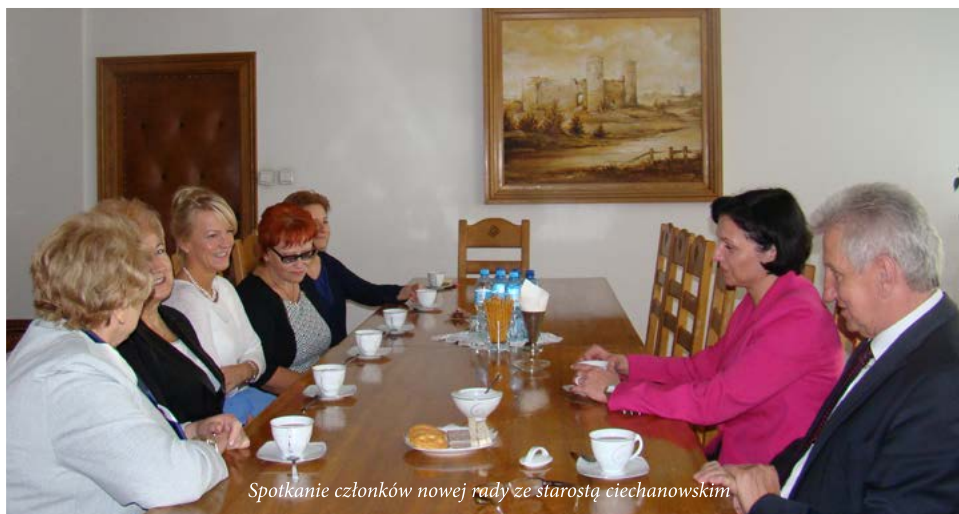
Spotkanie członków nowej rady ze starostą ciechanowskim

Spotkania Rady odbywały się raz na kwartał, a w przypadkach szczególnych były organizowane częściej. Powiatowa Społeczna Rada do Spraw Osób Niepełnosprawnych opiniowała projekty planu rzeczowo-finansowego środków PFRON w latach 2011-2015 i projekty przeprowadzonych zmian w planie rzeczowo-finansowym środków PFRON w latach 2011 -2015. Wydawała opinie dotyczące budżetu powiatu ciechanowskiego pod kątem jego skutków dla osób niepełnosprawnych. Ponadto opiniowała składane projekty przez powiat ciechanowski, w ramach ogłaszanych przez PFRON programów celowych, na dofinansowanie w latach 2012 - 2014 likwidacji barier transportowych oraz na dofinansowanie likwidacji barier architektonicznych w 2013 roku. Łącznie wydano 24 opinie.