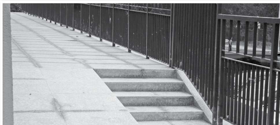
Taras po remoncie