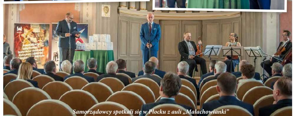
Samorządowcy spotkali się w Płocku z auli „Małachowianki”