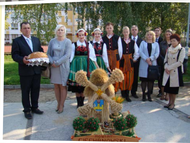
Delegacja powiatu ciechanowskiego w Płocku

muzyki rozrywkowej. W dożynkach wzięła udział delegacja powiatu ciechanowskiego,