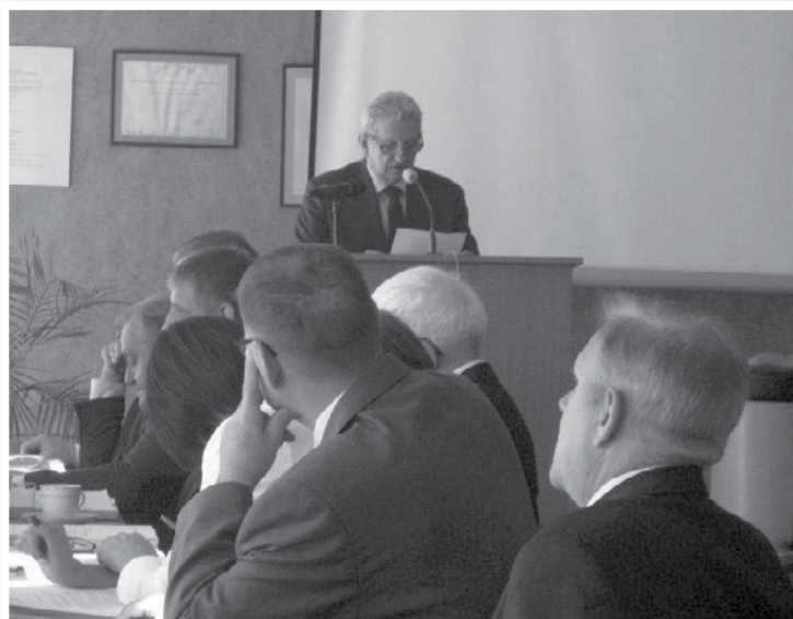
Obrady radnych powiatu ciechanowskiego