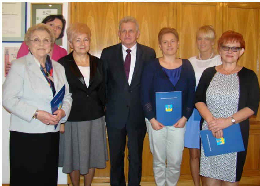
Pamiątkowe zdjęcie członków rady powołanych na kolejną kadencję