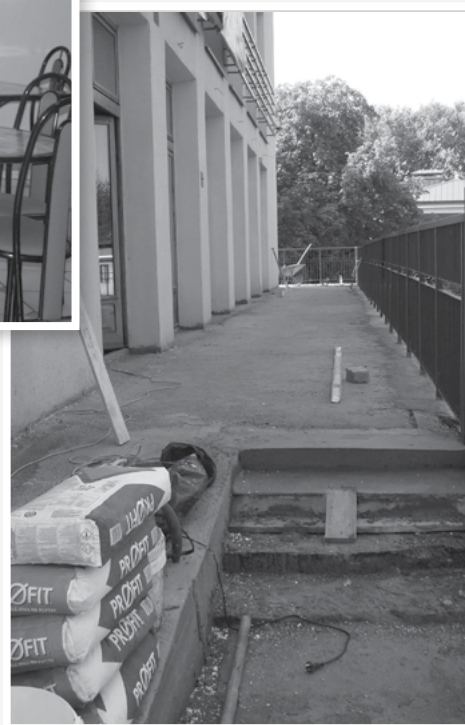
Zużyte tarasy w trakcie remontu