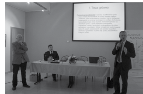
Wyniki badań prezentowali eksperci i goście konferencji: przedstawiciele Ministerstwa Edukacji Narodowej, Mazowieckiej Jednostki Wdrażania Programów Unijnych, Wojewódzkiego Urzędu Pracy, Mazowieckiego Obserwatorium Rynku Pracy, Departamentu Edukacji Publicznej i Sportu z Urzędu Marszałkowskiego Województwa Mazowieckiego