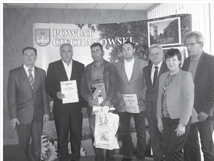
Laureaci konkursów rolniczych, najlepsi maturzyści i cykliści w powiecie ciechanowskim