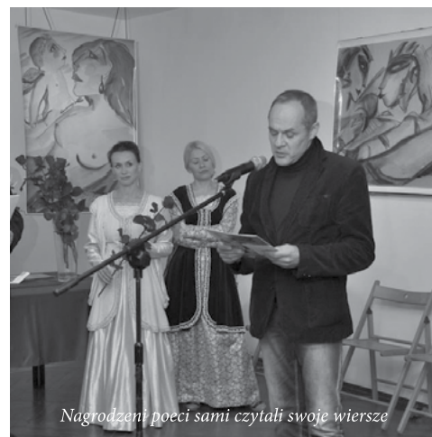
Nagrodzeni poeci sami czytali swoje wiersze

Dzień wcześniej (7 X) pisarze spotkali się z dziećmi, młodzieżą i studentami w szkołach i na uczelniach (o czym piszemy wyżej) oraz wzięli udział w warsztatach