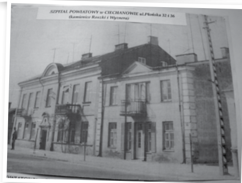
Podwójny jubileusz ciechanowskiego szpitala