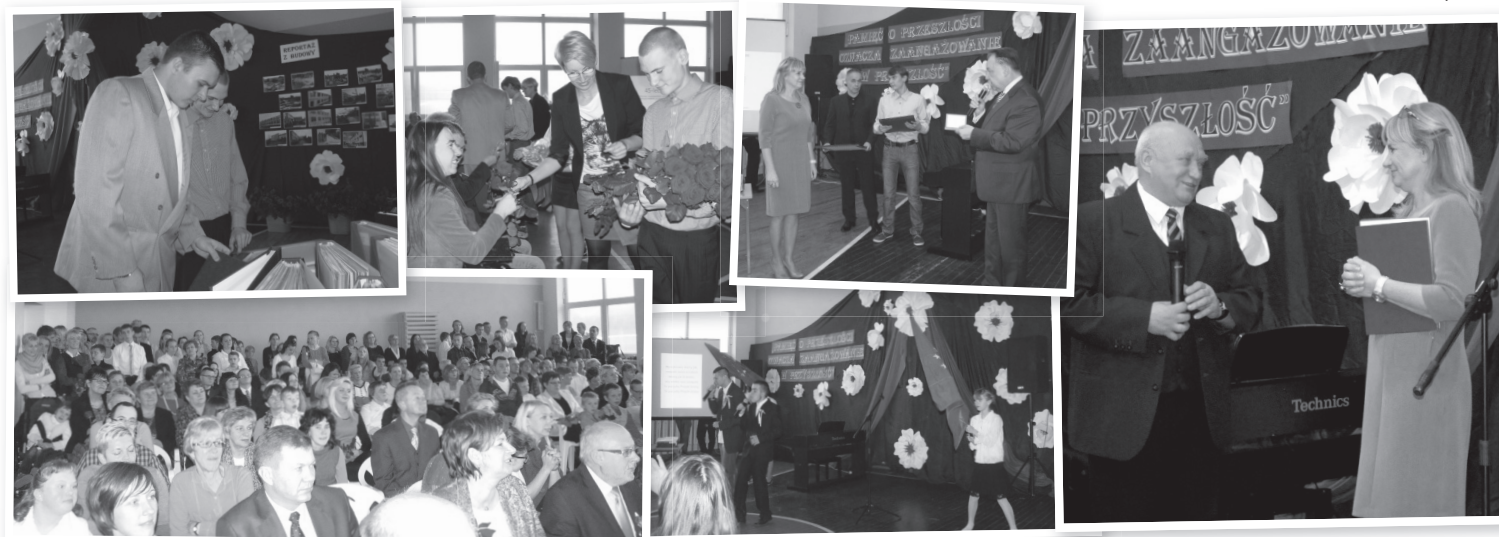
Fotoreportaż z uroczystości jubileuszowej w szkole specjalnej