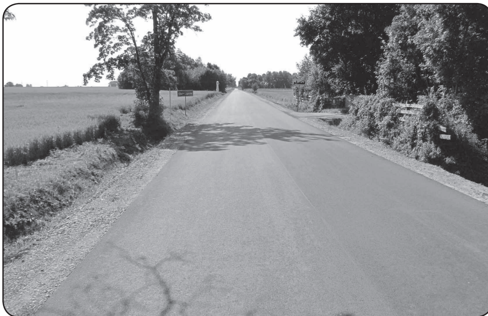
Inny fragment zmodernizowanej drogi Opinogóra – Pałuki