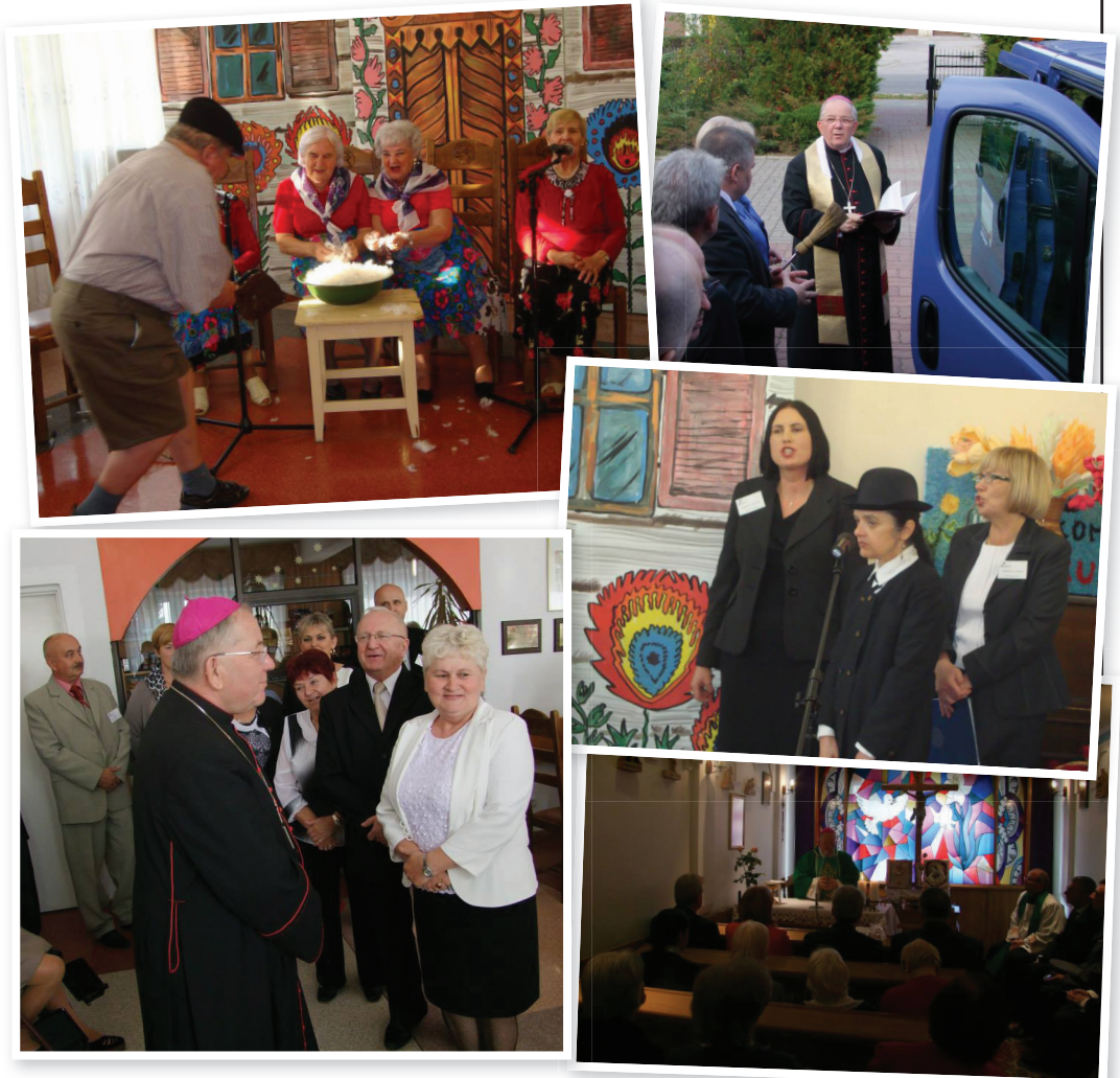
Fotografie z obchodów jubileuszu w DPS „Kombatant”

Jubileusz 20-lecia powstania Domu Pomocy Społecznej „Kombatant” w Ciechanowie, to uroczystość ważna i piękna. Widać było ogromne zaangażowanie w jego przygotowanie, zarówno ze strony dyrekcji, pracowników jak i samych mieszkańców.