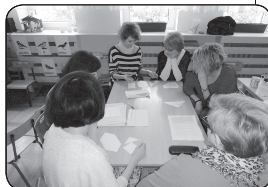
Tak przebiegały szkolenia w placówkach, biorących udział w projekcie