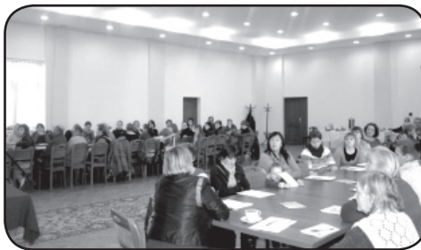
Spotkanie informacyjne nt. projektu w sali Urzędu Gminy w Opinogórze

Opiekuńczo - Wychowawczej Socjalizacyjnej w Gołotczyźnie przy ulicy Ciechanowskiej 17. W jednostkach powiatowych powstało 60 nowoczesnych stanowisk komputerowych. Każda z sal wyposażona jest również w kopiarkę. Stanowiska komputerowe utworzone w Domu Pomocy Społecznej „Kombatant” są dostosowane do potrzeb osób niepełnosprawnych, niedowidzących, niedosłyszących oraz mających trudności w poruszaniu się. Z uwagi na fakt, że budynek Domu Pomocy Społecznej jest pozbawiony barier architektonicznych, każda osoba niepełnosprawna będzie mogła korzystać z komputera i Internetu.