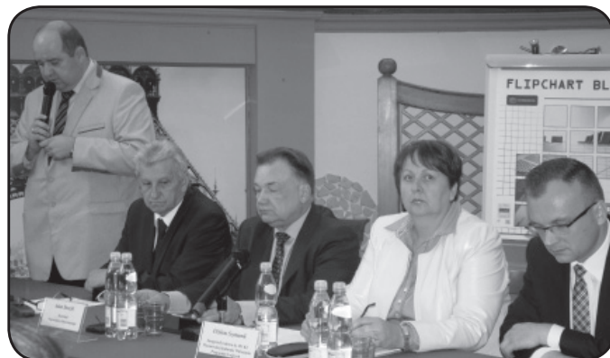
Goście ciechanowskiej konferencji PROW

Gliniojeck będzie z następnych programów wsparcia aplikować o fundusze na zagospodarowanie rzeki Wkry oraz stworzenie bazy rekreacyjno-sportowej. Projekt zakłada pogłębienie koryta rzeki, budowę ścieżek rowerowych, uruchomienie kąpieliska na Wkrze oraz utworzenie bazy ze sprzętem wodnym.