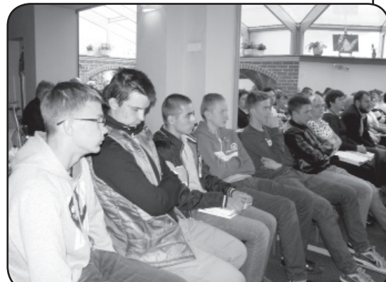
Uczestnicy konferencji poświęconej wykorzystaniu środków unijnych