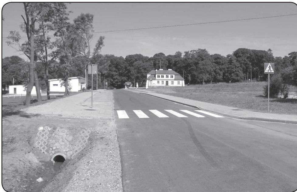
Droga Opinogóra – Pałuki w Opinogórze