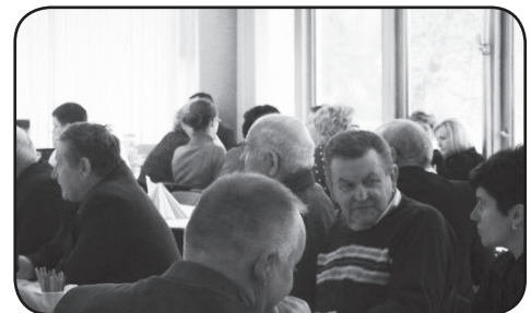
Spotkanie inauguracyjne projekt w Ciechanowie

- gmina Regimin: w budynkach Szkoły Podstawowej w Szulmierzu i Szkoły Podstawowej w Zeńboku,