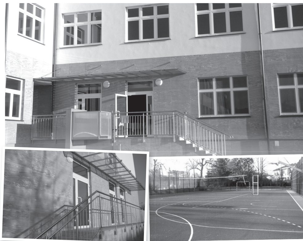
Nowy internat i otoczenie ośrodka

Uroczystości towarzyszyły występy młodzieży ze szkoły specjalnej, która brawurowo wykonała wiązkę piosenek mówiących o życiu szkoły oraz koncert uczniów z Państwowej Szkoły Muzycznej I st. w Ciechanowie. Były kwiaty i małe podarunki, wykonane przez uczniów szkoły.