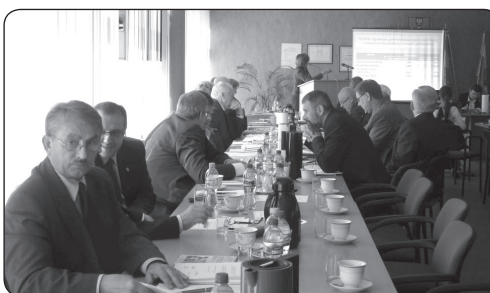
Radni podczas wrześniowej sesji Rady Powiatu