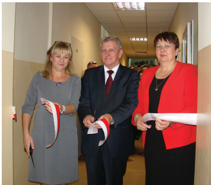
Moment przecięcia wstęgi do nowego internatu SOSW

Jubileusz 45-lecia Specjalnego Ośrodka Szkolno-Wychowawczego w Ciechanowie, połączony z otwarciem nowego internatu, odbył się w środowe popołudnie 29 października w placówce przy ul. Sienkiewicza. To ważny dzień w życiu szkoły, gdyż oddanie do użytku nowego budynku znacznie poprawiło warunki mieszkaniowe uczniów. Poprawią się też warunki nauczania w szkole, gdyż odzyskane pokoje internatowe (teraz są nimi pokoje w budynku szkoły) będą przeznaczone na klasy.