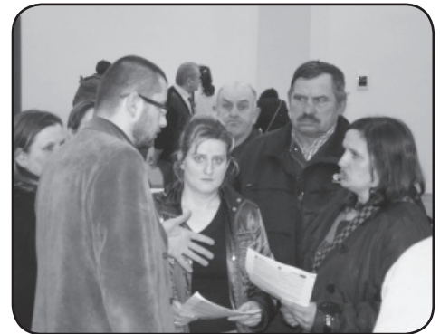
Projekt cieszył się dużym zainteresowaniem ze strony mieszkańców. Pracownicy starostwa informujący mieszkańców w poszczególnych gminach powiatu o zasadach uczestnictwa w projekcie