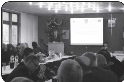
Spotkanie inauguracyjne projekt w Starostwie Powiatowym w Ciechanowie