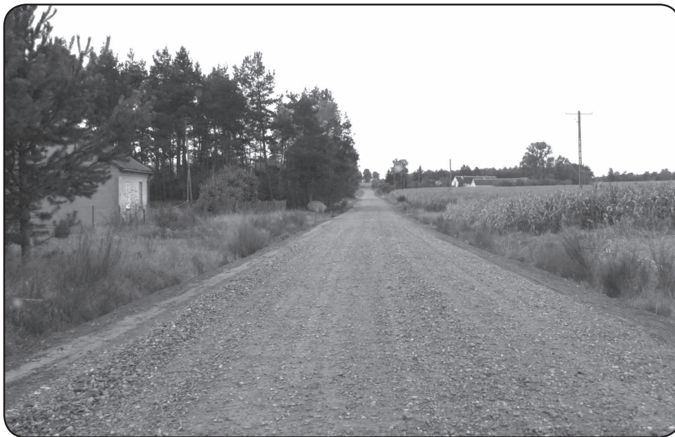
Droga Gołtaczyna-Zawady-Nowe Miasto