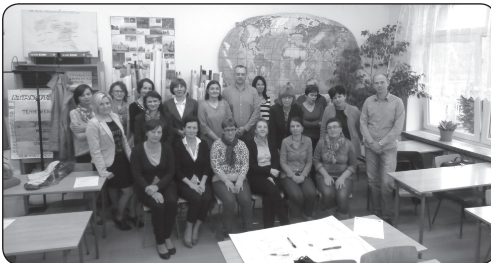
Jedna z grup szkolących się nauczycieli w ZS nr 3 w Ciechanowie

Powiat Ciechanowski z powodzeniem zakończył realizację pełnego cyklu doskonalenia. Przeprowadzono 1170 godzin warsztatów szkoleniowych, 400 godzin konsultacji grupo-