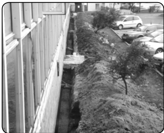
Fundamenty piwnic budynku w czasie remontu