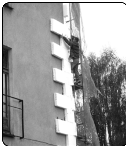
Odnowiona elewacja zmieni wizerunek budynku placówki kultury, nieremontowanej od momentu powstania obiektu