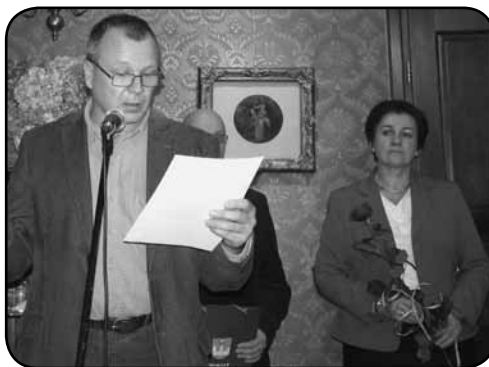
Poeci, nagrodzeni w konkursie „O Laur Opina”, sami czytali swoje dzieła