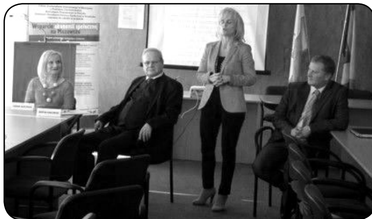
Projekt realizowany jest od 1 lipca 2011 roku przez Zakład Doskonalenia Zawodowego w Warszawie – Centrum Kształcenia w Ciechanowie, w partnerstwie z Powiatem Ciechanowskim, Starostwem Powiatowym w Płońsku oraz Gminnym Ośrodkiem Pomocy Społecznej w Grudusku