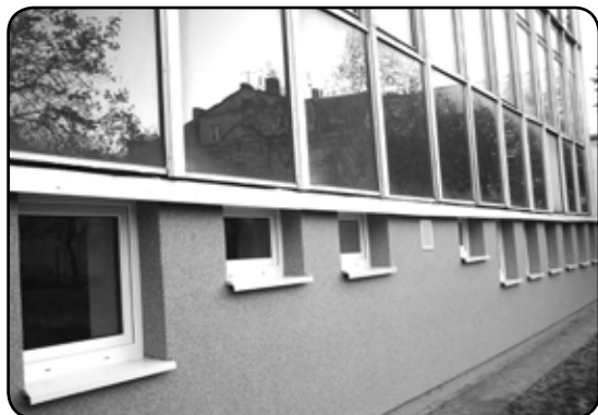
Odnowiona elewacja budynku Starostwa Powiatowego