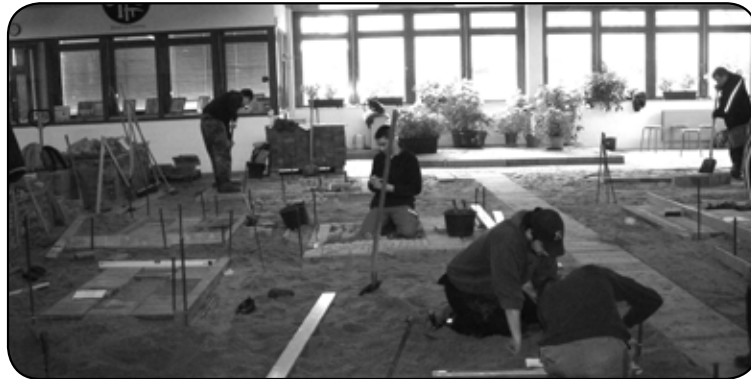
Uczniowie uczą się zawodu podczas praktyk zagranicznych