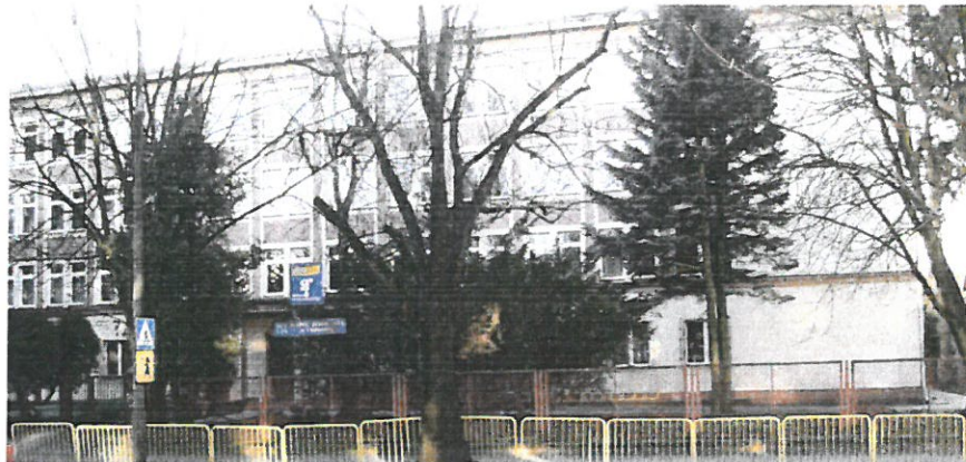
Zdj.nr.2- Elewacja wschodnia(bud.szkoły, łącznik, sala gimnastyczna )