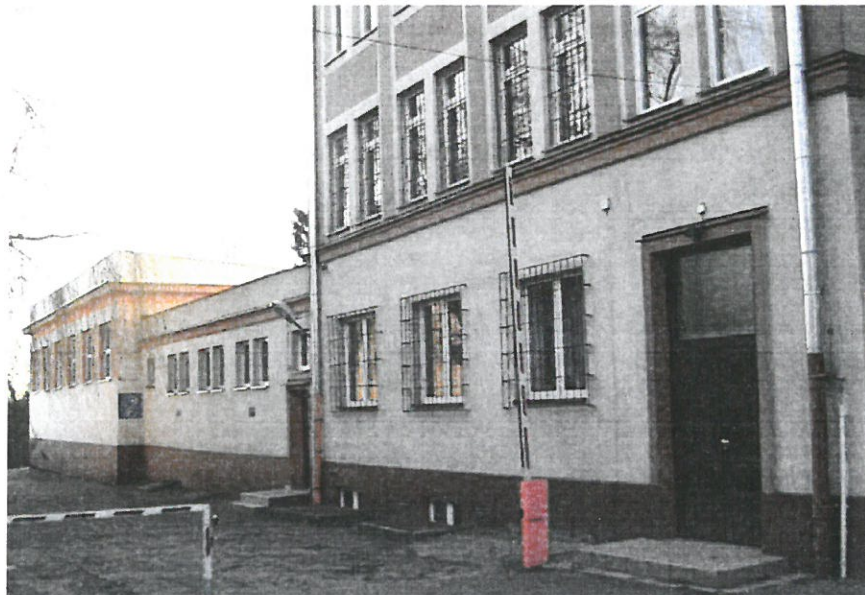
Zdj.nr.3- Elewacja zachodnia od placu apelowego (sala gimnastyczna, łącznik)