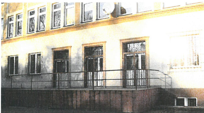
Zdj.nr.8- Kraty studni doświetlających