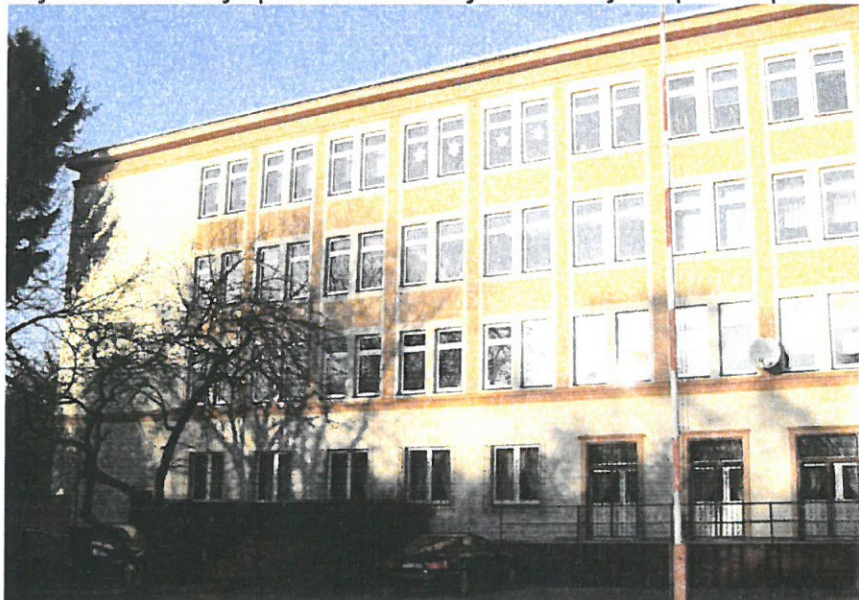
Zdj.nr.5- Elewacja zachodnia- studnie doświetlające w bud.szkoły