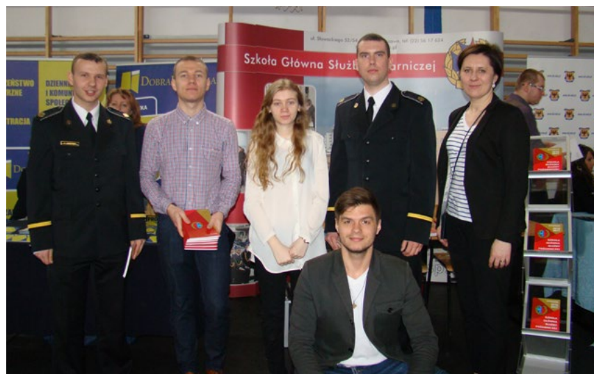
Reprezentanci Szkoły Głównej Służby Pożarniczej zachęcali młodzież z ciechanowskich szkół do nauki w tej prestiżowej uczelni

Impreza jak co roku cieszyła się dużą popularnością wśród młodych ludzi. W ciągu czterech godzin Targów, halę sportową przy ul. 17 Stycznia odwiedziło ponad trzy tysiące osób. Byli to głównie uczniowie, którzy muszą wybrać szkołę ponadgimnazjalną lub uczelnię wyższą, ale również osoby bezrobotne z rejonu, które miały możliwość rozmowy z pośrednikiem pracy i zapoznania się z ofertami pracy. Imprezą towarzyszącą tegorocznej prezentacji edukacyjnej