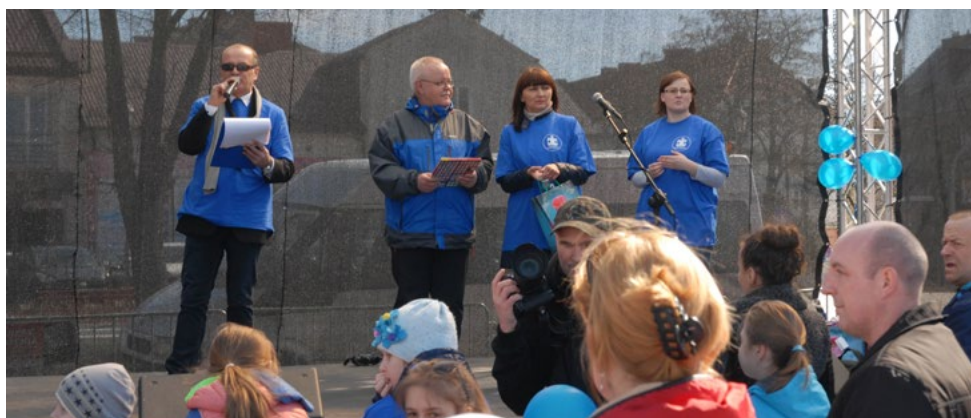
Obchody Dnia Autyzmu w Ciechanowie