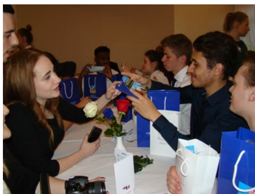
Uczniowie z „Mickiewicza” prezentują francuskim kolegom gadzety związane z powiatem ciechanowskim

i wspólne lekcje językowe oraz spotkania towarzyskie z klasami językowymi i samorządem uczniowskim. Było też coś dla ciała, czyli wyjścia na basen, do siłowni i na zajęcia Nordic Walking oraz rowery. Wieczorem, goście z Francji i ich polscy gospodarze wspólnie śpiewali karaoke.