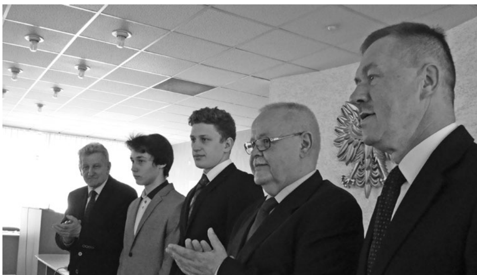
Przebieg marcowej sesji Rady Powiatu

Miłym akcentem marcowej sesji Rady Powiatu