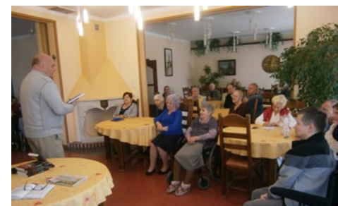
Spotkanie literackie w DPS „Kombatant” w Ciechanowie