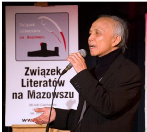
Spotkanie twórców w Kawiarni Artystycznej PCKiSz.