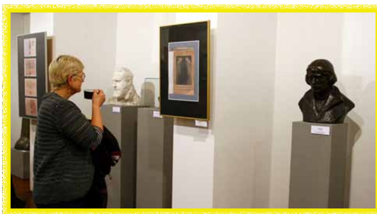
Prace B. Biegasa, wybitnego rzeźbiarza i malarza, mogli oglądać mieszkańcy miasta i regionu

W powiatowej jednostce kultury – Centrum Kultury i Sztuki, w styczniu 2012 roku otwarta została pierwsza w świecie Galeria Sztuki im. Bolesława Biegasa, wybitnego rzeźbiarza, urodzonego w pobliskim Koziczynie. Obecnie planowany jest kapitalny remont budynku PCKiSz.