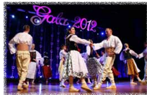
Nasz „towar eksportowy”, czyli Ludowy Zespół Artystyczny Ciechanów podczas występu na Gali 2012

Powiat ciechanowski w 2009 roku nawiązał współpracę partnerską z mołdawskim miastem Causeni, jest współorganizatorem Mazowieckich Spotkań Mediów Lokalnych oraz organizatorem wielu imprez i przedsięwzięć kulturalnych o zasięgu regionalnym. Powiatowa jednostka kultury organizuje każdego roku Koncert Noworoczny Gala, który jest przeglądem osiągnięć kulturalnych na terenie powiatu.