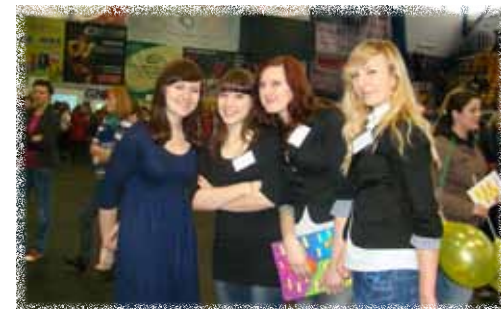
Subregionalne Targi Edukacji i Pracy są doskonałą okazją dla młodzieży do zapoznania się z ofertą edukacyjną szkół i uczelni