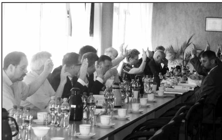
Radni przyjęli wykonanie budżetu za rok 2011

Za udzieleniem absolutorium głosowało 19 radnych, głosów przeciwnych nie było, a jeden radny wstrzymał się od głosu.