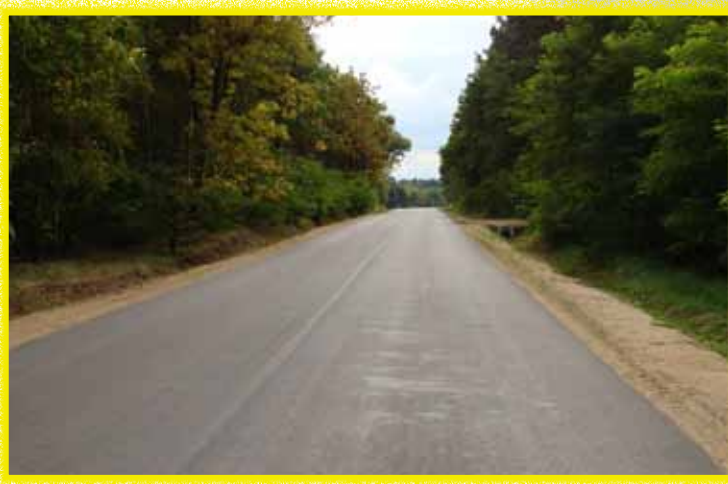
Jedna z dróg Ościslowo-Ojrzeń, przebudowana na terenie powiatu ciechanowskiego

Samorząd powiatowy od kilku lat z powodzeniem realizuje, określoną w „Strategii rozwoju powiatu ciechanowskiego do roku 2020”, politykę inwestycyjną. Jej wymierne efekty dotyczą przede wszystkim modernizacji infrastruktury drogowej, ale także infrastruktury społecznej oraz przedsięwzięć w zakresie systemu ratownictwa.