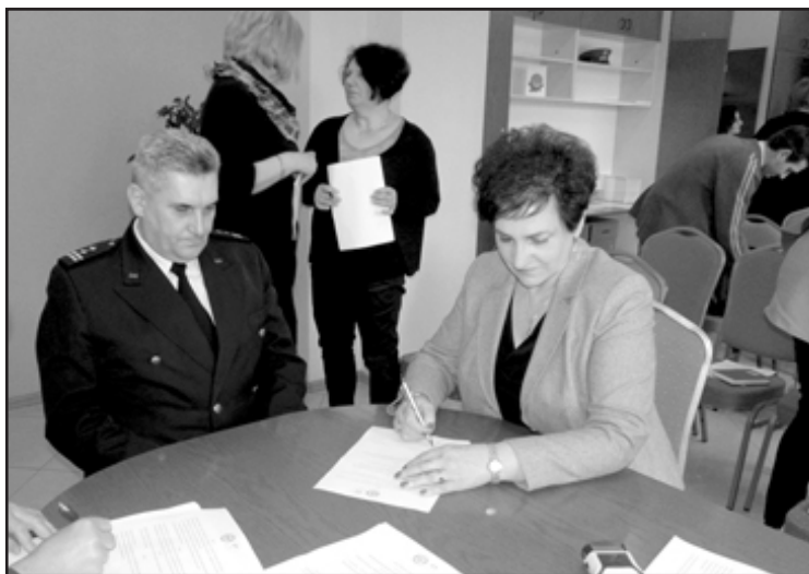
Podpisanie deklaracji wsparcia działań antytytoniowych