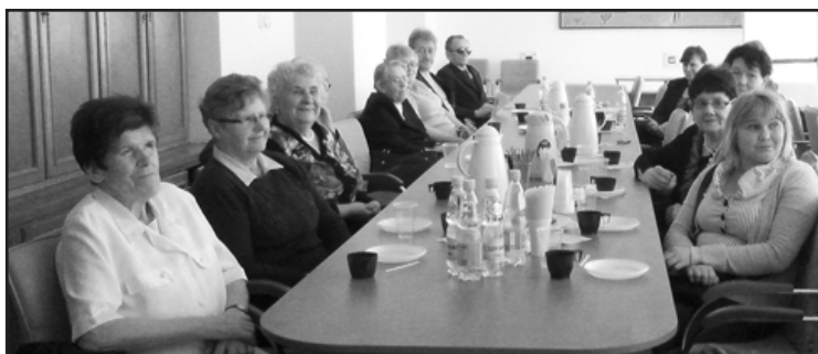
Osoby niewidome i słabowidzące borykają się z wieloma problemami. Wiele z nich można rozwiązać przy dużym wsparciu ze strony samorządów i organizacji pozarządowych