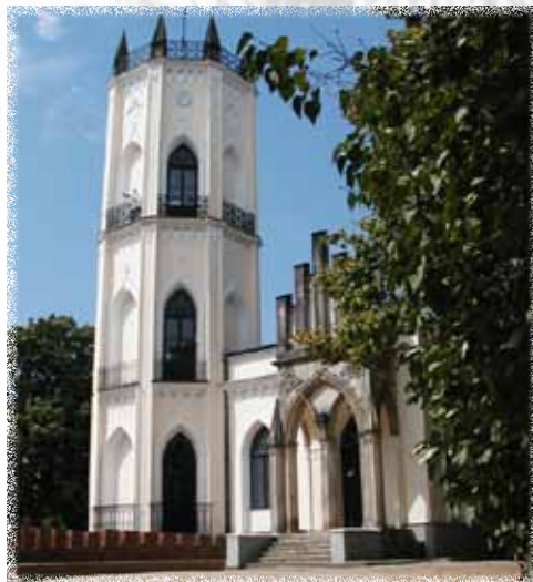
Zameczek Zygmunta Krasieńskiego w Opinogórze

Najcenniejszymi perłami ziemi ciechanowskiej są natomiast: Zespół Pałacowo Parkowy w Opinogórze, z Zameczkiem Zygmunta Krasieńskiego i Dworem Krasieńskich. W podziemiach miejscowego kościoła spoczywają doczesne szczątki wieszca Zygmunta Krasieńskiego oraz jego ojca Wincentego – dowódcy Szwoleżerów Gwardii Napoleona.