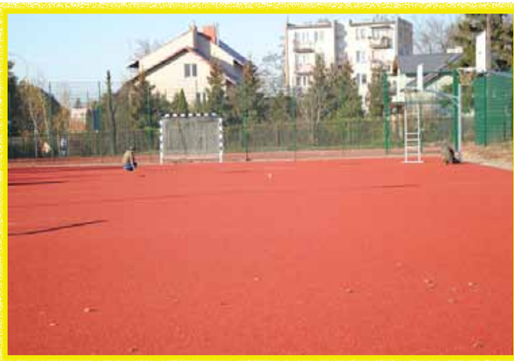
Boisko wielofunkcyjne przy I LO jest nowoczesne i pozwala młodzieży na uprawianie gier zespołowych

W ciągu minionych pięciu lat przebudowano ponad 160 km dróg powiatowych, kilka mostów i innych obiektów drogowych. W Ciechanowie dotyczy to m.in. ulicy Kraszewskiego oraz Mostu 3 Maja, a na obszarze powiatu m.in. dróg z Ciechanowa do Gołotczyzny, do Opinogóry i do Modły oraz drogi Ojrzeń-Gąsocin. Zmodernizowany został basen w Domu Pomocy Społecznej „Kombatant”, a w ramach I etapu prac obejmujących przebudowę boisk przy szkółnych w I Liceum Ogólnokształcącym, wybudowany został nowoczesny kort tenisowy i boisko wielofunkcyjne do gier zespołowych.