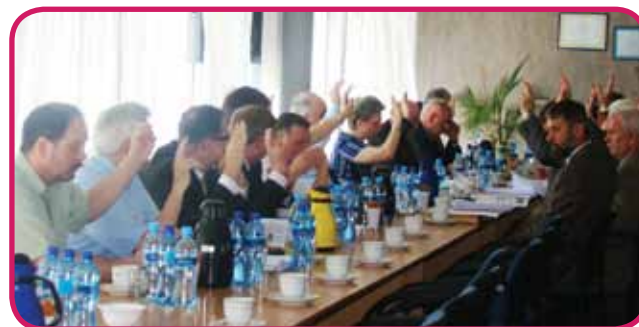
Kwietniowa sesja Rady Powiatu

w miejscowości Młock i Rumoka oraz 2,42 km chodników, m.in. w miejscowościach: Zeńbok, Malużyn, Ojrzeń, Rumoka, Żarnowo. Ponadto pod planowane w następnych latach inwestycje drogowe przygotowano 6 projektów dokumentacji technicznych.