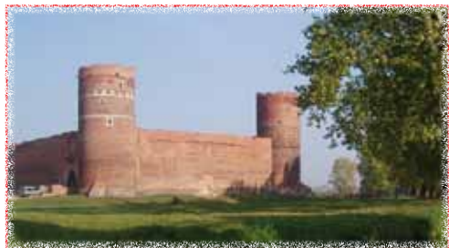
Zamek Książąt Mazowieckich w Ciechanowie

Powiat ciechanowski to walory przyrodniczo – krajobrazowe nad rzekami oraz cenne zabytki dziedzictwa kulturowego, zespoły sakralne, dworki i parki zabytkowe świadczące o przeszłości ziemi ciechanowskiej. Najbardziej znaczącymi zabytkami są w Ciechanowie: gotycki Zamek Książąt Mazowieckich z XIV wieku, neogotycki Ratusz, neogotycka Dzwonnica z 1889 roku, Cukrownia Ciechanów, budynek Komendy Powiatowej Policji, kamienica secesyjna Brudnickich, Grodzisko z X-XI wieku, kościół Fara, kościół Poaugustiański, Muzeum Szlachty Mazowieckiej.