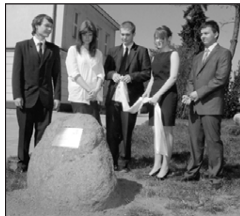
Olimpijczycy z I LO im. Z. Krasinińskiego przy odsłoniętej przez nich tablicy pamiątkowej i dębie „Zygmunt”