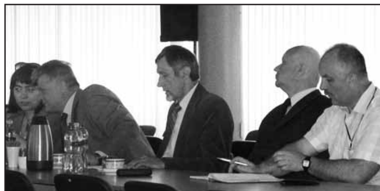
W sesji uczestniczą przedstawiciele gmin powiatu oraz inni zaproszeni goście