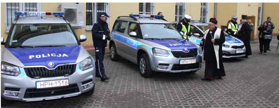
Nowe samochody będą służyły stróżom prawa na terenie powiatu ciechanowskiego

Na drogi Ciechanowa i powiatu, dzięki wsparciu finansowemu samorządów wyjechały trzy nowe radiowozy. Pojazdy zostały sfinansowane w połowie ze środków samorządu powiatowego, samorządu gminy miejskiej Ciechanów oraz samorządu gminy wiejskiej Regimin. To już kolejne radiowozy, które zostały dofinansowane przez lokalne władze. W ubiegłym roku tabor ciechanowskiej policji zasilły 4 nowe radiowozy.