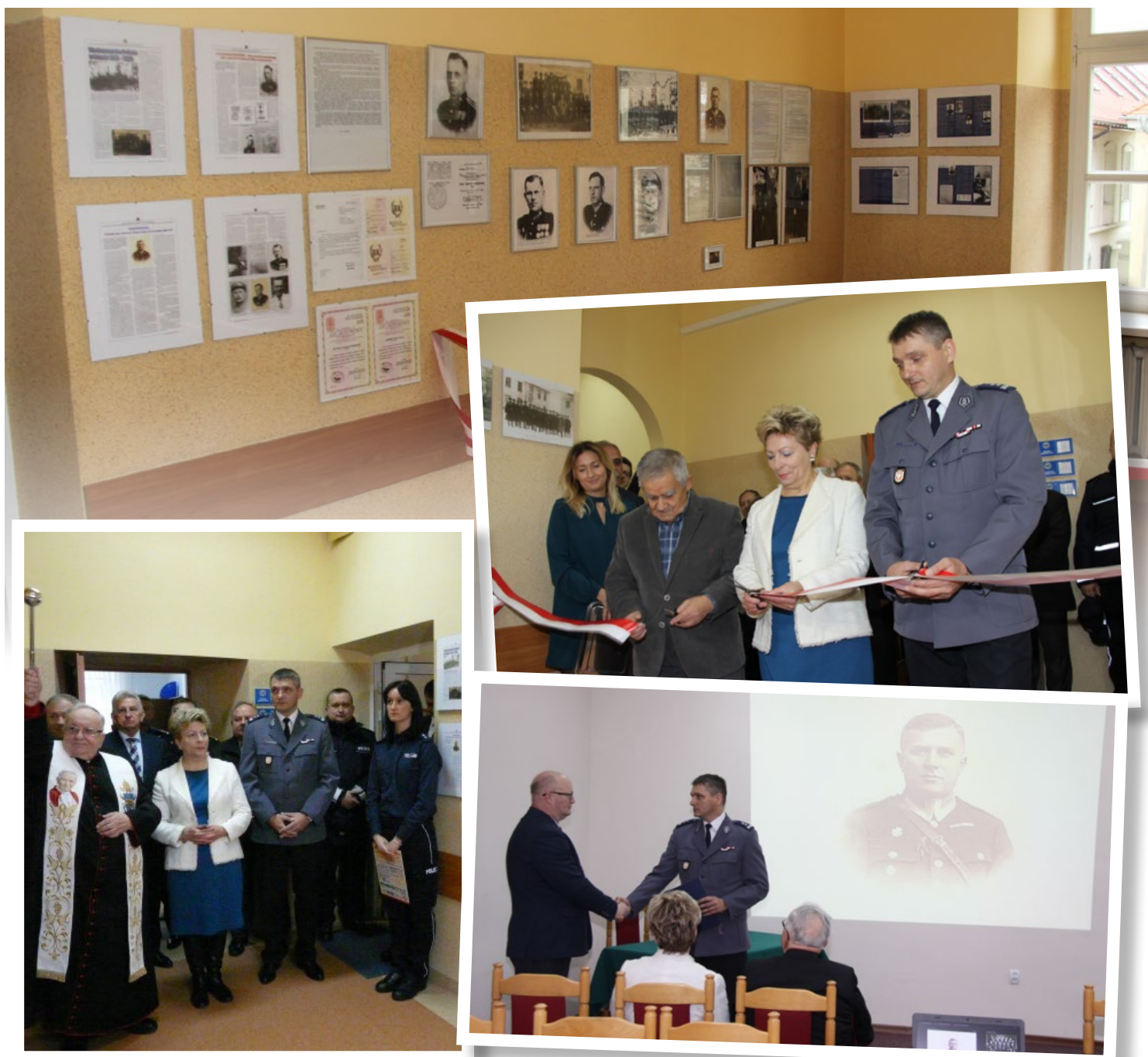
Dzięki wystawie można poznać losy przedwojennych policjantów