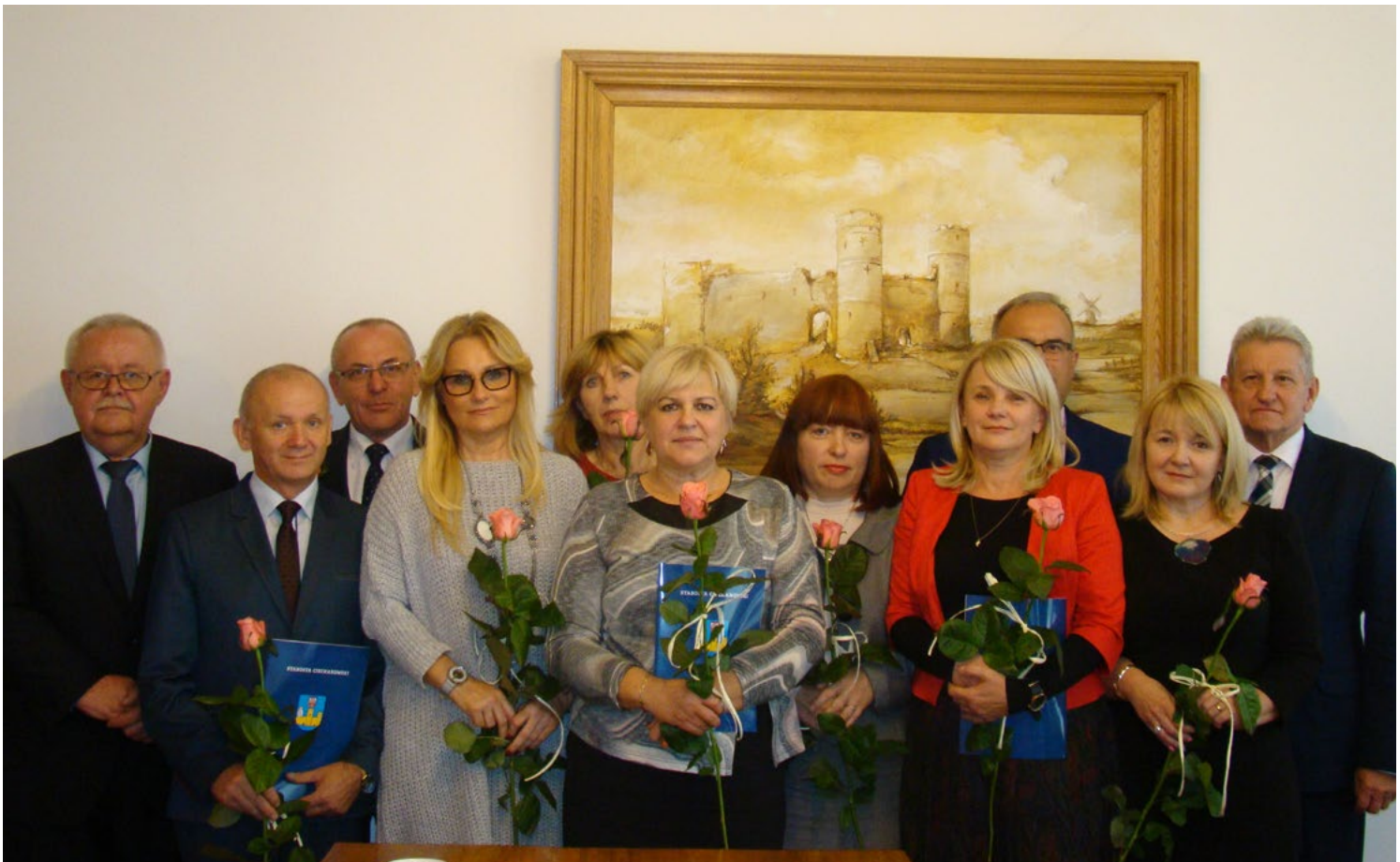
Dyrektorzy szkół i placówek oświatowych prowadzonych przez powiat ciechanowski nagrodzeni z okazji Dnia Edukacji Narodowej 2016 r.