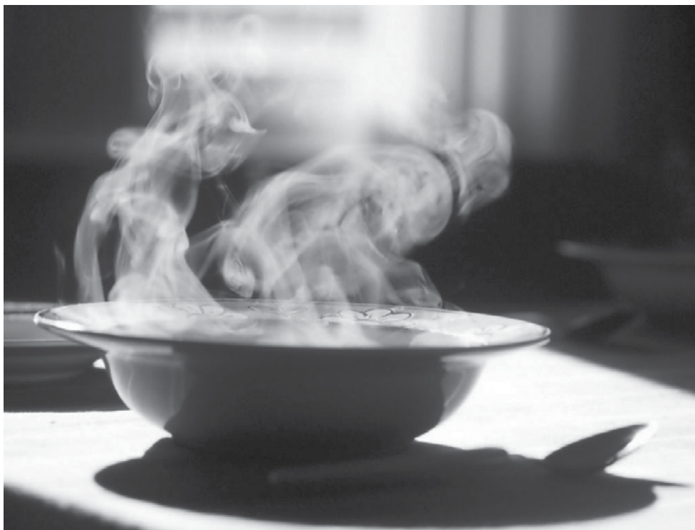
Każdy obywatel może zgłosić osobę, która potrzebuje pomocy w okresie zimowym pod bezpłatnym numerem telefonu 987

Na Mazowszu działają również 23 jadalnie i punkty żywienia (9 w stolicy), wydające dziennie ponad 4,5 tys. posiłków (ok. 2,5 tys. w Warszawie). W czasie nadchodzącej zimy będą także działały wyspecjalizowane