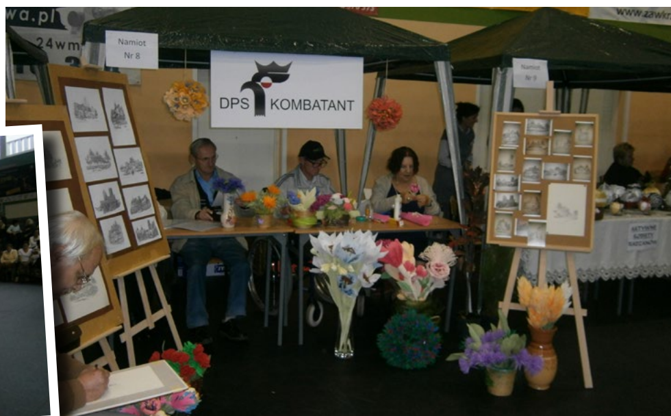
Prezentacja elementów rękodziela, to tylko część udziału w mławskich targach. Był też czas na chwilę rozrywki