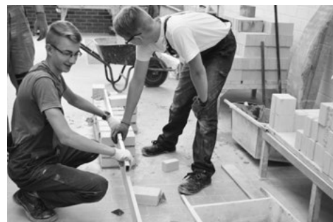
Praktyki zawodowe w Niemczech są już tradycją dla uczniów ZST. Pozwalają na zdobywanie umiejętności, które pomogą im w pracy zawodowej