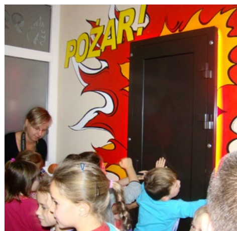
Dzieci chętnie uczestniczyły w lekcji nt. bezpieczeństwa w domu