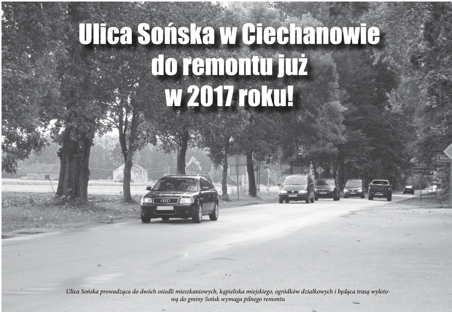
Ulica Sońska prowadząca do dwóch osiedli mieszkaniowych, kąpieliska miejskiego, ogródków działkowych i będąca trasą wylotową do gminy Sońsk wymaga pilnego remontu

Przygotowany przez Powiatowy Zarząd Dróg i złożony przez Powiat Ciechanowski w ramach Programu Rozwoju Gminnej i Powiatowej Infrastruktury Drogowej na lata 2016-2019 wniosek „Rozbudowa drogi powiatowej nr 2421W Nasielsk-Gąsocin-Ciechanów na odcinku ul. Sońskiej w Ciechanowie od km 31+067 do km 33+116” został pozytywnie oceniony przez Mazowiecki Urząd Wojewódzki w Warszawie. Znalazł się on na wysokim drugim miejscu na wstępnej liście rankingowej – drogi powiatowe. Uzyskał 37 punktów, tyle samo, ile znajdujący się na 1 miejscu wniosek Powiatu Ostrołęckiego. Dzięki finansowemu wsparciu możliwa będzie realizacja tej oczekiwanej od lat inwestycji.