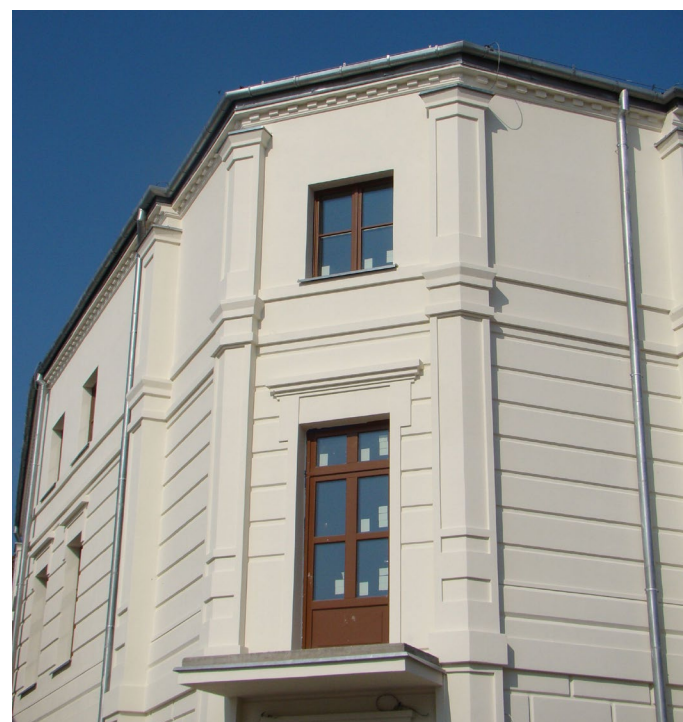
Budynek dawnej Polonii pięknie z dnia na dzień. Nowa elewacja zostanie wykonana wczesną jesienią br.