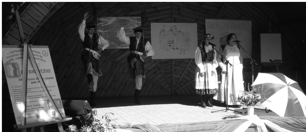
Członkowie zespołu Wiarus podczas występu