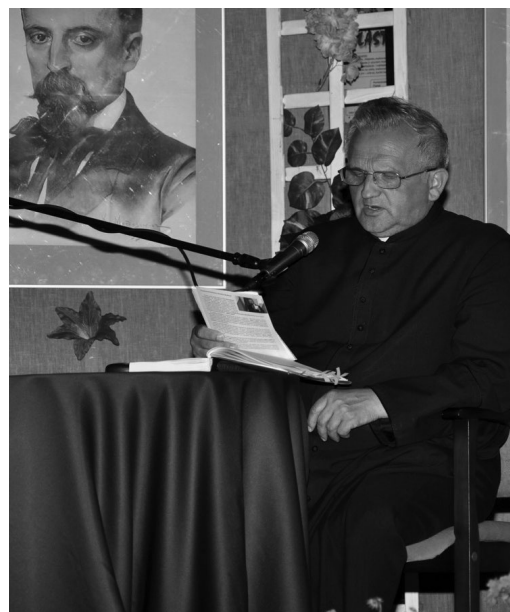
Narodowe Czytanie w Ciechanowie odbyło się po raz piąty i cieszyło się dużą popularnością.