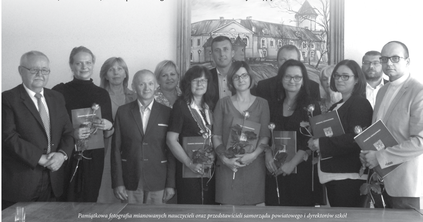
Pamiątkowa fotografia mianowanych nauczycieli oraz przedstawicieli samorządu powiatowego i dyrektorów szkół