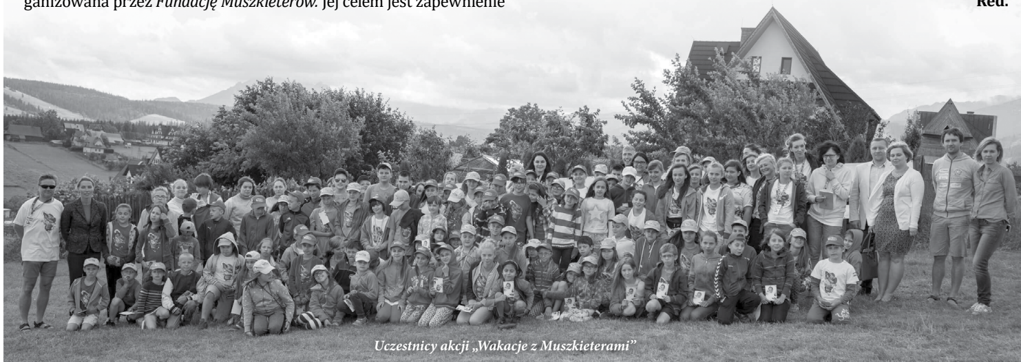
Uczestnicy akcji „Wakacje z Muszkieterami”