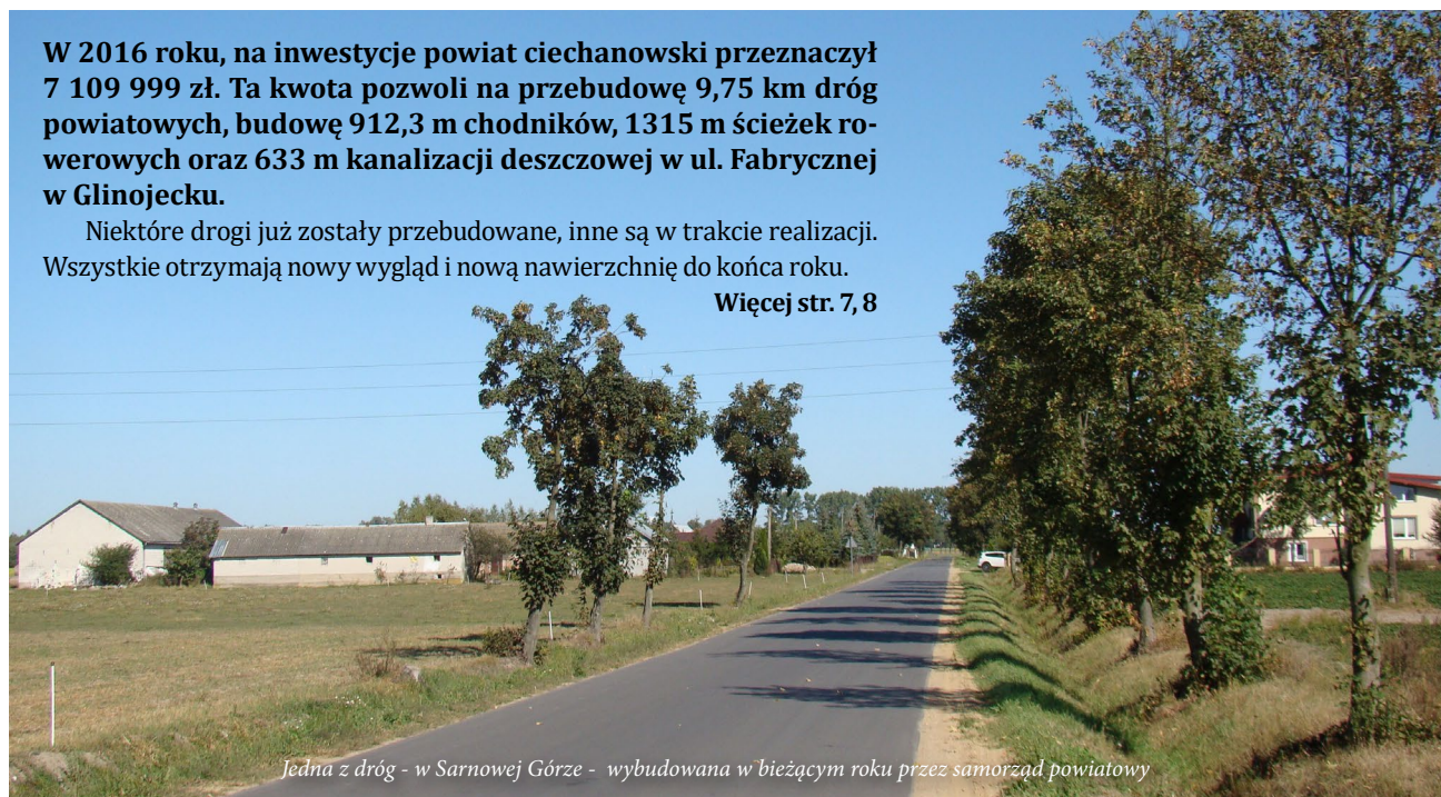
Jedna z dróg - w Sarnowej Górze - wybudowana w bieżącym roku przez samorząd powiatowy

GAZETA SAMORZĄDOWA POWIATU CIECHANOWSKIEGO