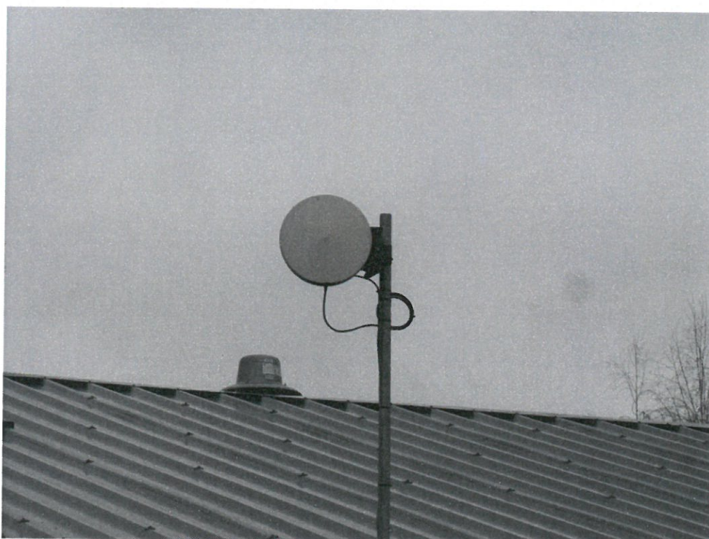
Widok instalacji radiokomunikacyjnej Stacja Netia CIEWB085 - CIEWM00020 Pęczcin, ul. Płocka 2.