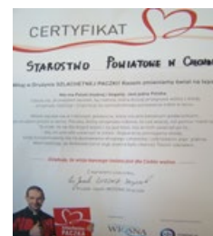
Podziękowanie dla darczyńców za okazaną pomoc

Samotna matka wychowująca niepełnosprawnego syna otrzymała żywność na Święta Bożego Narodzenia, produkty kosmetyczne i higieniczne, bieliznę oraz kuchnię Westfalkę, dzięki której będzie można ogrzać skromne mieszkanie