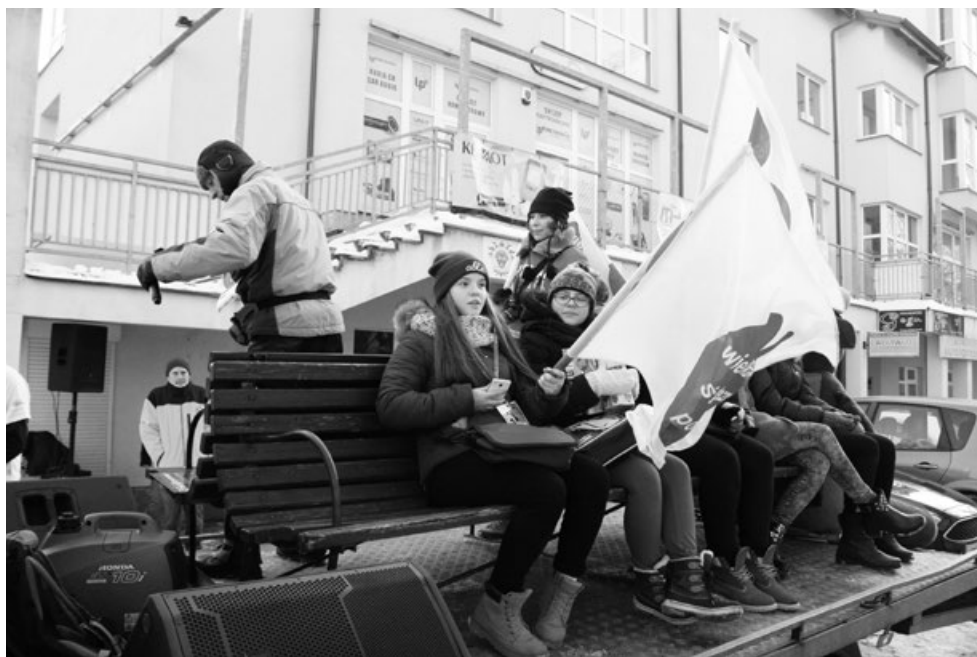
Orkiestrowy korowód był widoczny na ulicach Ciechanowa

Sztab akcji 10 stycznia przygotował dla mieszkańców Ciechanowa i okolic wiele propozycji. Były to, m.in.: debłowy turniej tenisowy, bieg „Policz się z cukrzycą”, alejkami parku J. Dąbrowskiego, spektakl „Nadzieja-Odwaga-Mi-