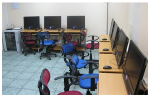
Jedna z pracowni komputerowych w PCKiSz w Ciechanowie