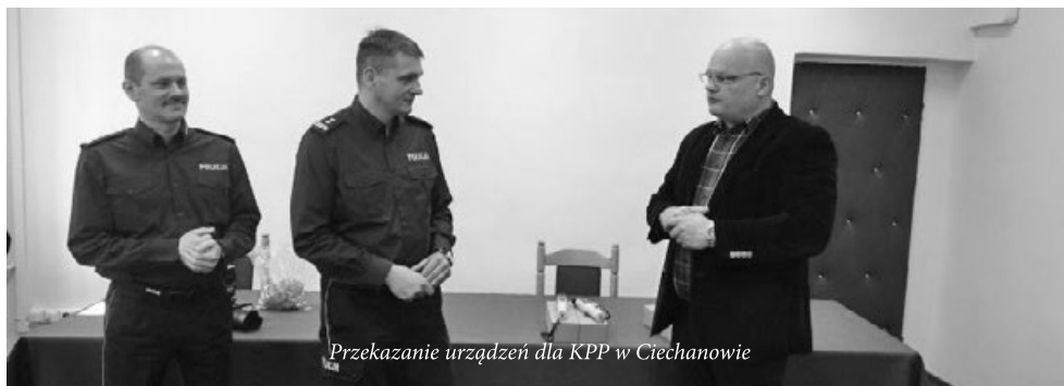
Przekazanie urządzeń dla KPP w Ciechanowie

W Komendzie Powiatowej Policji w Ciechanowie, 14 grudnia 2015 r. odbyło się przekazanie urządzeń typu AlcoBlow.