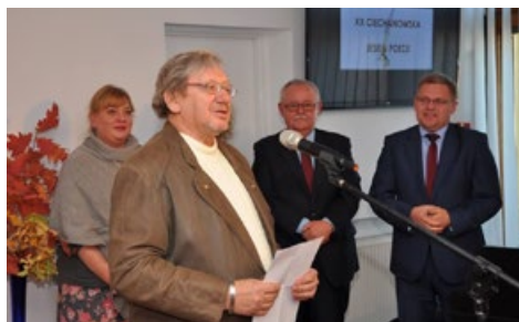
Ciechanowska Jesień Poezji i rozstrzygnięcie konkursu „O Laur Opina”, dofinansowane ze środków budżetu powiatu

Na realizację imprez kulturalnych, wydawanie książek, organizację koncertów i widowisk plenerowych powiat przeznaczył 50 tys. zł., a na organizację zawodów sportowych i wspieranie oraz upowszechnianie kultury fizycznej - 84 tys. zł.