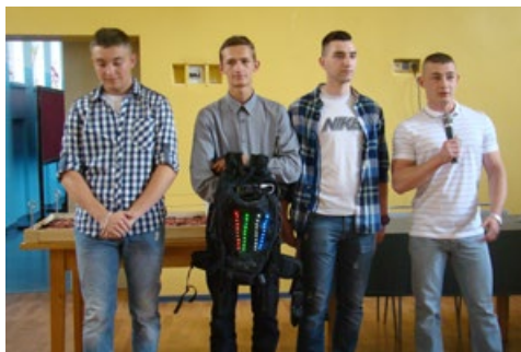
Zwycięska drużyna z „jedyńki” ze swoim wynalazkiem

Czteroosobowy zespół, pod kierunkiem nauczyciela Marka Zimnowodzkiego, przygotował plecak ze świecącymi diodami, które są szczególnie widoczne w ciemności, np. wieczorem na drodze. Uczniowie zdobyli tytuł „super wynalazców”, prestiż i nagrodę pieniężną w wysokości 4 tys. zł. Uroczyste wręczenie wygranej odbyło się w Ciechanowie, w Zespole Szkół nr 1.