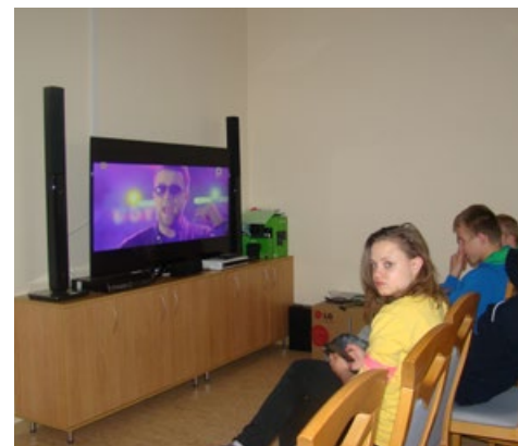
Dzieci i młodzież w nowym budynku internatu mają bardzo dogodne warunki do nauki i wypoczynku

Około pięćdziesiątka dzieci i młodzieży (od przedszkolaków do uczniów szkoły zawodowej) mieszka w ładnych, przytulnych pokojach 3-osobowych, wyposażonych w meble i przedmioty potrzebne do wygodnego zamieszkania, a każdy z nich ma swoją łazienkę. Wszystkie pomieszczenia pomalowane są w neutralne, pastelowe kolory. Do dyspozycji mają też dużą świetlicę z kinem domowym i kilkunastoma stanowiskami komputerowymi. Ogromne znaczenie dla zdrowia i rozwoju dzieci mają także nowoczesnie wyposażone pracownie terapii. Atmosfera w nowym internacie jest bardzo przyjazna, a mieszkańcy przyzwyczajają się do nowych realiów. Wychowankowie pytani o pierwsze wrażenia po zamieszkaniu w nowym budynku podkreślali, że z emocji pierwszej nocy nie mogli zasnąć, ale powoli już się przyzwyczajają. Uczniowie chwalą też nowoczesne boisko z którego chętnie korzystają.