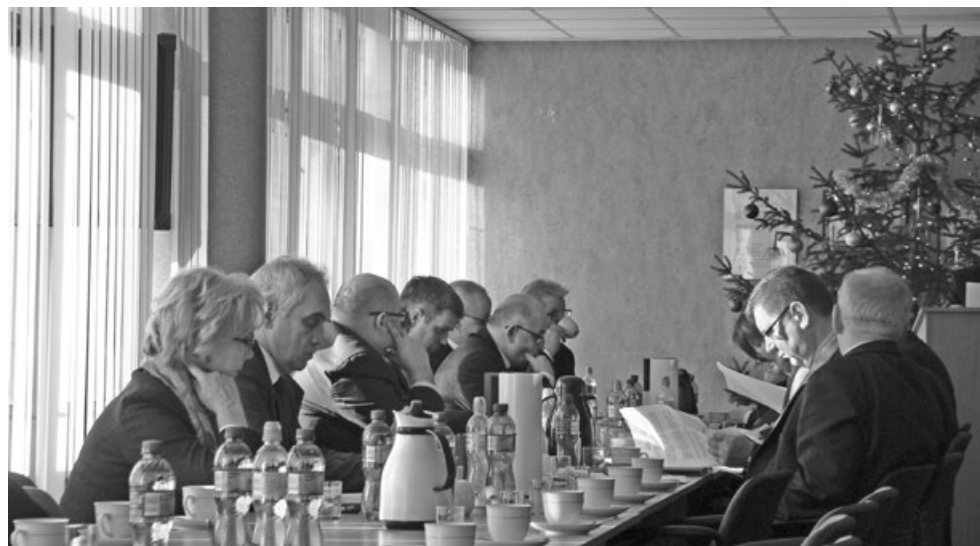
Przebieg obrad grudniowej sesji Rady Powiatu