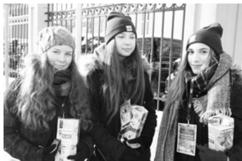
Wolontariuszki, mimo chłodnego dnia z ogromnym zaangażowaniem zbierały pieniądze na ratowanie dzieci i pomoc seniorom

łość” w sali kinowej CKiSz, przygotowany przez uczniów i pedagogów z STO, „WOŚP-owy turniej szachowy” w STO przy ul. Wyspiańskiego, koncert słuchaczy Szkoły Muzycznej Skoczylas w hotelu Baron , koncert przygotowany przez Wojtka Gęsickiego – „Scena Retro” w restauracji Retro oraz koncert Finałowy w Fabryce Kultury Zgrzyt , gdzie zagrały zespoły: Ekipa Remontowa, Petrified KARMA, Suczysty, P.N.G