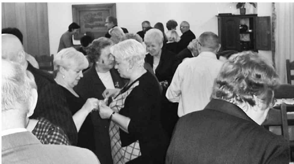
Życzenia zdrowia i wesolych Świąt składali sobie wszyscy członkowie TWK i zaproszeni goście

Dla osób niepełnosprawnych i gości, którzy przybyli na spotkanie, Wigilia z TWK to niezapomniane chwile pokazujące wrażliwość, tolerancję, zrozumienie, a przede wszystkim miłość