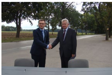
Podpisanie umowy przez szefów samorządów podczas konferencji prasowej przy ul. Sońskiej w Ciechanowie

A planuje się: przebudowę jezdni do szer. 6 m., budowę chodników po obu stronach ulicy i dwukierunkowej ścieżki rowerowej po jednej stronie, odwodnienie terenu kanalizacją deszczową, budowę zjazdów na posesje, uporządkowanie drzew i zieleni przydrożnej, wprowadzenie nowej organizacji ruchu i oznakowania.