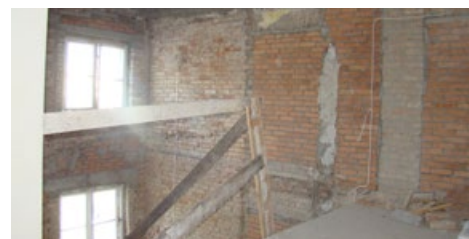
Prace przy remoncie budynku Polonii

Jesienne prace objęły m.in. : położenie instalacji elektrycznych wewnętrznych, tynków wewnętrznych, posadzek, wentylacji, okien i drzwi, budowę schodów zewnętrznych od podwórka, instalację odgromową, instalacje sanitarne wewnętrzne – centralnego ogrzewania, hydrantową, wodociagową i kanalizacyjną oraz zabezpieczenie obiektu przed dostępem osób trzecich i warunkami atmosferycznymi. W 2016 roku do wykonania zostaną: nowa elewacja budynku, drzwi zewnętrzne, instalacje zewnętrzne i zagospodarowanie terenu, w tym ogrodzenie budowli oraz wyposażenie i przeprowadzka zasobów bibliotecznych do nowego miejsca. Prace wykonuje firma Usługi Budowlane REMIRENT Cezary Smoleński z Ciechanowa. Ten etap modernizacji kosztował będzie 1 539 996,40 zł.