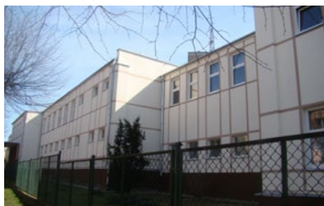
Zmodernizowany obiekt Zespołu Szkół Technicznych w Ciechanowie