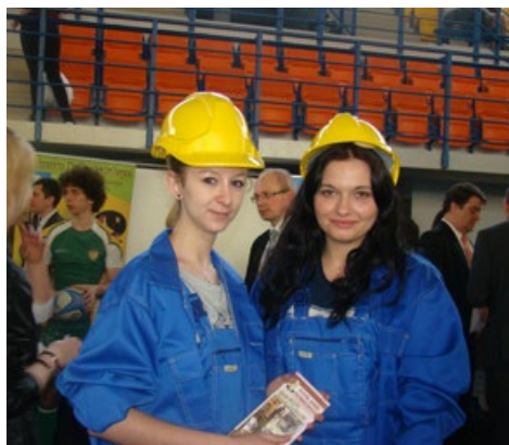
Uczestniczki targów edukacyjnych z klasy o profilu budowlanym ZST w Ciechanowie

Na targi przygotowano 66 stoisk, na których prezentowało się: 12 uczelni i szkół wyższych, 11 szkół ponadgimnazjalnych, 6 szkół policealnych,