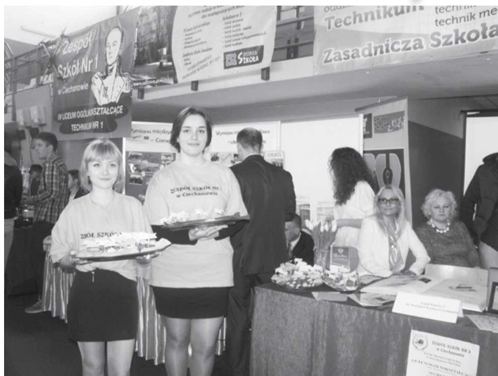
Uczniowie i pedagodzy prezentujący szkołę podczas Tragów Edukacji i Pracy 2015