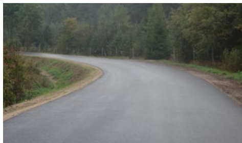
Wyremontowany odcinek drogi w okolicach Chotumia

Największą inwestycją zaplanowaną na ten rok, była przebudowa drogi powiatowej Ościsłowo-Sulerzyż-Chotum na odcinku Sulerzyż-Chotum. To blisko 4 kilometrowy odcinek trasy powiatowej nr 1232W. To kolejny etap modernizacji, dofinansowany w ramach „Narodowego programu przebudowy dróg lokalnych - Etap II Bezpieczeństwo - Dostępność - Rozwój”. Prace modernizacyjne objęły: przebudowę drogi o długości 3 566,50 m, przebudowę chodnika na odcinku o długości 93, 3 m, przebudowę 102 zjazdów (w tym: 3 zjazdy publiczne i 99 zjazdów na posesje prywatne), budowę mostu o długości 4,38 m i szerokości 8,46 m. Wartość inwestycji to 2 844 602,54 zł.