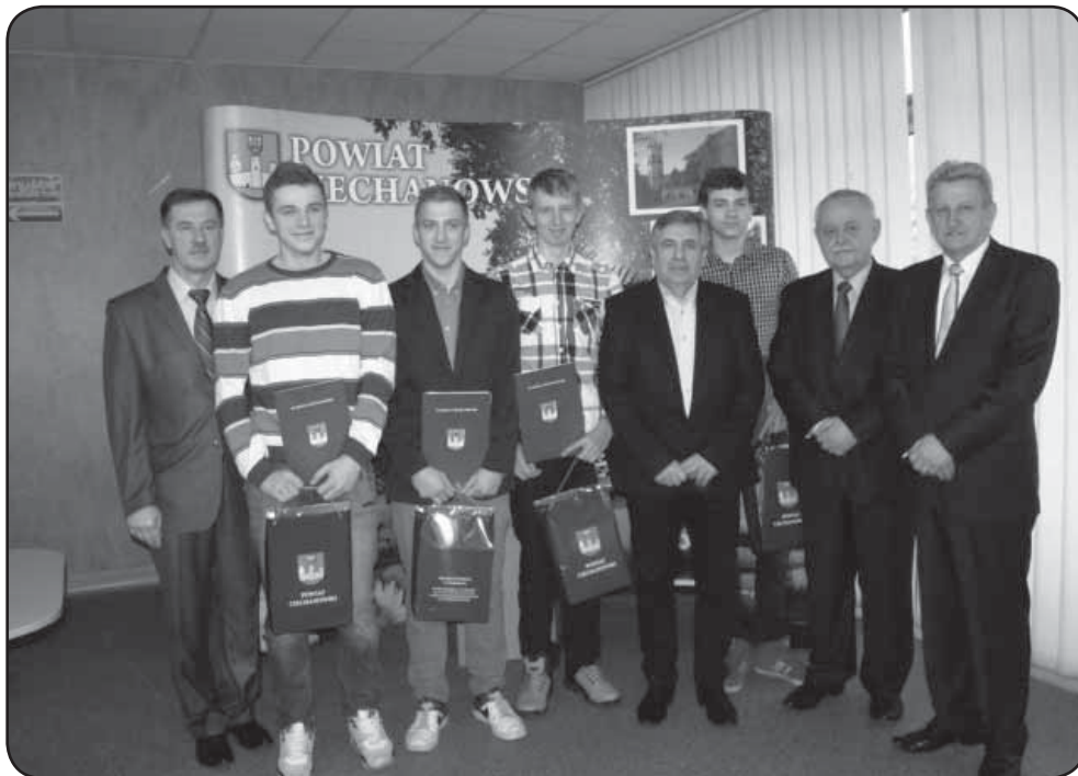
Tym razem zostali nagrodzeni sportowcy - kolarze

Jednym ze znaczących elementów budżetu powiatu na przyszły rok są środki na realizację