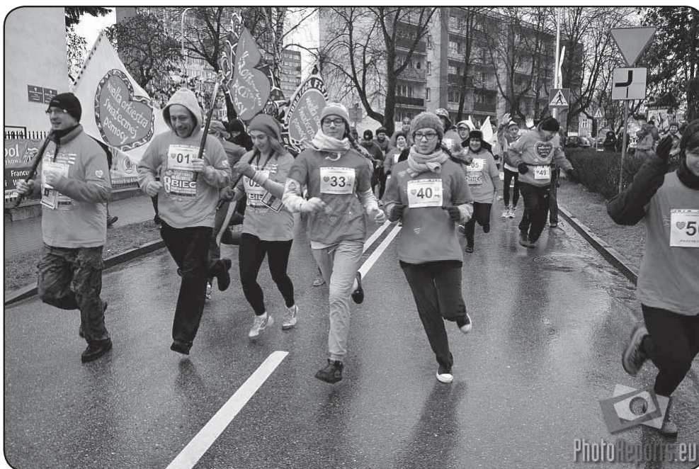
Uczestnicy biegu charytatywnego „Policz się z cukrzycą” – na trasie

Sztab związany z powiatowym domem kultury przygotował mnóstwo atrakcji, m.in.: bieg charytatywny „Policz się z cukrzycą”, pokazy i warsztaty kuglarskie na placu przy PCKiSz, pokaz gry w Petanke – na błoniach zamkowych, pokaz jazdy samochodami terenowymi po błoniach zamkowych z możliwością przejażdżki za datki do puszeki, turniej szachowy w Społecznej Szkole Podstawowej STO. Dużą atrakcją był przejazd kolorowego ORKIESTROWOZU ulicami miasta. Głównym punktem ciechanowskiego finału był