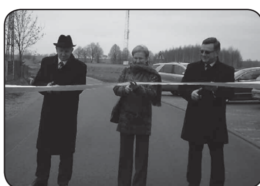
Tak przebiegał remont drogi do Sulerzyża i jej oficjalne otwarcie