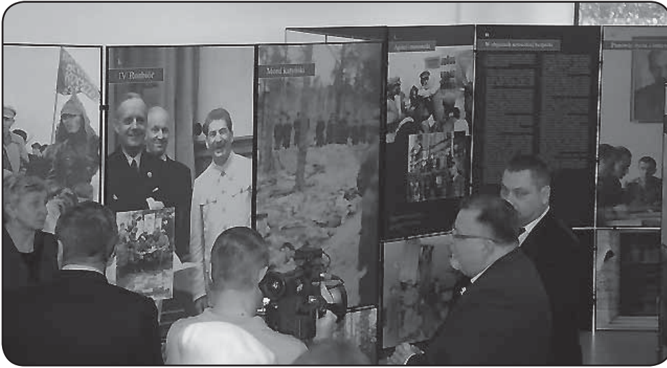
Wystawa powinna być obowiązkową dla nauczycieli historii i młodzieży ciechanowskich szkół

pt. „W objęciach Wielkiego Brata. Sowietci w Polsce 1944-1993”. Ta niezwykle ciekawa ekspozycja dostępna jest w holu uczelni przy ul. Narutowicza, na I piętrze. Warto się na nią wybrać! Apel kieruję szczególnie do nauczycieli, młodzieży szkolnej, a dla studentów uczelni, gdzie jest ona prezentowana taka wystawa powinna być obowiązkową.