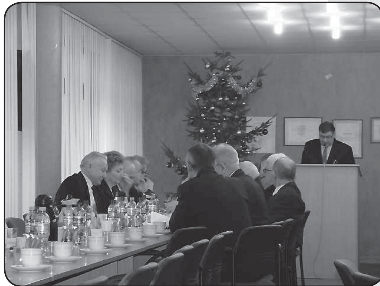
Radni składają interpelacje i zapytania

Mulda, która zdaniem jednych mieszkańców jest przeszkodą w jeździe tą ulicą, dla innych jest progiem zwalniającym – dodał kierownik.