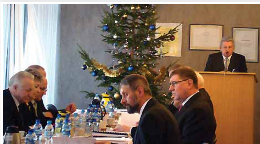
Budżet powiatu ciechanowskiego na 2014 rok będzie największym w historii samorządu

Jednym ze znaczących elementów budżetu powiatu na przyszły rok są środki na realizację projektów unijnych, których ter-