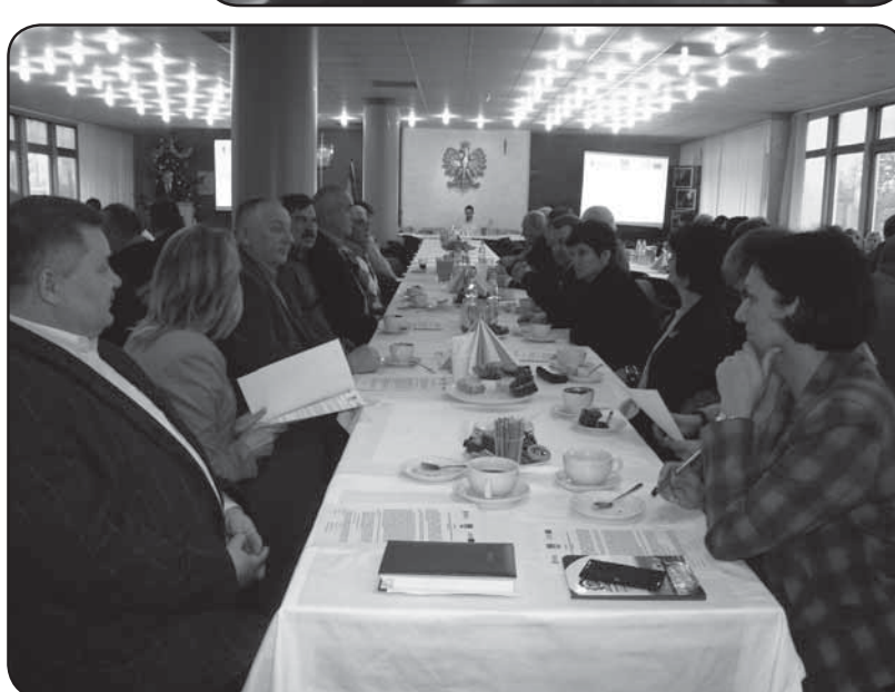
Konferencja inauguracyjna projekt odbyła się w Starostwie Powiatowym w grudniu 2013 r.