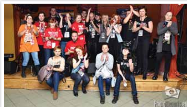
Sztab akcji WOŚP, działający przy Powiatowym Centrum Kultury i Sztuki spisał się na medal, przygotowując na Finał wiele atrakcji