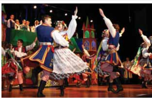
LZA Ciechanów, to mistrzowie w swoim gatunku, ich występ na scenie wzbudził radość i zachwyt

06-400 Ciechanów ul. Płońska 61 tel. 502 11 44 11 e-mail: pexet@pexet.pl www.pexet.pl