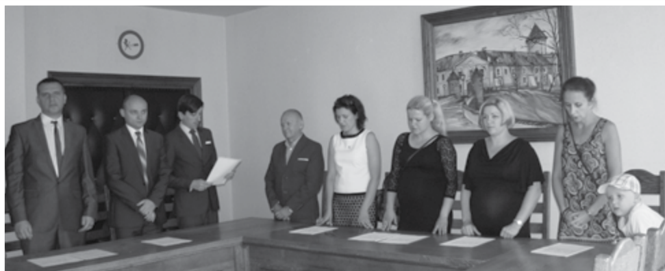
Uroczyste wręczenie aktów awansu zawodowego odbyło się w Starostwie Powiatowym w Ciechanowie