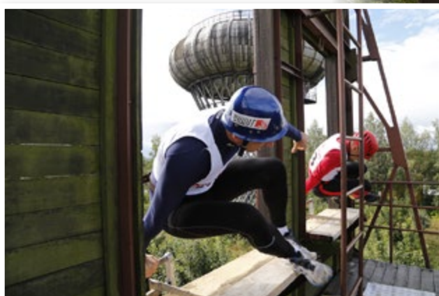
Strażacy podczas zawodów w Ciechanowie

Do udziału w Turnieju zgłosiło się 62 zawodników z 11 komend powiatowych i miejskich z terenu województwa mazowieckiego, reprezentujących: Ciechanów, Kozienice, Łosice, Ostrołękę, Ostrow Mazowiecka, Płońsk, Pruszków, Siedlce, Sokołów Podlaski, m.st. Warszawę JRG 7 i Zwolen.