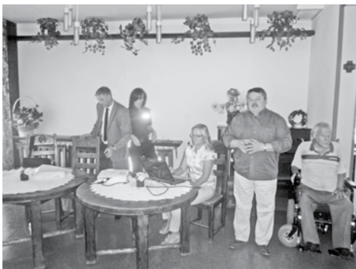
Spotkanie w DPS „Kombatant” nt. bezpieczeństwa seniorów