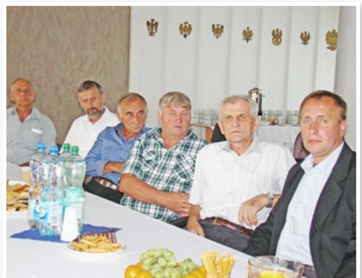
Konferencja za zakończenie projektu e-Integracja