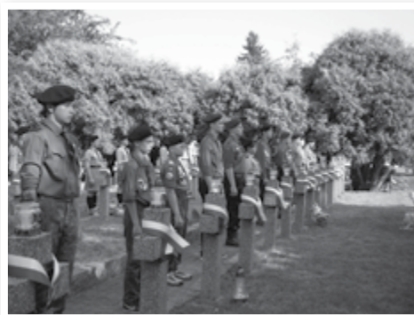
Przebieg uroczystości z okazji 76 rocznicy wybuchu II wojny światowej