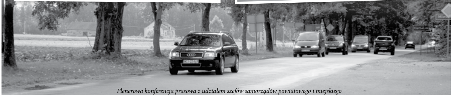
Plenerowa konferencja prasowa z udziałem szefów samorządów powiatowego i miejskiego