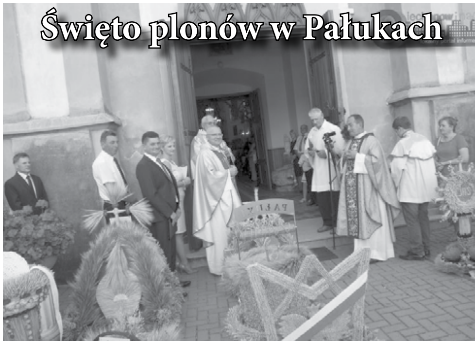
Wieńce dożynkowe przygotowane przez mieszkańców zachwycały kolorami i perfekcją wykonania

Wielkim wydarzeniem dla mieszkańców gminy Opinogóra Górna były tegoroczne dożynki, które odbyły się 30 sierpnia w Pałukach. Rozpoczęły się mszą św. w kościele parafialnym w Pałukach, skąd barwny korowód z dożynkowymi wieńcami przeszedł na plac przy remizie, gdzie odbyła się część rozrywkowa.