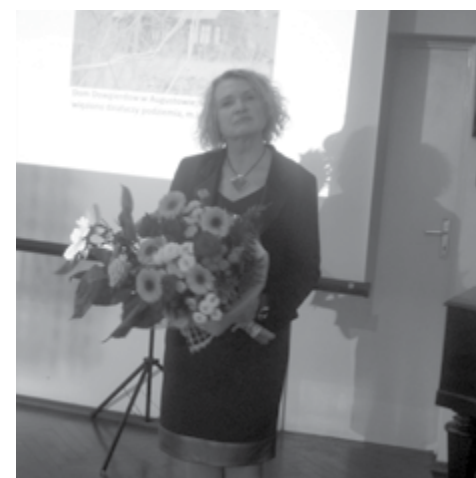
Autorka podczas promocji książki w Ciechanowie

Przesłuchiowano w nich zatrzymanych, bito i torturowano metodami stosowanymi w stalinowskim aparacie okrucieństwa i terroru. Do dziś nie wiadomo co stało się z dużą liczbą zaginionych bez wieści Polaków - jak ich zlikwidowano, gdzie i w jakich miejscach zakopano zwłoki. Do tej pory podawano, że liczba ofiar Obławy Augustowskiej wynosi 592 osoby - Oddział IPN w Białymstoku prowadzi też w takim kierunku śledztwo, jednak w świetle ostatnich badań wiadomo, że ofiar Obławy było więcej, nawet 2 tysiące. Autorka przybliżyła tę dopiero teraz odkrywaną zbrodnię za pomocą dokumentalnych reportaży o siedmiu świadkach historii - opatrzonych zdjęciami, dokumentami archiwalnymi, źródłami oraz syntezą historyków. To kolejna książka pisarki opowiadająca o tragicznych losach Polaków. Wcześniej ukazały się jej książki nt. dzieci żołnierzy zamordowanych w Katyniu, zbrodni katyńskiej, losów Polaków, którzy osiedli po wojnie na wyspach brytyjskich, a jeszcze wcześniej o losach Polaków, którzy emigrowali za chlebem do Brazylii i USA. Promocja książki „Obława Augustowska” odbyła się w Ciechanowie 16 września, podczas XVI