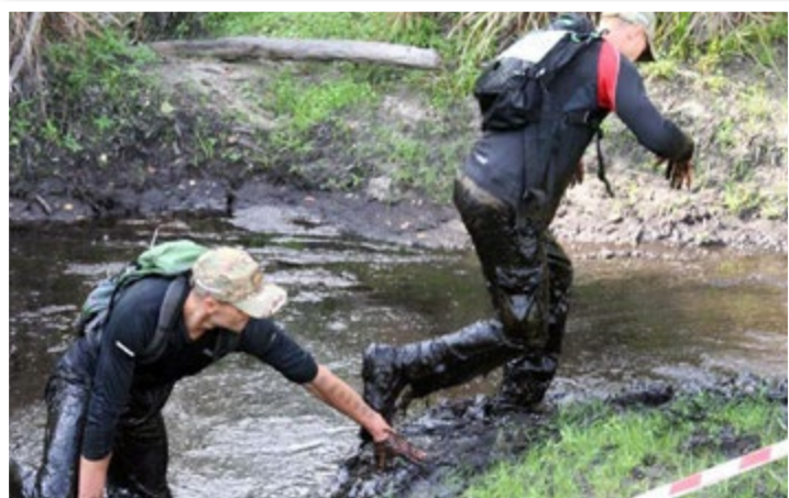
Trasa biegu obfitowała w bardzo trudne zadania do wykonania