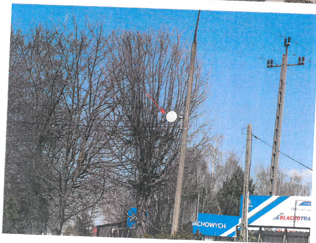
Widok instalacji radiokomunikacyjnej Stacja Netia CIEWB079 - CIEWM00018 Ciechanów, ul. Niechodzka 6.